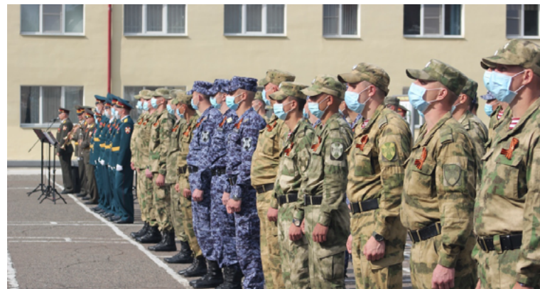
Молодые люди в возрасте от 18 до 27 лет пополняют ряды Вооруженных сил России этой осенью

напоминает, что действующим законодательством предусмотрена ответственность за уклонение от воинской службы, под которым понимается неявка без уважительных причин по повестке военного комиссариата на мероприятия, связанные с призывом. Кроме того, уклонением