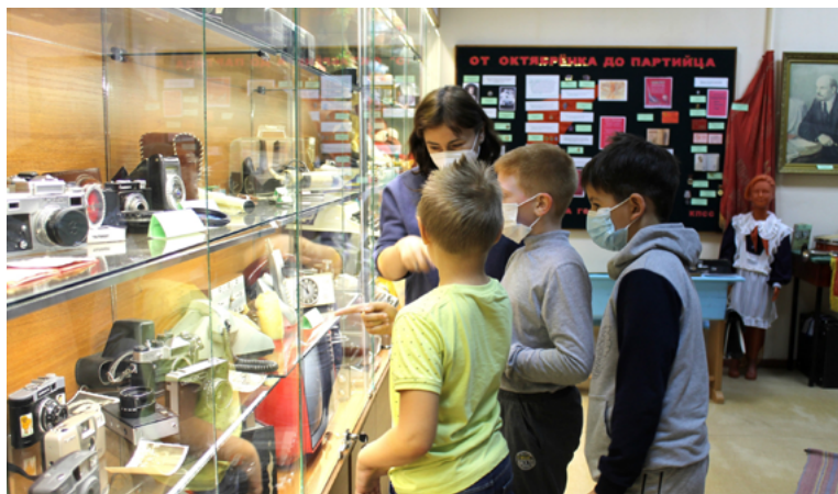
Основной темой проекта стало сохранение памяти о победе в Великой Отечественной войне

избежать искажения истории нашей страны. В рамках проекта в зале славы историко-краеведческой экспозиции «Истоки»