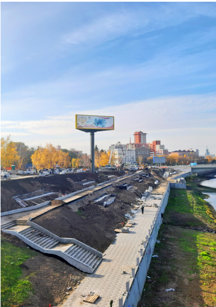
Благоустройство берегов Оми планируется завершить к началу ноября