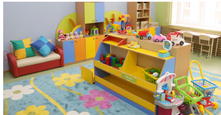
В группах есть всё для игр

спальные и групповые комнаты, спортивный и музыкальный залы, детская лаборатория, кабинеты педагога-психолога и дефектолога, оснащенный пищеблок и прачечная, лифт. В приемной установили удобные шкафчики для одежды. Всё оборудование, детскую ростовую мебель, игровой, дидактический материал выполнили в яркой цветовой гамме.