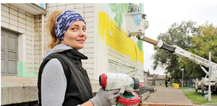
В преобразении Омска приняли участие художники из Сургута