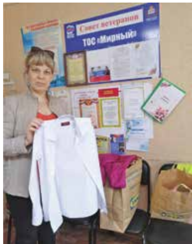
За время проведения акции более тысячи омичей, находящихся в трудной жизненной ситуации, смогли получить помощь