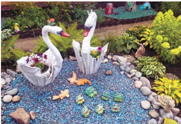
Лучшие объекты по всем шести номинациям попали во второй (городской) этап

2-е место – дом № 16, улица Проскуракова;