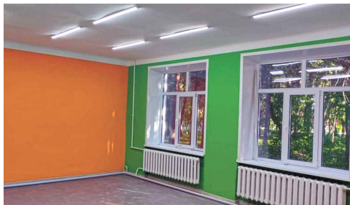
Ремонтные работы в рамках меценатской помощи в школе № 15 завершены