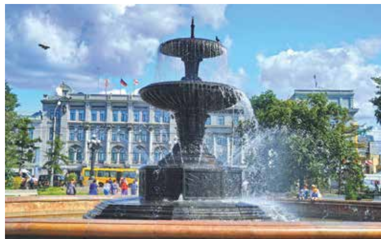
Высокий статус иностранных делегаций, посещающих Омск, свидетельствует о его значимости

развивать имеющиеся связи на благо страны и будет принимать активное участие в совместных проектах.