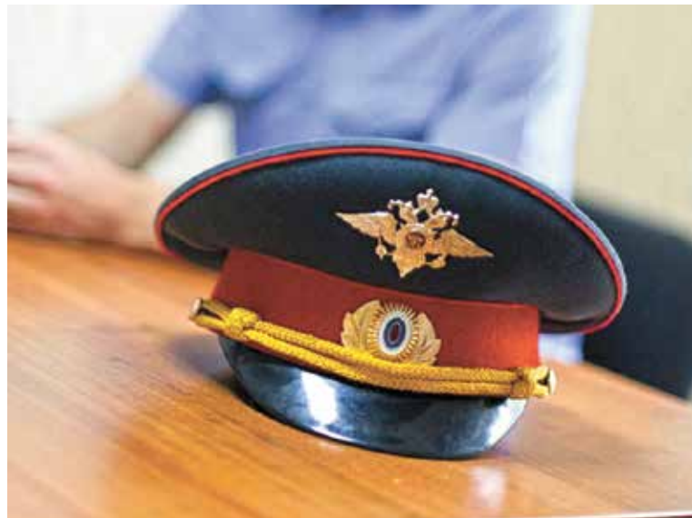
Смотр-конкурс среди участковых уполномоченных и участковых пунктов полиции проводится с 2006 года

В администрации Советского округа завершился первый этап смотра-конкурса среди участковых пунктов полиции № 7 и 8 УМВД России по городу Омску.