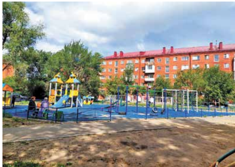
Благоустройство микротерритории у домов 27, 27А по улице Нефтезаводской

Благоустройство микротерриторий в Советском округе выполняется подрядной организацией «ЗавГор». Все этапы контролирует ФГБОУ ВО «СИБАДИ».