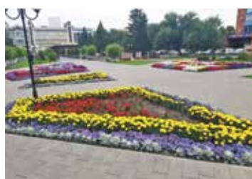
В оформлении города использовалась цветочная рассада, выращенная в муниципальной теплице и поставщиками

В этом году к высадке цветочной рассады в открытый грунт озеленители городского «Управления дорожного хозяйства и благоустройства» приступили в начале мая, закончили оформление клумб в начале августа. Финальным аккордом, завершающим сезон цветочных посадок, стала подготовка Выставочного и Воскресенского скверов к «Флоре».