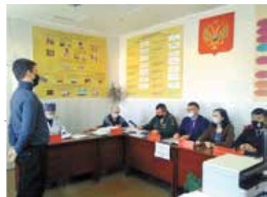
Армейская служба – это хорошая жизненная школа для нашей молодежи

Обращаем внимание, что призывники, которые на момент окончания сроков призыва не явились в военкомат, находятся в розыске и будут привлечены к ответственности за нарушение закона о воинской обязанности и правил призыва.