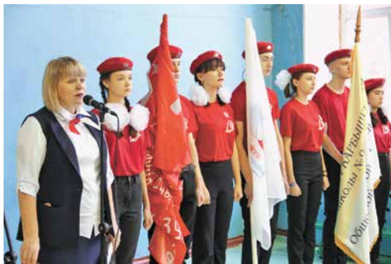
Накануне патриотическая экспозиция открылась также в школе № 90

«В истории каждой страны есть памятные исторические события, которые говорят о мужестве и героизме наших защитников. У каждой страны должна быть сила, чтобы защищать свои интересы, интересы страны и интересы соседних стран, которым нужна помощь. Участников войны становится все меньше и меньше, они были героями и в тылу, и на фронте. У нас в Омске сотни улиц названы в честь Героев России.