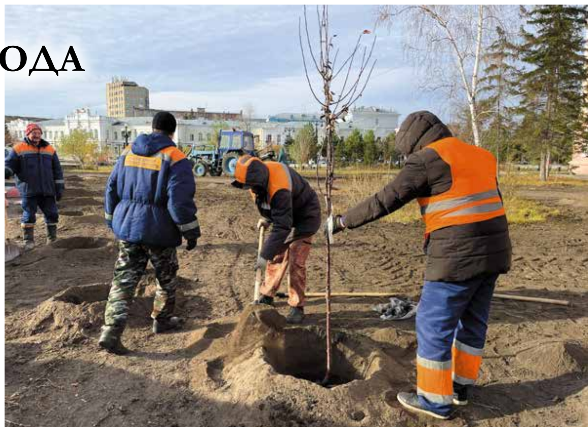
Чтобы дерево прижилось, в течение трех лет нужно регулярно за ним ухаживать и тщательно поливать

Предпочтение традиционно отдается растениям, которые эффективно очищают воздух от вредных примесей. Так, например, желтая акация задерживает азот и аммиакосодержащие выбросы, вяз отлично улавливает пыль, черемуха – хлористые соединения, а хвойные деревья фильтруют вредные выхлопы и взвеси. Декоративно-лиственные