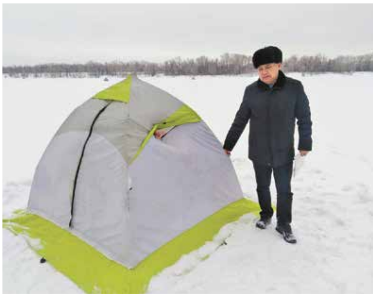
На территории Советского округа регулярно обследуют 15 водоемов

✓ лед зеленоватого оттенка толщиной 7 см – безопасный, он выдерживает одного человека,