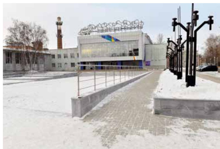
Благоустройство территории у ДК «Звездный» в этом году продолжится

Кроме того, этот год станет стартовым для благоустройства небольших зон рекреации, так называемых микротерриторий. В Советском округе в результате голосования были выбраны