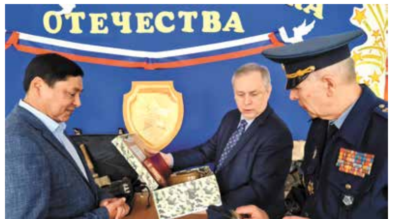
Школьный музей пополнился новыми экспонатами