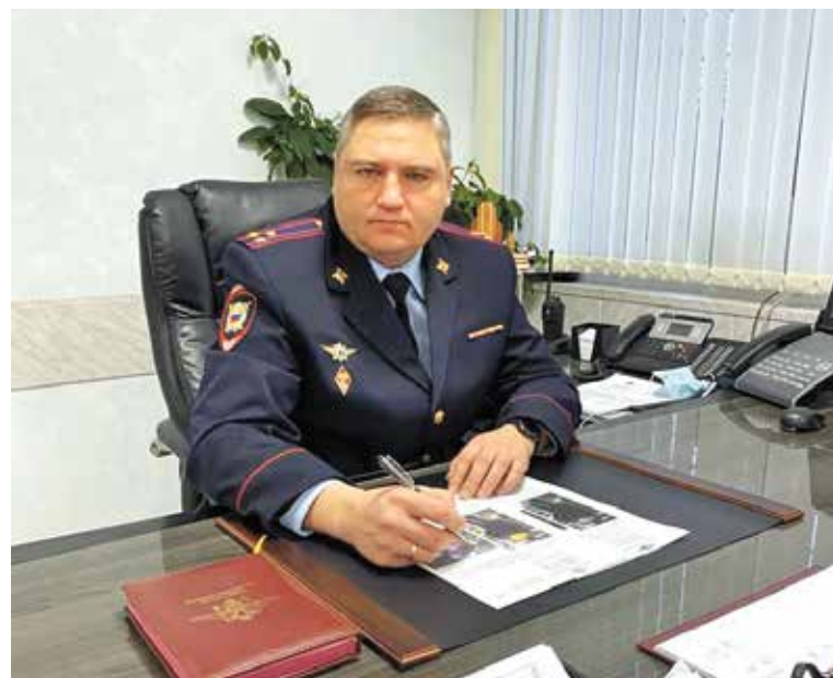
Полиция призывает граждан быть бдительными

✓ не верьте незнакомцам, не совершайте никаких действий под их диктовку, проверяйте поступающую от них информацию на