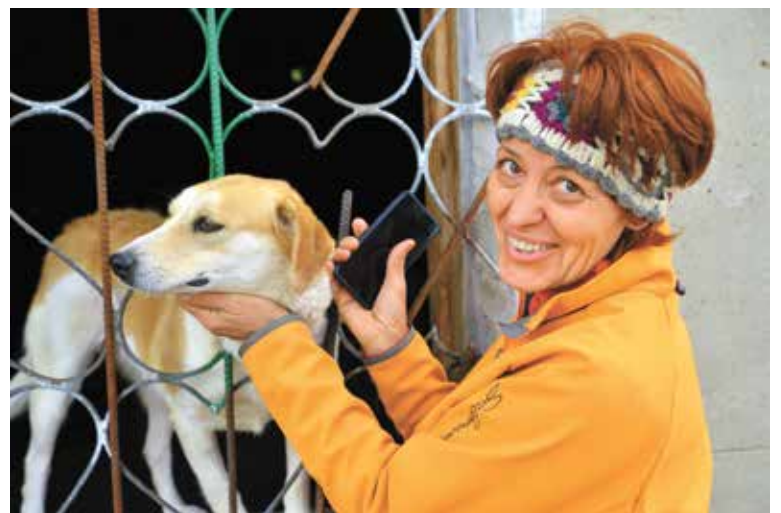
Сотрудники муниципального приюта ждут добровольцев, готовых помочь в выгуле собак

«Все мы в ответе за тех, кого приручили. К сожалению, кто-то заводит собаку, не понимая меры ответственности, а потом животные оказываются на улице, поэтому цель благотворительной акции – привлечь внимание омичей к традициям добра. При этом важно отметить помощь волонтеров Советского округа приютам. Ребята знают, что, проявив заботу в отноше-