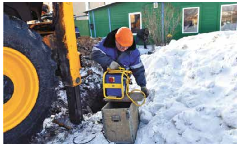
Заявку на газификацию можно оформить через сайт Госуслуг

Омичей просят не подавать заявку сразу всеми возможными способами, так как в этом случае оператору приходится обрабатывать одну и ту же заявку несколько раз.