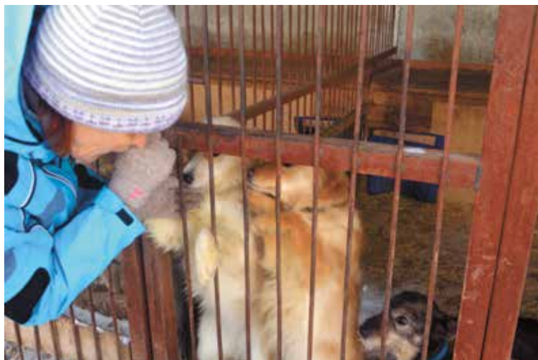
Для социализации животным нужно общение с человеком

Каждую субботу с 11:00 до 15:00 сотрудники муниципального приюта ждут добровольцев, готовых помочь в выгуле щенков и собак, ведь для социализации «постояльцев» приюта нужно общение с человеком. Время посещения приюта – ежедневно в рабочие дни с 13:00 до 15:00 для тех, кто ищет потерянных питомцев.