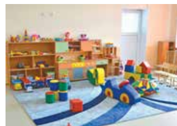
Детские сады обеспечены оборудованием и игрушками

Кроме того, в 2020 году были выполнены ремонтные работы для открытия 13 дополнительных групп на 250 мест для детей до 3 лет в 13 в действующих детских садах.