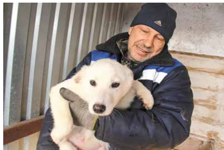
Сотрудники муниципального приюта ждут добровольцев, готовых помочь в выгуле собак

Помощь для животных горожане могут привезти в администрацию Советского округа по адресу: ул. Красный Путь, 107 (с 8:30 до 17:45). Стройматериалы для будок и вольеров, сетку-рабицу, доски, линолеум, одеяла, утеплители для