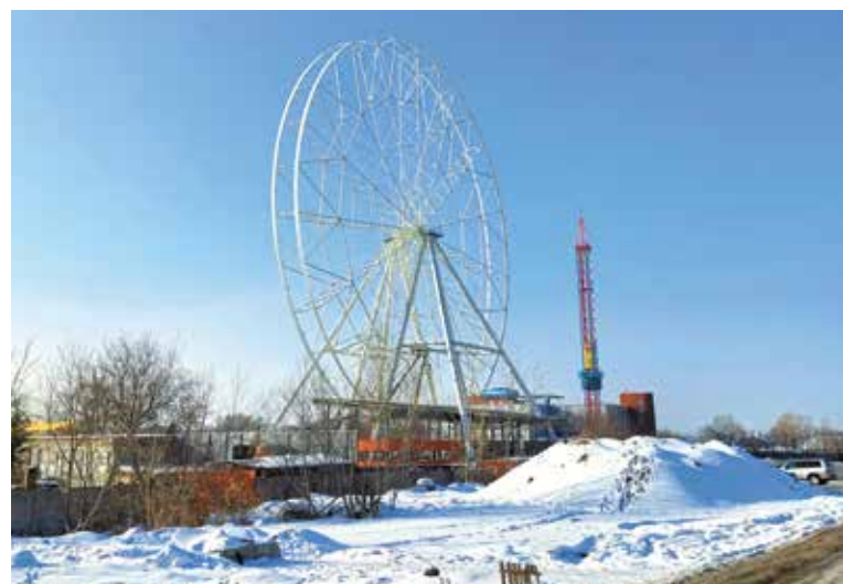
Новое колесо обозрения – один из аттракционов, который заработает в парке «Зеленый остров»

«Формирование комфортной городской среды – это обо всем, что окружает нас. Это красивые