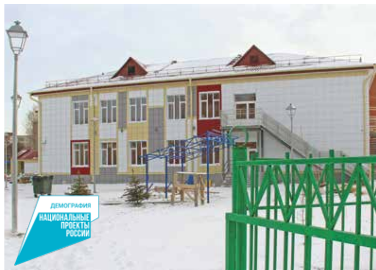
В новом здании созданы все условия для воспитания и развития детей

«Детский сад по улице Тюленина двухэтажный, рассчитан на 6 групповых ячеек. На первом и втором этажах – по три групповых ячейки для детей от полутора до семи лет. Также на первом