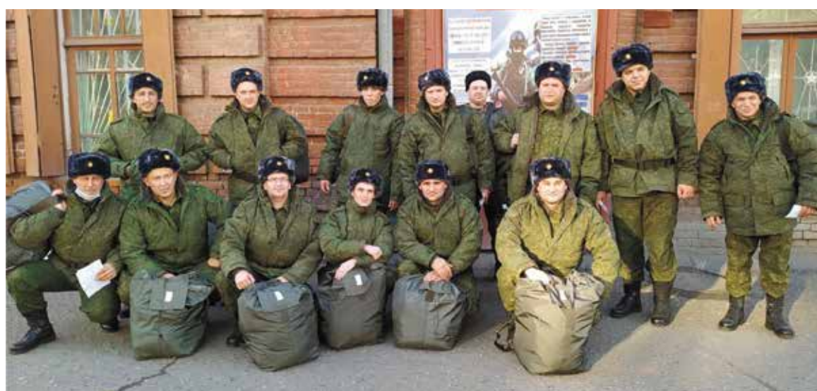
Зачисленные в резерв должны проходить военные сборы и посещать учебные занятия

ные абонементы на тренировки в спортивных комплексах Министерства обороны России. Кроме того, призванные на военные сборы обеспечиваются необходимыми вещами и питанием.