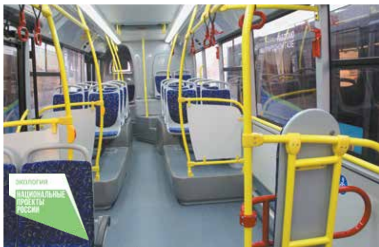
В автобусах ЛиАЗ просторные накопительные площадки

Отметим, что автобусы ЛиАЗ 529267 полностью низкопольные, что позволяет кондуктору и пассажирам безопасно перемещаться по всей длине салона, а также обеспечивает более быстрый пассажирооборот на остановочных пунктах. Пневматическая система наклона кузова делает посадку и высадку из автобуса комфортной, а в совокупности с откидной аппарелью максимально облегчит доступ в автобус людей с ограниченными возможностями. С внешней стороны автобусы оборудованы кнопками вызова водителя, а в центральной части салона расположено специальное место для колясок.