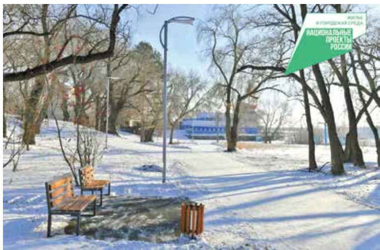
Прогулки на «Зеленом острове» станут комфортнее

В 2022 году в рамках реализации федерального проекта «Формирование комфортной городской среды» национального проекта «Жилье и городская среда» на территории Советского округа запланировано проведение работ по благоустройству трех общественных территорий – площади у Дворца культуры студентов и молодежи «Звездный» (2-я очередь), парка культуры и отдыха «Зеленый остров» (2-я очередь), площади им. Лицкевича (1-я очередь), а также 18 микротерриторий.