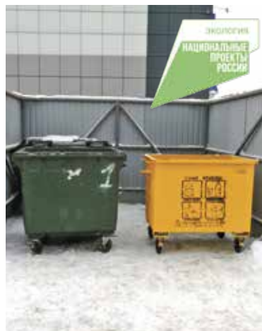
На желтые контейнеры нанесена инструкция о том, какие отходы нужно в них складывать

В контейнеры для отсортированного мусора омичи должны выбрасывать то, что может обрести вторую жизнь, – это стекло, жестяные или алюминиевые банки, пластик, в том числе полиэтилен и пищевая пленка, а также