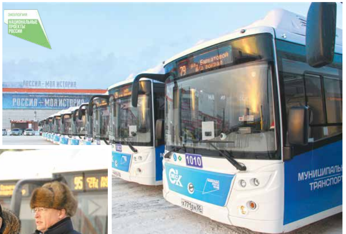
Новые автобусы работают на природном газе

лям я желаю чистых и ровных дорог и хороших, добрых, позитивных пассажиров».