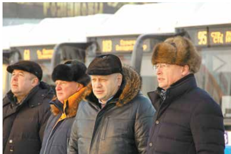
Руководители города и области на презентации автобусов

обновление уже произведено наполовину. И вот сегодня мы вручаем 51 автобус большой вместимости – очень теплые, комфортные средства передвижения. Дорогие друзья, я еще раз поздравляю жителей Омска, всех тех гостей, которые будут пользоваться этим прекрасным автотранспортом. Ну а водите-