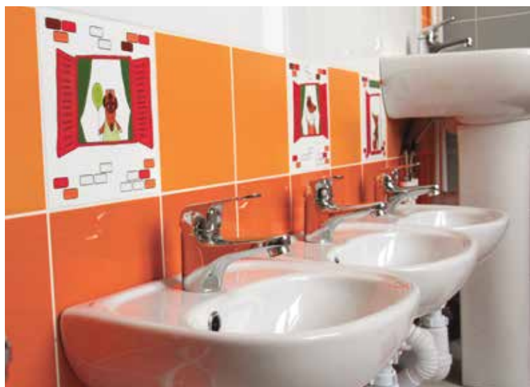
Детский сад смогут посещать 140 ребятишек от полутора до семи лет

Сегодня в рамках национального проекта «Демография» в Омске завершается строительство еще двух детских садов. Это учреждения в микрорайоне Прибрежный на 260 мест (Кировский округ) и в микрорайоне Большие Поля на 140 мест (Советский округ).