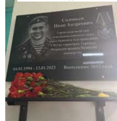
Доску памяти Ивана Соловьёва установили в помещении кадетской школы

Также мастерицы начали осваивать швейное ремесло, взяв в работу пошив повязок «свой – чужой», материал для которых приобрели на свои средства.