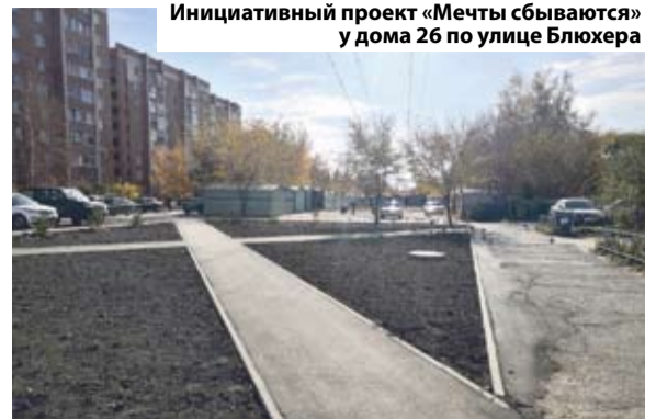
Инициативный проект «Мечты сбываются» у дома 26 по улице Блюхера