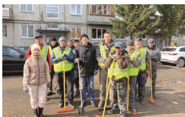
В рамках субботника на территории округа собрано и вывезено более 300 кубометров мусора

Вдоль улиц Заозерной и Энтузиастов убрали территорию 100 сотрудников департамента имущественных отношений.