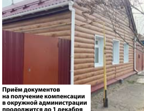
Приём документов на получение компенсации в окружной администрации продолжится до 1 декабря

сетей газоснабжения в границах земельного участка.