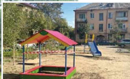
Малые архитектурные формы во дворе дома 25 по улице 19 Партсъезда