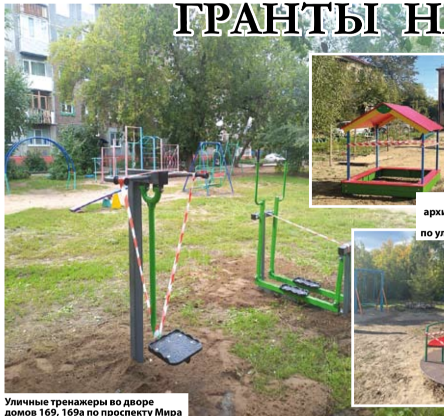
Уличные тренажеры во дворе домов 169, 169а по проспекту Мира