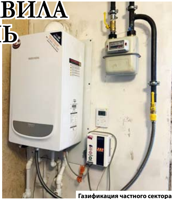
Газификация частного сектора