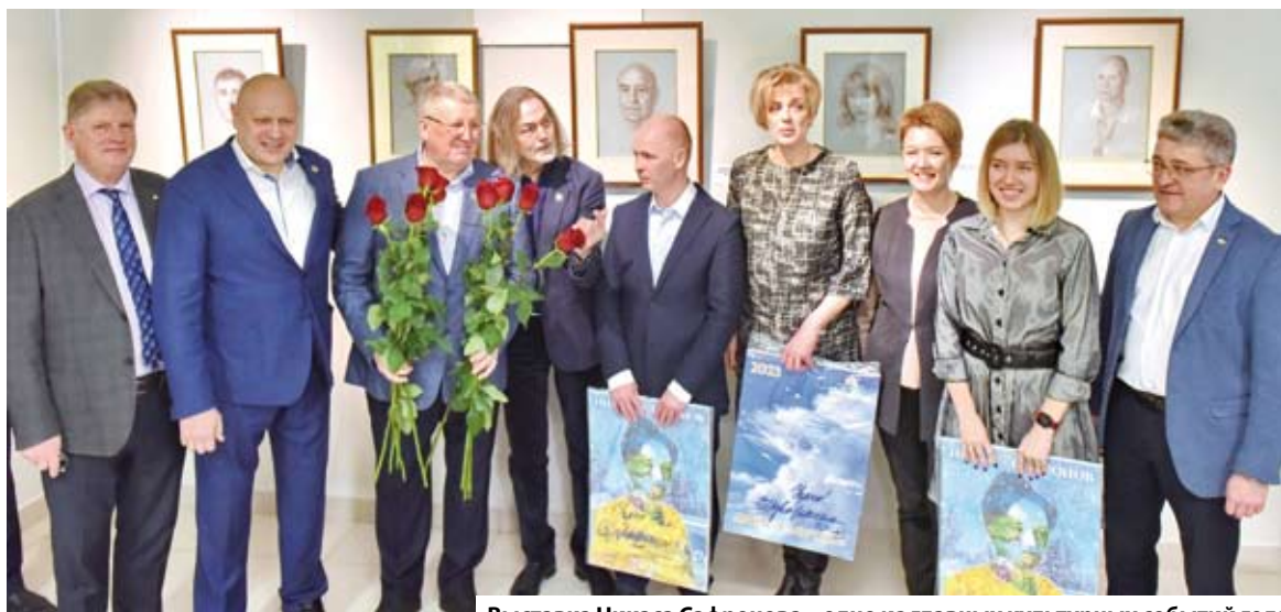
Выставка Никаса Сафронова – одно из главных культурных событий года