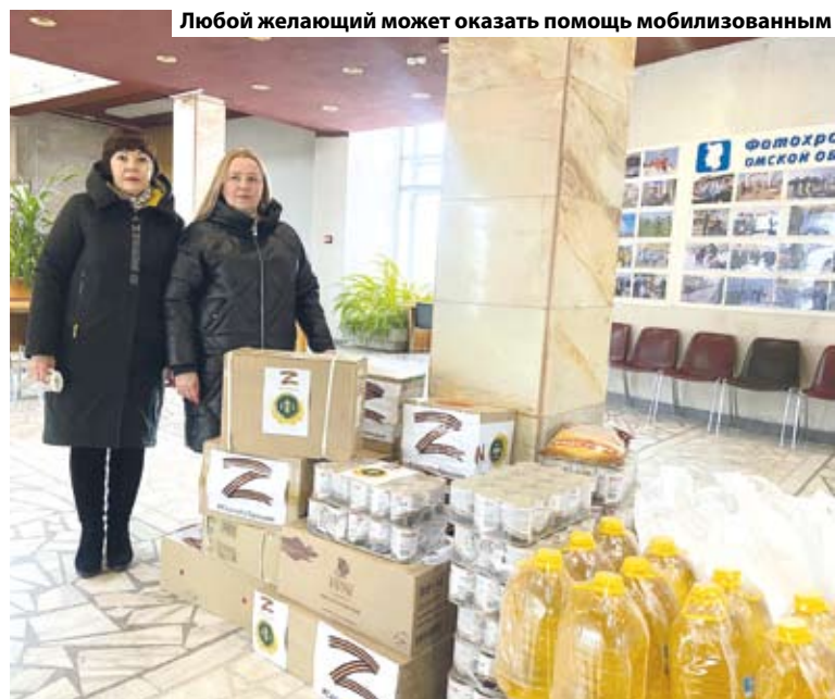
Любой желающий может оказать помощь мобилизованным

Присоединиться к акции может каждый желающий.