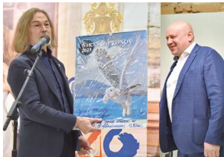
Сергей Шелест и легендарный художник