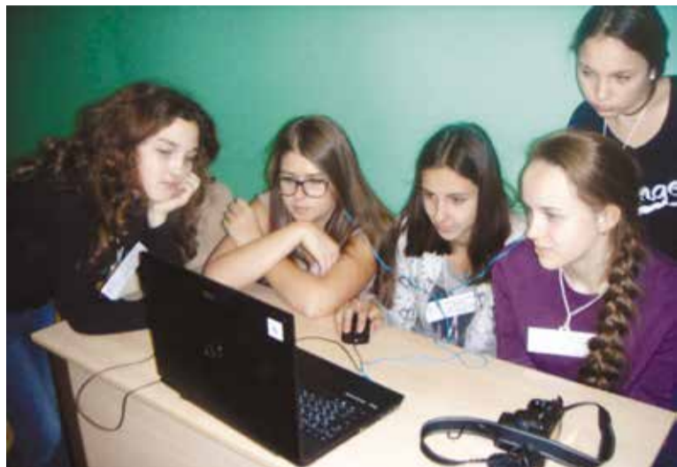
В течение дня ребята собирали материал, а потом монтировали его в фотопрезентацию или видеофильм

В микрорайоне «Входной» на территории средней общеобразовательной школы № 161 Ленинского округа состоялся фотокросс на тему: «Сегодня модно быть здоровым!».