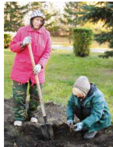
В сквере на площади Серова посадили пионы

Всего высажено 1200 деревьев ценных пород и декоративных кустарников.