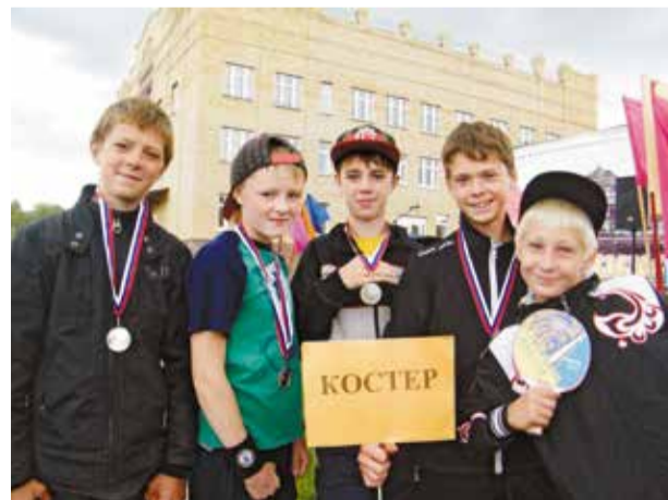
Ежегодно в округе растет число участников спартакиады «Спортивный город»