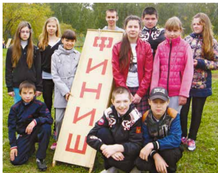
По мнению юных спортсменов, главное в соревнованиях не победа, а участие