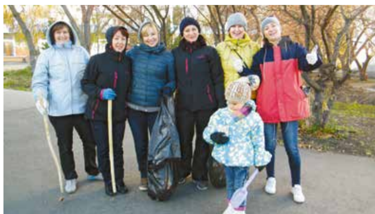
На субботник 10 октября вышли около 5 тысяч жителей Ленинского округа