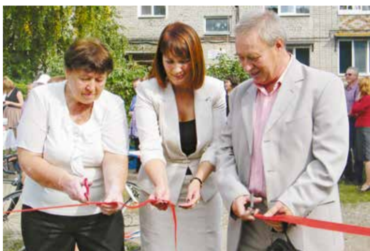
Благодаря конкурсу муниципальных грантов в округе ежегодно появляются новые спортивные площадки