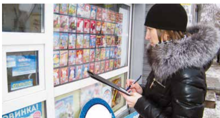
В округе 132 киоска установлены без правоустанавливающих документов