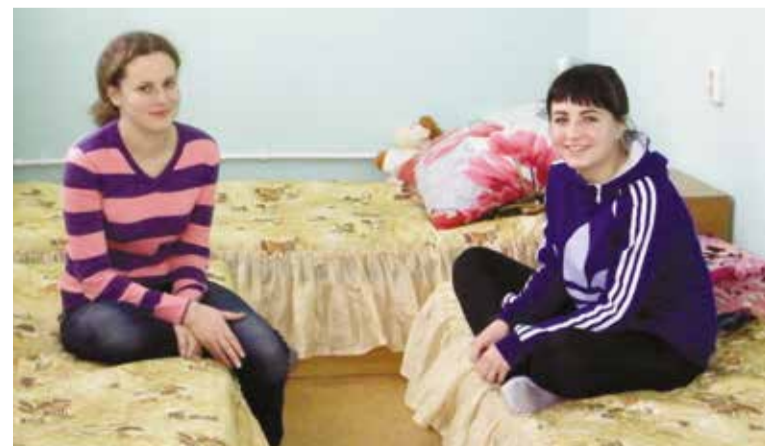
В конкурсе приняли участие 8 общежитий

Завершился традиционный смотр-конкурс на лучшее студенческое общежитие учреждений среднего и начального профессионального образования Ленинского округа. Проходил он с 23 сентября по 23 октября 2015 года.