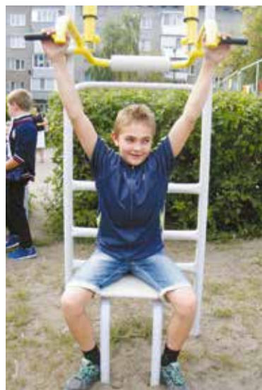
Дети счастливы, что в их дворе появились тренажеры

Теперь дети из близлежащих домов смогут не просто играть во дворе, но и заниматься спортом: в их распоряжение предоставлены три антивандалных тренажера