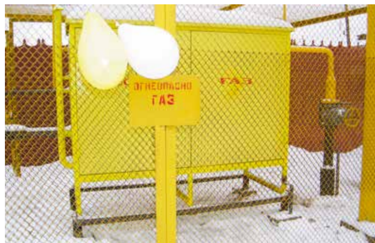
Сегодня газ поступил уже в 3 тысячи жилых домов округа

С вопросами газификации жители Ленинского округа могут обращаться в потребительские общества, организованные на территории микрорайонов, или администрацию Ленинского округа.