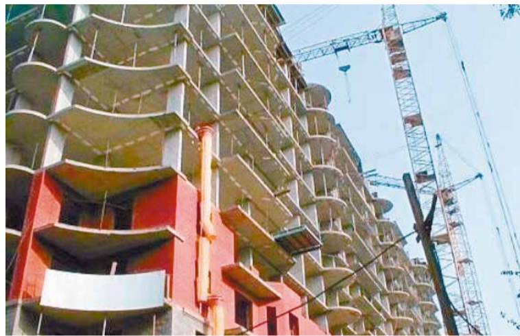
Каждый второй застройщик в округе нарушает Правила благоустройства

щадках ООО «Современные системы строительства», ООО «Сибмост-Стройпроект», ООО «ПСК «Заполястрой». Результат рейда — 15 административных протоколов и столько же уведомлений об устранении нарушений.