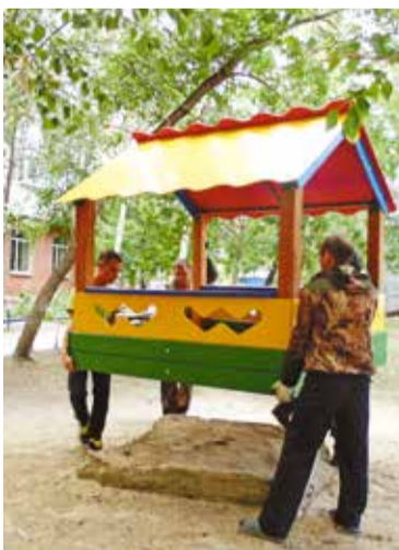
Обустройство детской площадки у дома № 3 по улице Кучерявенко

Также в рамках реализации общественно полезных проектов была произведена санитарная очистка территорий, прилегающих к озерам Соленое и Чередовое. А в сквере у ДК «Железнодорожник» появились лавки, урны и