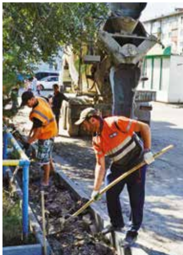
В рамках программы «Формирование комфортной городской среды» было отремонтировано 34 двора

Ранее для получения медицинской помощи жители 14-го Военного городка и поселка Новая Станица вы-