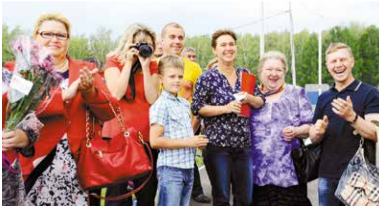
Счастливые новоселы на вручении ключей от квартир в новом доме по ул. Завертяева, 28 июля 2017 года