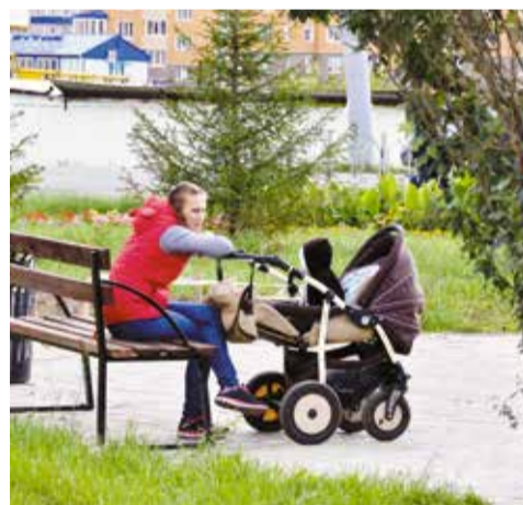
За пять лет на реализацию программы по формированию комфортной городской среды в Омске планируется направить свыше 800 млн рублей

С учетом многочисленных положительных отзывов об этой программе принято решение продлить ее действие на пять лет. За этот срок из бюджетных и внебюджетных источников на приведение в порядок дворов и общественных пространств ассиг-