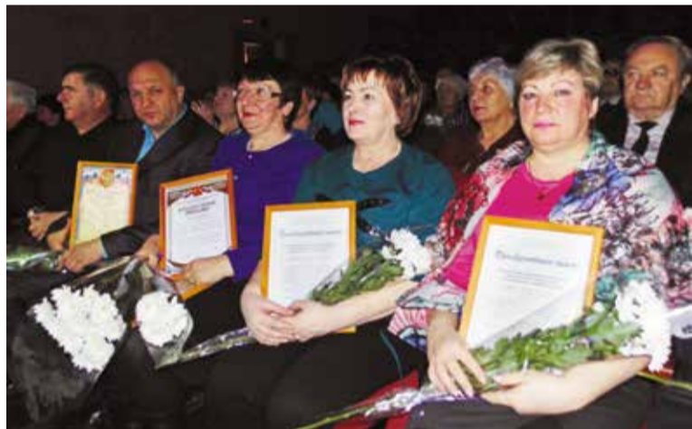
В честь юбилея активистам КТОСов были вручены благодарственные письма администрации Ленинского округа

В Городском дворце культуры и искусств имени Красной Гвардии состоялась праздничная программа «Живи и здравствуй, любимый город!», посвященная 25-летию территориального общественного самоуправления Омска.