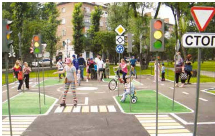
Благоустройство сквера у ДК «Железнодорожник»

Нельзя обойти вниманием и тему озеленения и комплексного благоустройства существующих и строительство новых зон отдыха.