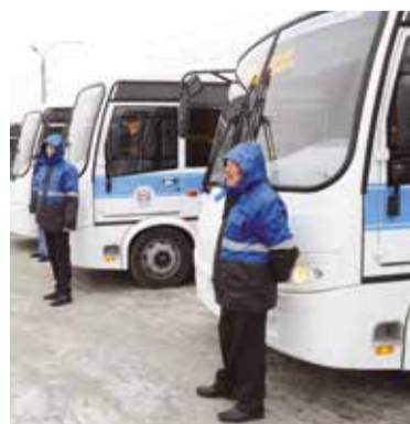
Ключи от новых автобусов вручили лучшим водителям предприятий № 7 и № 8