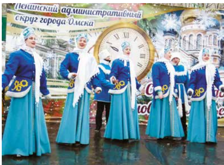
Основные праздничные мероприятия на территории микрорайонов пройдут в период с 23-го по 29 декабря

Наиболее массовыми станут праздники микрорайонов и дворовые елки.