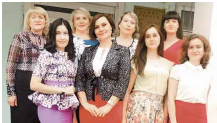
В настоящее время штат Ленинского отдела управления ЗАГС состоит из восьми специалистов

Расторжение брака в начале и середине прошлого века не приветствовалось ни обществом, ни государством,