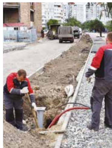
Удобные тротуары появились даже там, где их никогда не было

В 2017 году в Омске на ремонт тротуаров, пешеходных дорожек, внутри- и межквартальных проездов было направлено 100 млн рублей. Это самая большая сумма, выделенная на эти цели из