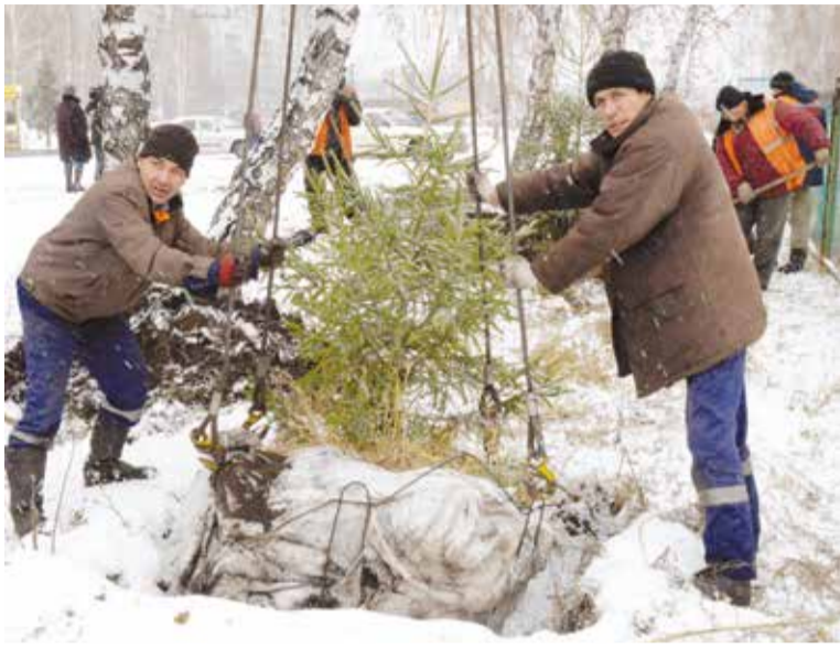
Посадка крупномерных деревьев в сквере в микрорайоне «Московка-2»

Главная особенность всех этих проектов – активное участие в работах неравнодушных жителей. Этот омский опыт – на примере КТОСа «Кировец-3», который инициировал обновление сквера Героев-авиаторов, – получил высокую оценку на заседании Совета по развитию местного самоуправления, которое прошло в Кирове под председательством президента России Владимира Путина.