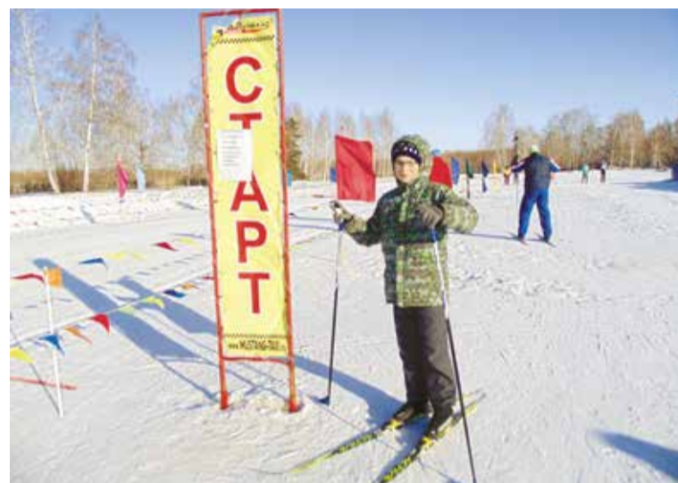
Для жителей округа организованы более 20 мест для катания на коньках и три лыжные трассы

А для любителей катания на тюбингах и ледянках построено шесть снежных горок: в скверах по улице Серова,