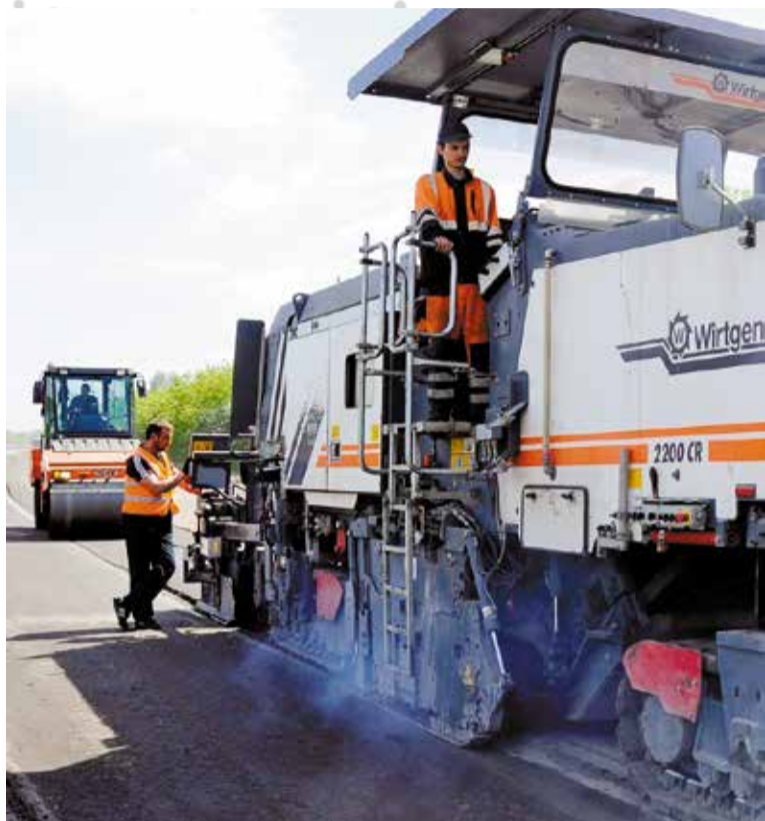
В 2017 году на ремонт дорог в Омске было направлено около 1 млрд. рублей

В преддверии Нового года традиционно подводим итоги работы администрации Омска по основным направлениям деятельности и говорим о перспективах наступающего 2018 года.