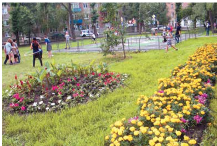
Благоустройство сквера у ДК «Железнодорожник» в этом году будет продолжено

В частности, в этом году работы по благоустройству и озеленению будут выполняться в 10-м микрорайоне (2-я очередь) и сквере Авиаторов в Кировском округе; сквере микрорайона «Загородный» в Центральном округе; на территории по улице Эн-