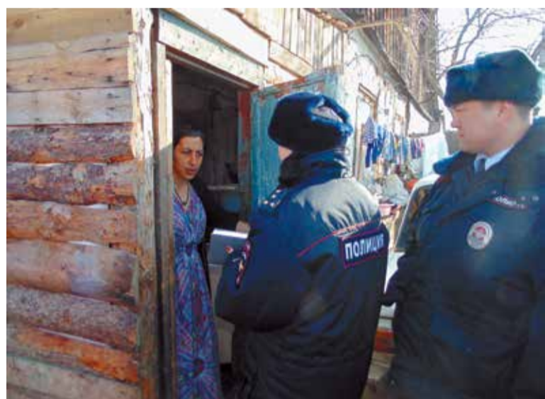
В 2016 году проведено 330 рейдов, проверено 236 семей, находящихся в социально опасном положении

Благодаря пристальному вниманию к семьям, в которых воспитываются дети, находящиеся в сложной жизненной ситуации, в 2016 году удалось сохранить тенденцию снижения подростковой преступности.