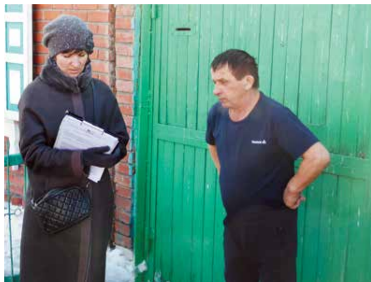
Рейды по частному сектору проводятся специалистами отдела контроля регулярно