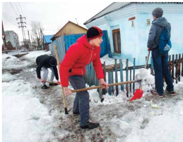
Помощь ветеранам стала доброй традицией волонтеров

«22 апреля в Омске пройдет традиционный общегородской субботник. Ожидается, что в нем примут участие не менее 50 000 омичей. После зимы в порядке будут приводиться скверы и парки, дворы, прилегающие и бесхозные территории в микрорайонах, дороги, — сообщил первый заместитель мэра, директор департамента городского хозяйства администрации Омска Сергей Фролов. — Приглашаю всех горожан на генеральную уборку. Омск — наш общий дом. Давайте вместе сделаем наш любимый город еще краше, чище, благоустроеннее».