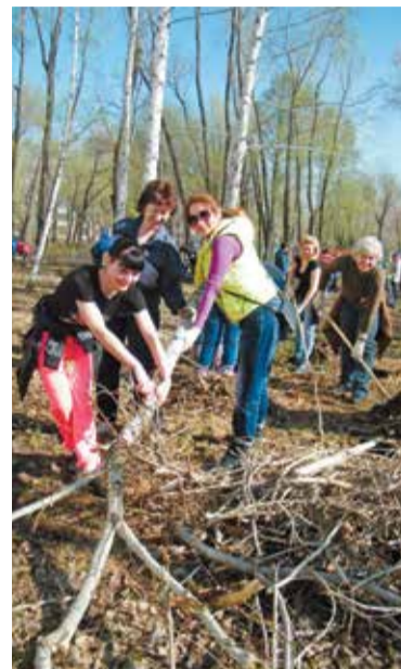
Общегородской субботник состоится 22 апреля