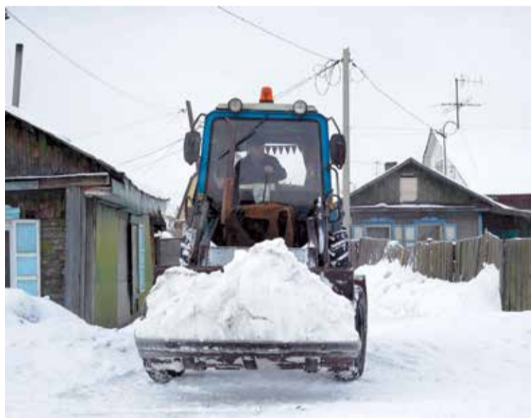
В первую очередь снег вывозится с мест возможного подтопления домов