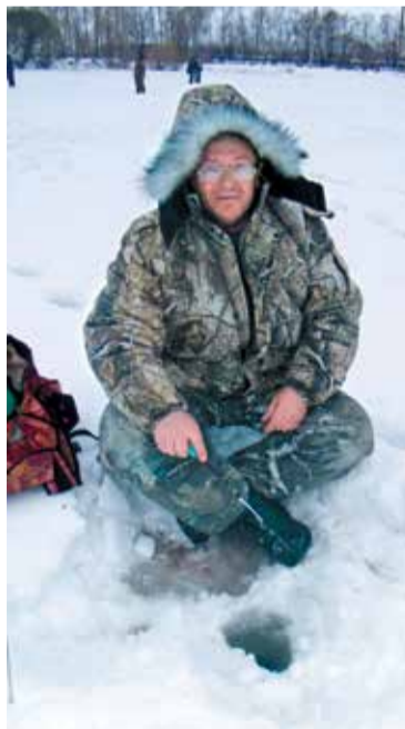
Весенний лед опасен

Спасатели настоятельно рекомендуют омичам соблюдать меры предосторожности и не выходить на весенний лед рек и озер. Любителям лыжных прогулок и зимней рыбалки специалисты советуют воздержаться от выхода на водоемы до следующей зимы.