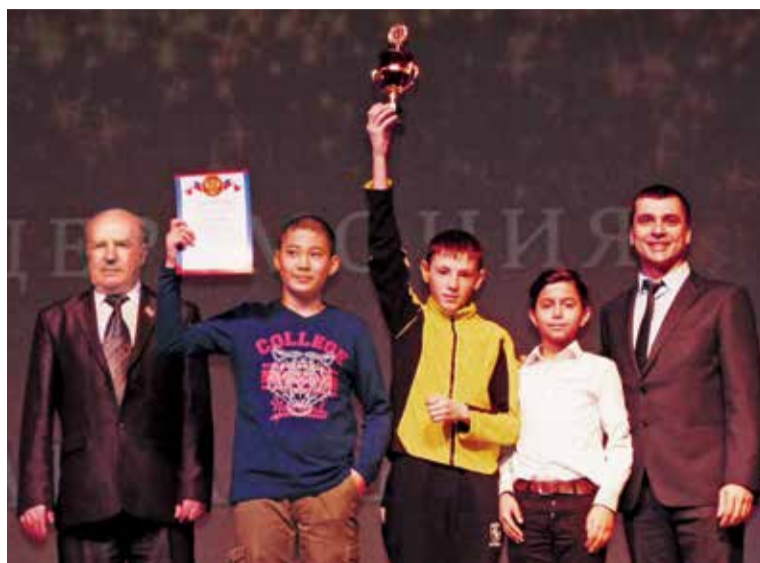
Воспитанники адаптивных школ № 12, 16, 17, 18 несколько раз поднимались на сцену для награждения

«Участие в соревнованиях – это возможность преодолеть себя, улучшить свое здоровье, проверить возможности, почувствовать себя сплоченной командой, получить заряд бодрости и отличного настроения, объединить семью и оценить радость победы, – поделился