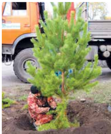
На озеленение города будет выделено около 129 миллионов рублей

«Основные мероприятия по благоустройству и озеленению территории Омска в 2017 году направлены на