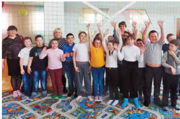
Ежемесячно дети имеют возможность весело провести время в команде с аниматором

В детском комплексе «Космик» Ленинского округа прошла благотворительная акция для детей с ограниченными возможностями здоровья «Подари улыбку детям».