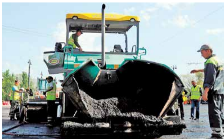
В 2017 году будет отремонтировано около 900 000 квадратных метров автомагистралей

– Подрядчики будут определены по результатам проведения конкурсных процедур. К ремонту городских магистралей приступим уже в мае. По опыту прошлого года будет организована многоступенчатая система контроля за качеством работ с привлечением ученых, общественников, средств массовой информации. За короткий срок предстоит выполнить большой объем ремонтных работ, завершить их планируем уже к концу сентября.