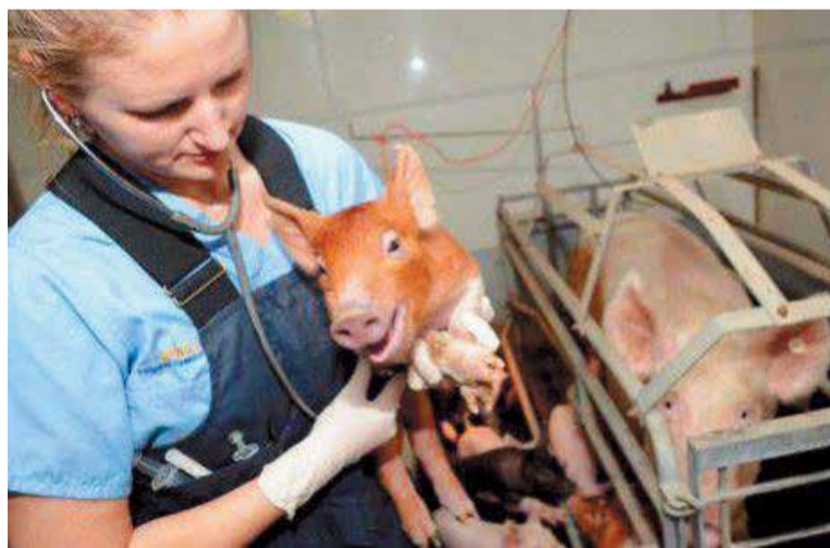
Профилактическая вакцинация животных помогает предотвратить заражение опасными болезнями

Мероприятие проводится окружной администрацией совместно с детским развлекательным комплексом «Космик».