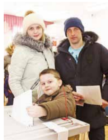
Избирательные участки 9 сентября будут открыты с 8:00 до 20:00

9 сентября у омичей есть отличная возможность выбрать дальнейший путь развития нашей области. Я призываю всех жителей Ленинского округа проявить гражданскую активность, прийти на выборы и проголосовать за будущее нашего родного края».