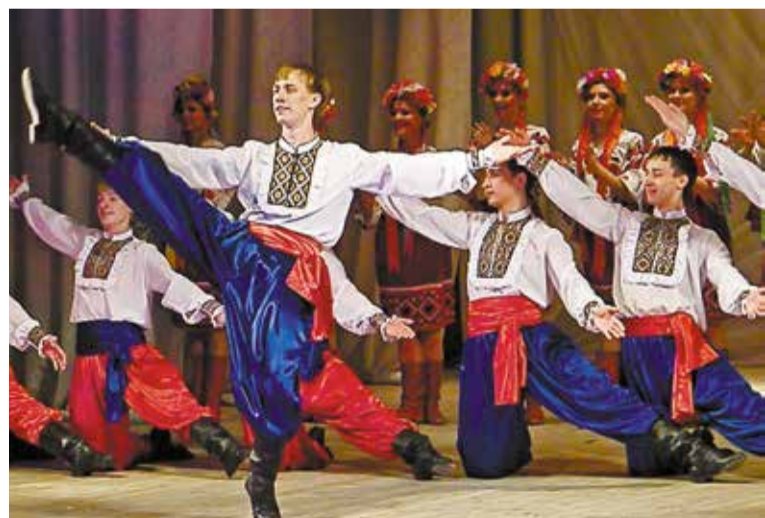
Продолжается прием детей и подростков в секции дополнительного образования

Совместный проект администрации Омска «После уроков» – это большой сайт дополнительного образования: здесь собрано более 2 200 кружков, секций и курсов города.