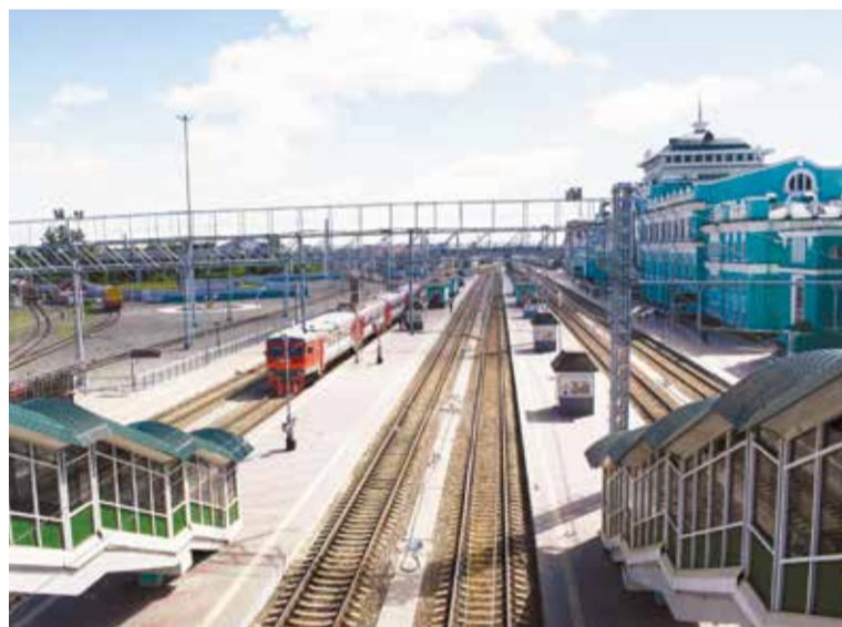
Перспективы региона тесно связаны с развитием социального партнерства