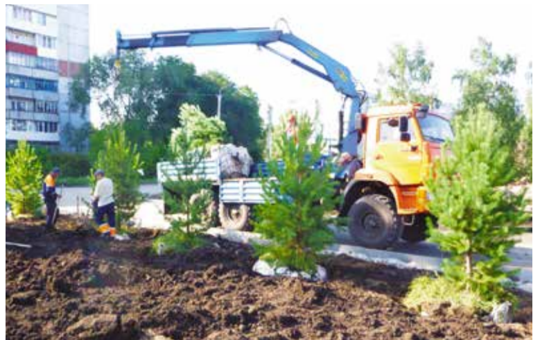
В парке высажено 120 крупномерных деревьев

В этом году в рамках программы «Формирование комфортной городской среды» в Ленинском округе будут проведены работы по благоустройству 12 дворовых территорий на общую сумму 33 млн. рублей. На эти деньги во дворах не только уложат новый асфальт, но и установят детские игровые площадки, лавочки, скамейки, урны и фонари.