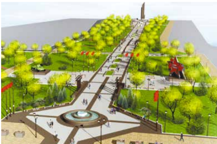
Дизайн-проект бульвара Победы – работы планируется выполнить в 2018 и 2019 годах

ния. Например, по предложенному архитекторами про-