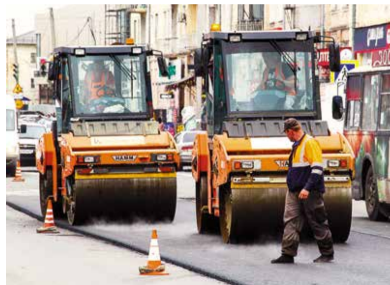
Новые технологии ремонта дорог будут использоваться на территории всей Омской области

практически никто в стране раньше не применял. По мнению члена Общественной палаты России Андрея Максимова, такой подход заслуживает внимания, уважения и похвалы.