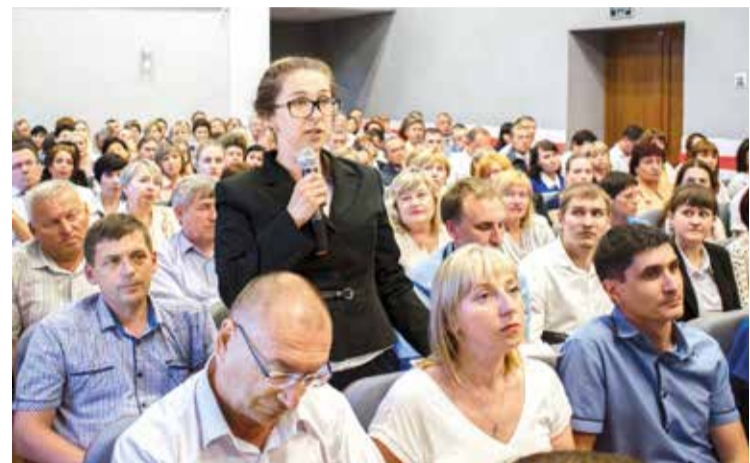
Программа развития нашего региона на шесть лет вперед будет разрабатываться с учетом мнения жителей

В связи с проработкой программы социально-экономического развития Омской области и города Омска до 2024 года глава региона Александр Бурков поставил задачу областному правительству по каждому из городских округов разработать предметные предложения по повышению качества жизни населения. Отправной точкой для этого стали многочисленные встречи руководителя с жителями.