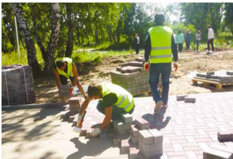
На аллеях парка выложили тротуарную плитку

Хочу поблагодарить жителей микрорайона, специалистов окружного участка Управления дорожного хозяйства и благоустройства Омска, предприятия и организации, которые приняли активное участие в преобразении этой территории».