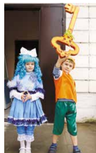
1 сентября для учеников свои двери распахнули 30 школ Ленинского округа

учреждений будет направлено 6,8 миллиона рублей. В 36 образовательных учреждениях Омска будут отремон-