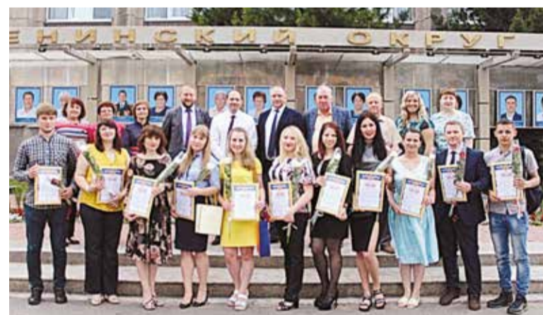
Заслуги лидеров молодежи отметили на муниципальном уровне

В честь Дня российской молодежи в администрации Ленинского округа состоялся торжественный прием лидеров молодежного движения.