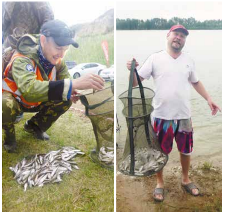
Самый большой улов за четыре часа – 260 рыбок