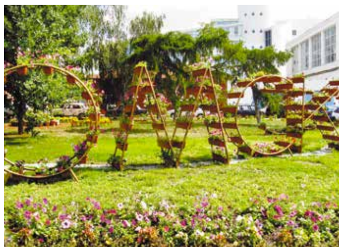
«Флора» станет украшением Омска ко Дню города