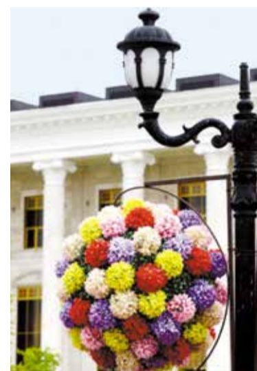
В сквере на улице Серова появятся светодиодные цветочные шары

Внутри каждого шара установят светодиодные лампы, что позволит использовать конструкцию не только в светлое время суток, но и ночью.