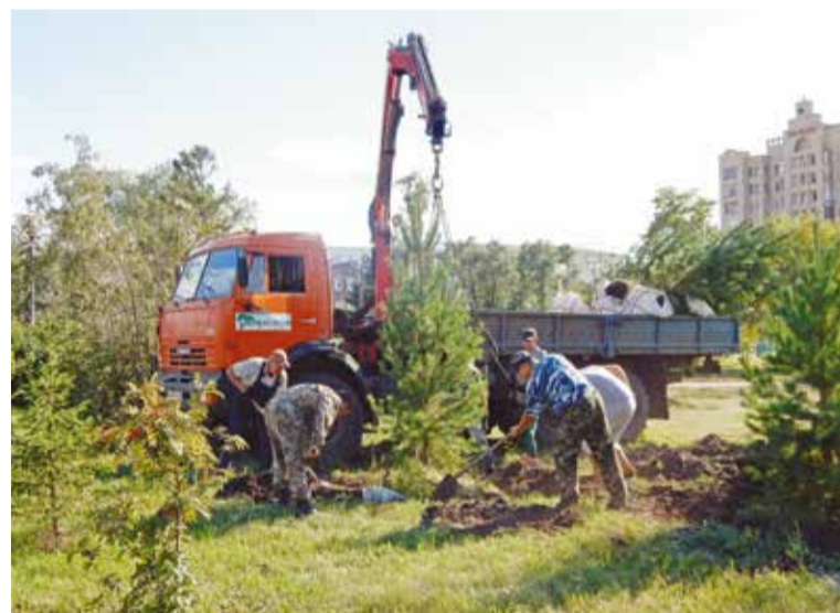
Зеленый наряд Омска сейчас все больше представляют ценные породы: ель, сосна, лиственница, дуб, тополь пирамидальный, клен канадский, ива шаровидная, сирень, яблоня и др.

По словам мэра города, для Омска главный вызов сегодняшнего времени – при-