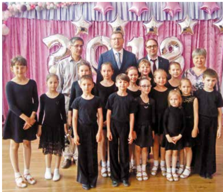
Руководители региона и округа с учениками школы № 99