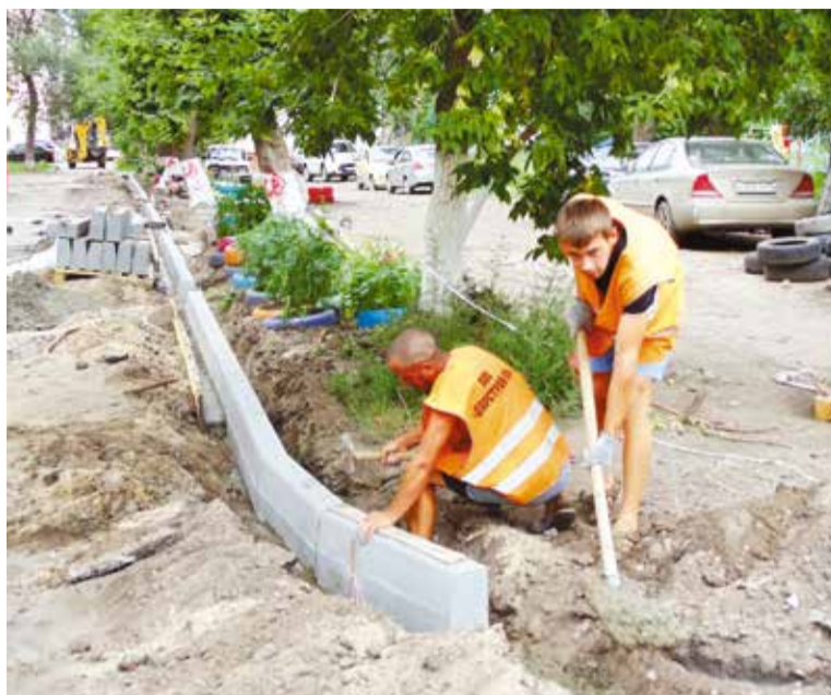
На благоустройство дворов округа потратят более 33 млн рублей