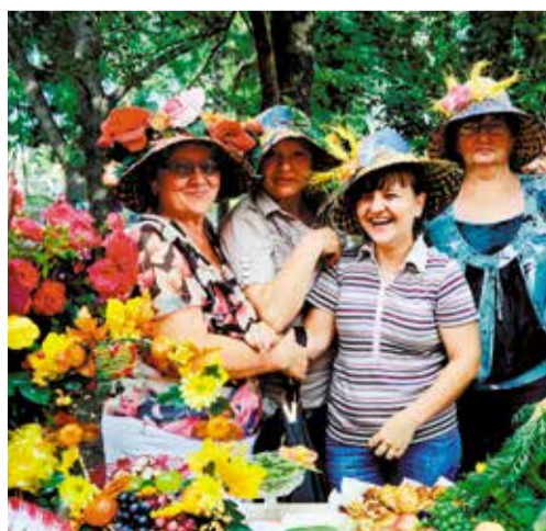
В дни проведения «Флоры» в округе будет работать выставка «Цветущий сад»