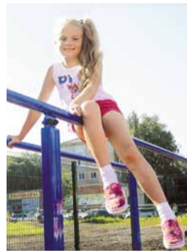
В этом году в конкурсе грантов поддержано пять проектов