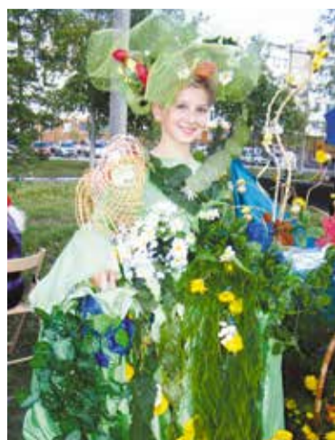
Стать участником праздника может каждый

ко», «ОТП Банк» и другие. В этом году впервые к проекту присоединились «Kerama Marazzi» и мастерская стекла и зеркала «Сатурн».