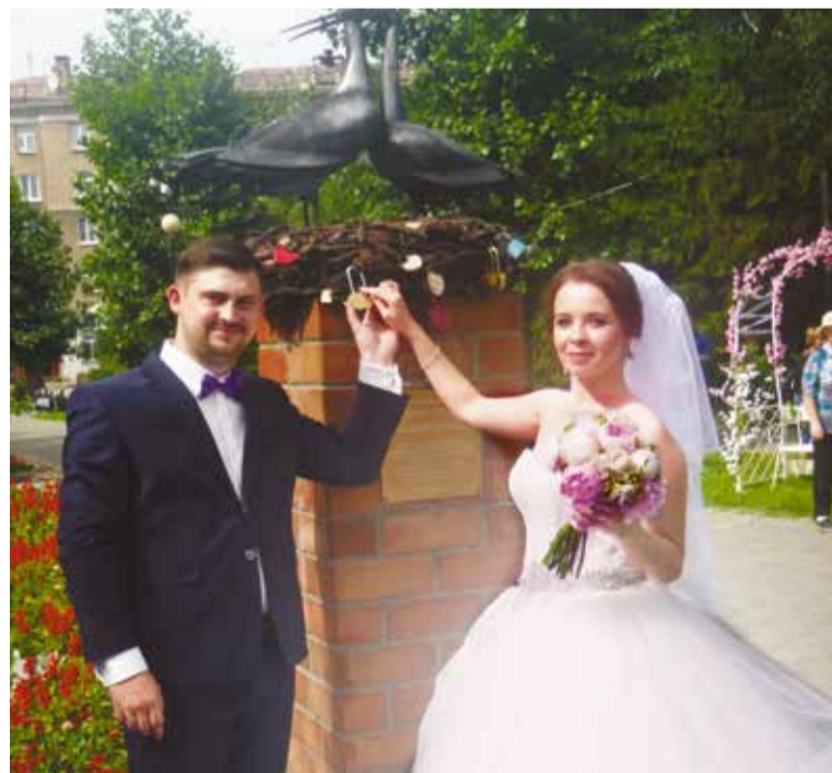
Молодожены прикрепили замок к скульптуре «Рождение счастья» на долгую и счастливую жизнь

Праздник проходил при поддержке Ленинского отдела управления ЗАГС Главного государственного управления Омской области.