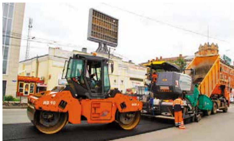
Проспект Карла Маркса – один из ключевых объектов программы ремонта дорог в этом году

«В этом году в нашем городе выполняется большой объем работ по благоустройству. Мы видим, что активно ремонтируются дороги, асфальтируются межквартальные проезды, дворовые территории. Никогда раньше город так не обновлялся. Надеемся, что работы будут продолжены и на следующий год».