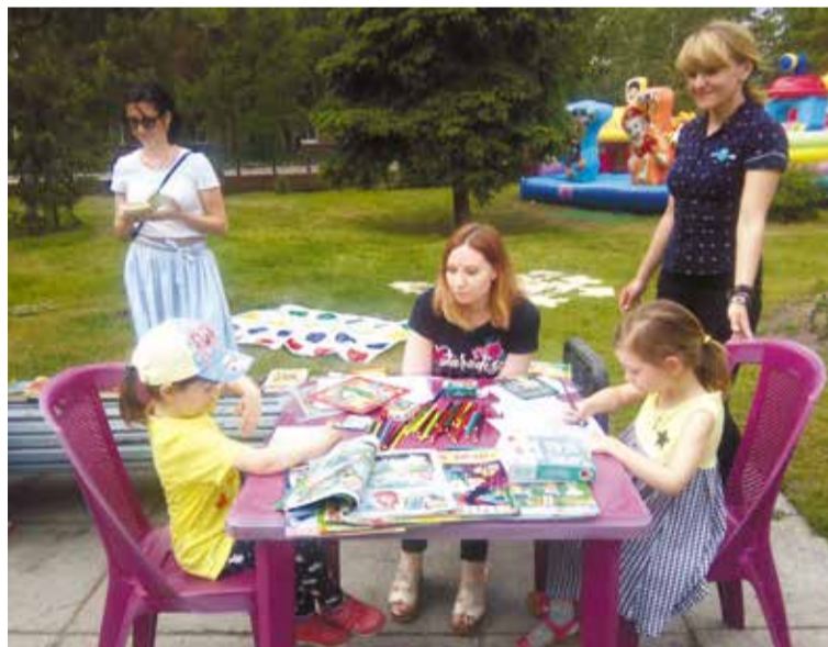
Накануне Дня города 2 августа в 16.00 в сквере на улице Серова состоится праздничная программа