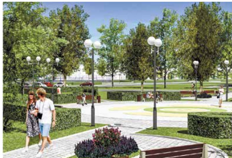
За благоустройство парка проголосовало 49 566 омичей

«При строительстве парка максимально будут сохранены зеленые насаждения, а также дополнительно высажены молодые деревья и кустарники, – отметил глава администрации Ленинского округа Дмитрий Зярко, – также мы постараемся обеспечить досуг разных возрастных групп, для этого в парке будут построены площадки различного функционального назначения».