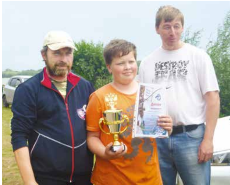
Семья Заремба – победитель в номинации «Мама, папа, я – рыболовная семья»

Подведены итоги XI фестиваля по ловле рыбы «Ерш-2018», который проходил 7 июля на берегу Черского. В четвертый раз его победителем стала команда «Дрим тим 55».