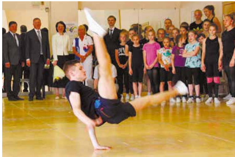
Развитие спорта является приоритетным направлением работы в области и городе