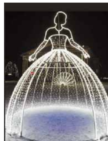
Высота «Принцессы» – 4,5 метра

В Ленинском округе в главных местах празднования и отдыха жителей совсем скоро установят оригинальные световые конструкции «Принцесса», «Карета» и «Фонтан».