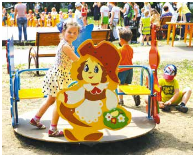
Благодаря муниципальным грантам в округе благоустроено 6 площадок

✓ Проведена работа по благоустройству спортивной площадки во дворе многоквартирных жилых домов по ул. Маргелова, 390, 391,