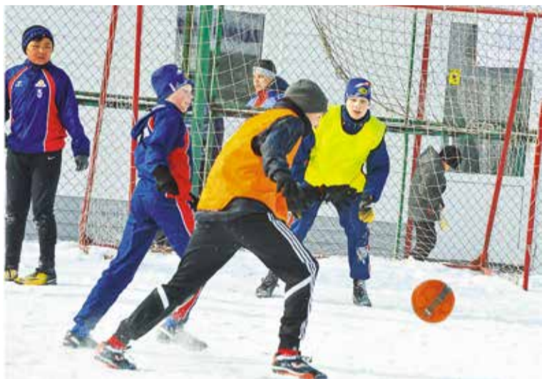
Ежегодно в соревнованиях принимают участие около 600 подростков

«Турнир стал традиционным праздником спорта, молодости и здоровья. Все эти годы его девизом остается слоган «Спорт против наркотиков», – подчеркнула начальник отдела по делам