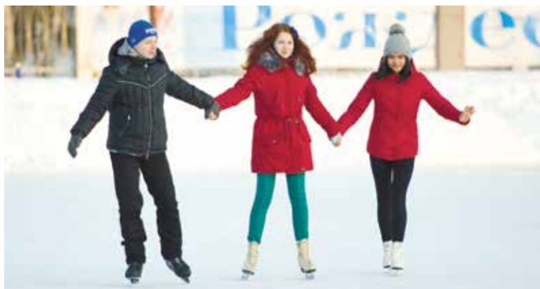
В округе готовы 20 хоккейных площадок и 3 лыжные трассы