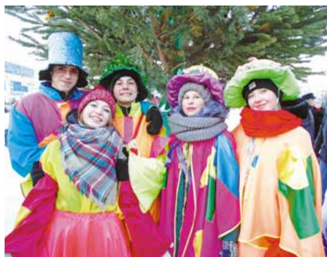
Главная окружная елка округа состоится 26 декабря в 16:00 на площади Праздников (ул. Гашека, 5/2)