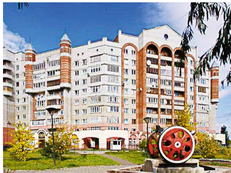
При благоустройстве сквера «Юбилейный» планируется выполнить работы по освещению территории

В Ленинском округе прошли общественные обсуждения благоустройства в 2020 году по национальному проекту «Формирование комфортной городской среды» территории сквера «Юбилейный» по улице Труда.