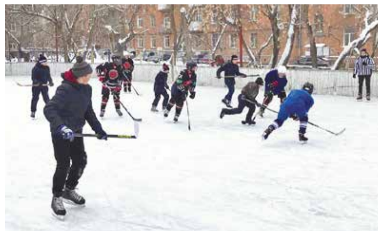
Турнир пройдет в период с 10 по 12 января 2020 года