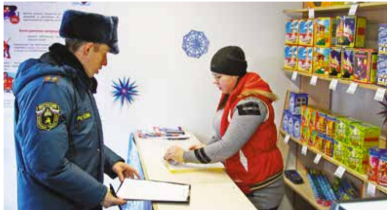
Рейды по местам продажи пиротехники проводятся регулярно

Специалисты отдела общественной безопасности администрации Ленинского округа напоминают омичам о необходимости соблюдения мер пожарной безопасности в период проведения новогодних праздников.