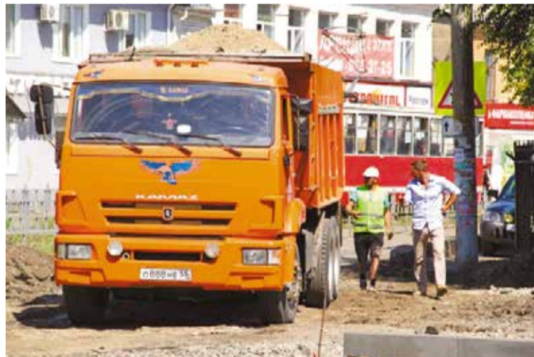
Работы по благоустройству территории у школы № 162 идут полным ходом