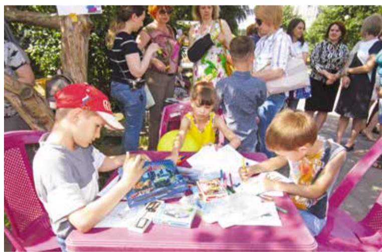
Родителей с детьми ждут в сквере по улице Серова каждый четверг с 15:30 до 17:45.