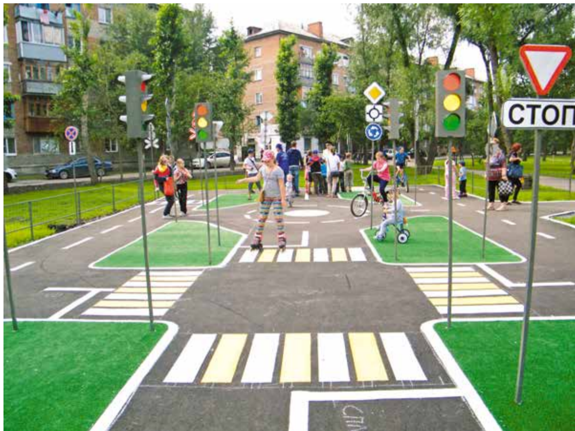
На территории КТОСа «Южный» появится тренировочно-игровая площадка для изучения правил дорожного движения

лением и организационным вопросам администрации Ленинского округа Светлана Залеская.