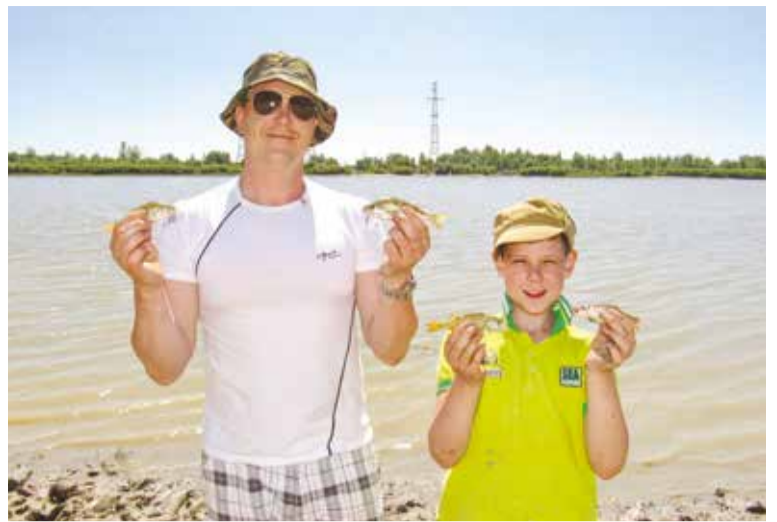
У каждого свой улов