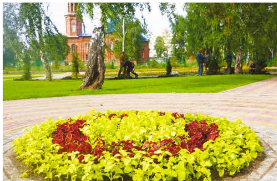
Парк семейного отдыха ждет вторая очередь благоустройства

Работы по благоустройству парка семейного отдыха на «Московке-2» уже начались. В этом году запланировано выполнение второй очереди строительства парка.