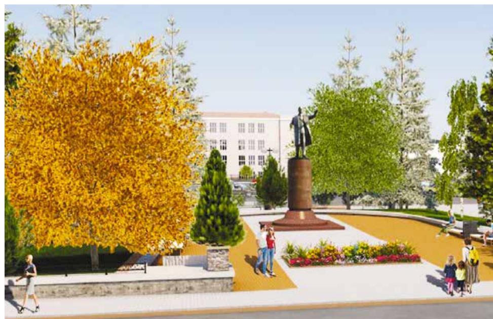
На Привокзальной площади проведут работы по озеленению