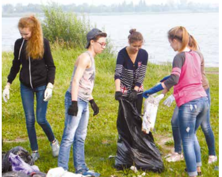
В летний период акцию поддерживают старшеклассники в рамках социального проекта «Лето»

дано природой и поддерживается другими горожанами».