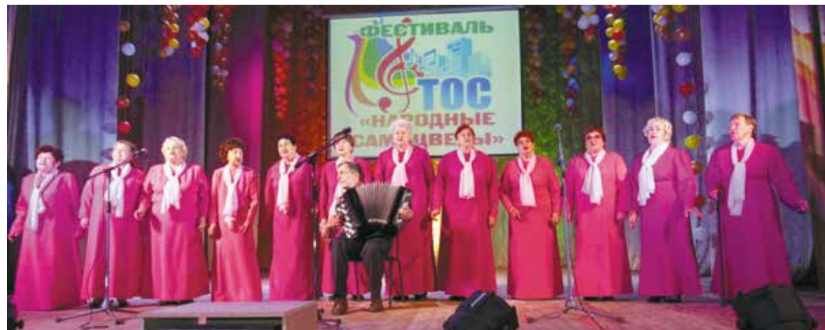
Хоровой коллектив «Нежинка» – неизменный участник песенных фестивалей

По результатам первого этапа фестиваля жюри определило лауреатов в каждой заявленной номинации, а также присудило специальные призы за авторство и исполнение песен, посвященных городу Омску, за мастерство и творческий поиск и за преданность песне. Однако пока список победителей организаторы держат в секрете.