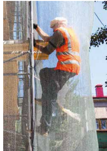
Ремонт фасада дома по пр К. Маркса, 81, в самом разгаре