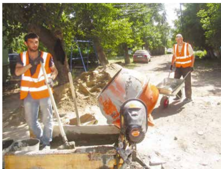
Все детали предстоящего благоустройства согласовываются с жителями