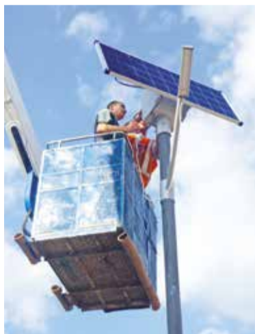
В парке на «Московке-2» обустраивают наружное освещение

С 15 июля начались работы по благоустройству участка по улицам Марченко и Серова у средней общеобразовательной школы № 162. Ранее с этой территории вывезли киоски, демонтировали старые покрытия и основания. В настоящее время ведутся работы по укладке тротуарной плитки.