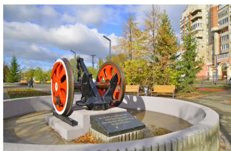
Декоративное сооружение «Колеса с якорем» символизирует железнодорожный и речной транспорт

«Конечно, основанный еще в 1999 году сквер «Юбилейный»