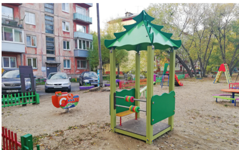
На средства муниципального гранта для детей оборудовали современную игровую площадку

Подробнее познакомиться с проектами и инициативами общественников можно на официальном сайте «КТОСы Омска»: http://ktosomsk.ru .