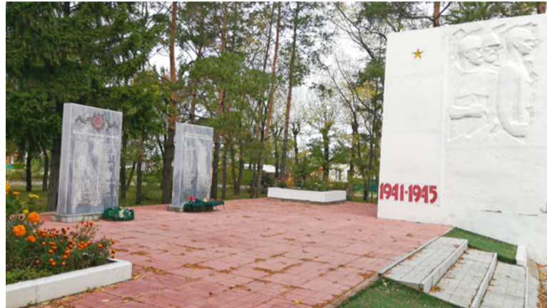
Реконструкция мемориального комплекса выполнена на средства муниципального гранта

В микрорайоне Черемуховское Ленинского округа завершилась реконструкция мемориального комплекса «Воинам-омичам, погибшим в годы Великой Отечественной войны».