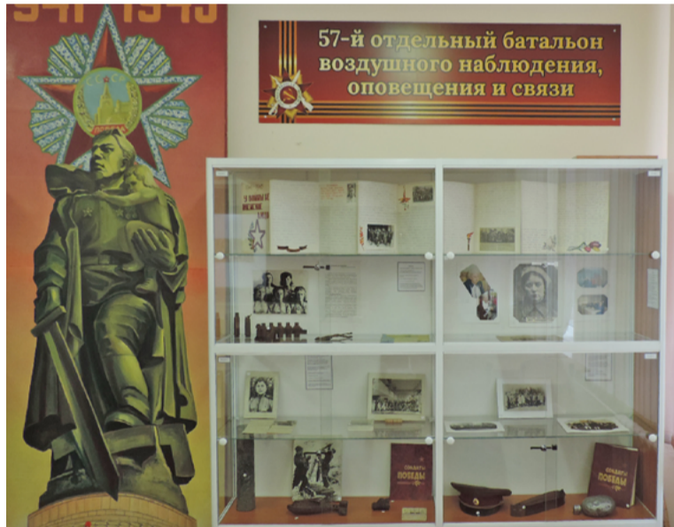
Обновленная экспозиция школьного музея

Музейная комната после открытия продолжит работу на постоянной основе. Здесь планируется проведение мероприятий, направленных на патриотическое воспитание подрастающего поколения.