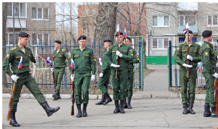
Осенний призыв традиционно проходит с 1 октября по 31 декабря

Всего в образовательных учреждениях Омска 79 музеев и музейных комнат. На территории 33 образовательных учреждений расположено 40 мемориальных знаков, связанных с Великой Отечественной войной.