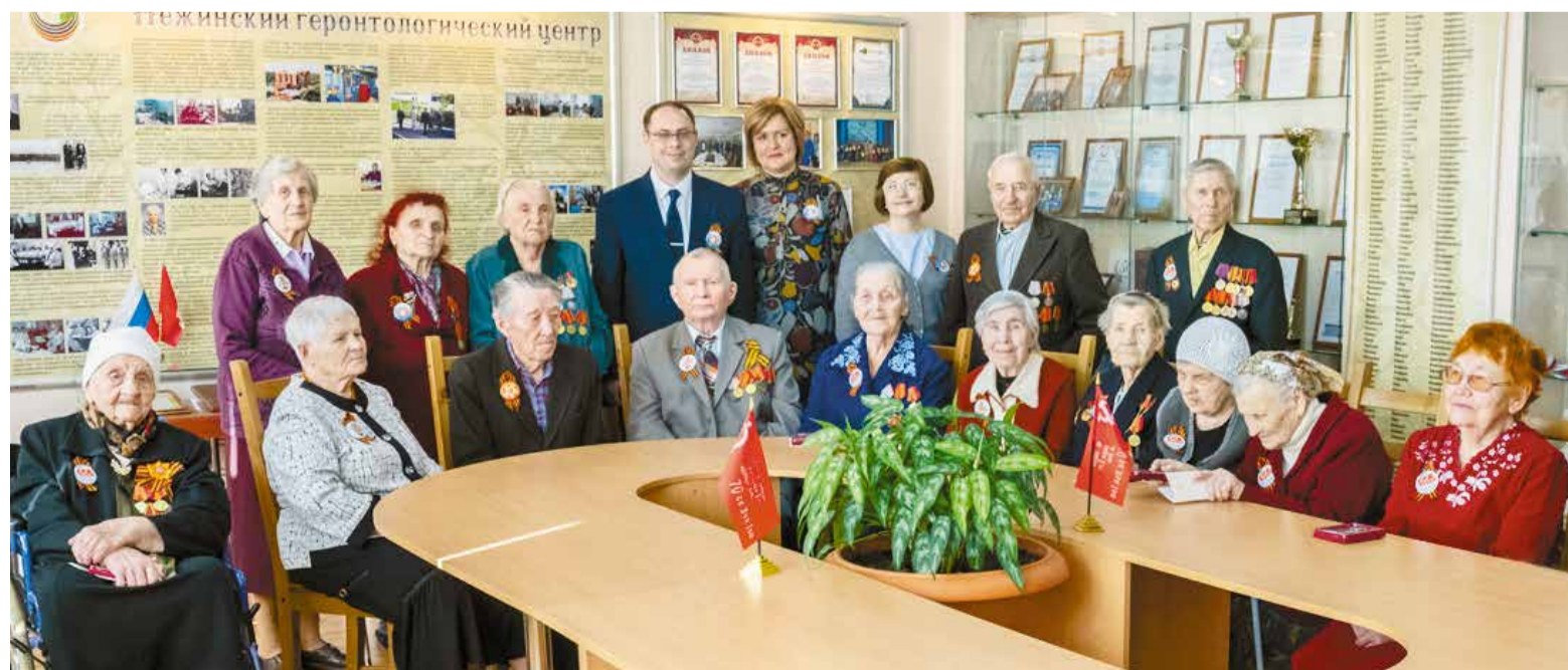
Награды вручили 29 ветеранам, проживающим в Нежинском геронтологическом центре

После утверждения полная программа праздника с датами, временем и локациями будет размещена на сайте мэрии – omsk.rf .