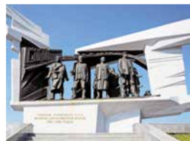
Омск – город трудовой славы

Как прозвучало, в ходе подготовки и непосредственно в сам День Победы в Омске будет организовано 117 ярких культурных мероприятий. Активными участниками программ и проектов станут творческие объединения ветеранов. Уже начато изготовление сценических костюмов для четырех хоровых коллективов, которые примут участие в гала-концерте «Поющая Сибирь» 9 Мая.