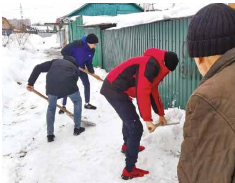
Волонтеры отряда «Добрые сердца» помогают ветеранам в уборке снега

«Акция «Паводок» организуется на территории округа не первый год, и со многими ветеранами у ребят сложились теплые, доверительные, близкие отношения, школьники и студенты с удовольствием помогают ветеранам», –