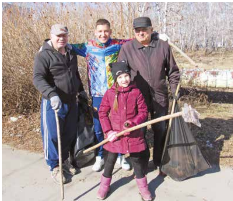
Часть работ по благоустройству мемориальных объектов планируется выполнить в рамках акции «Память»

В первую очередь намерено привести в порядок улицы, носящие имена героев Великой Отечественной войны, территории, прилегающие к мемориальным объектам, места проведения праздничных мероприятий, скверы, парки, пешеходные зоны.