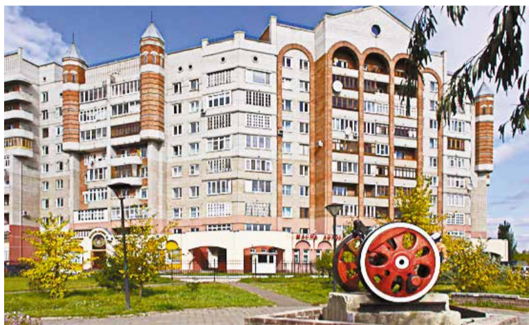
Сквер «Юбилейный» был основан в 1999 году к 100-летию Ленинского округа

в котором приняли участие больше 14 тысяч человек, в Ленинском округе наибольшее количество голосов получила территория у сквера «Юбилейный».