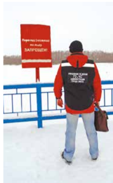
Специалисты напоминают: выходить на лед весной опасно

мониторят общую ситуацию, при необходимости проводят разъяснительные беседы с жителями, напоминают им о необходимости соблюдения норм поведения и мер предосторожности.