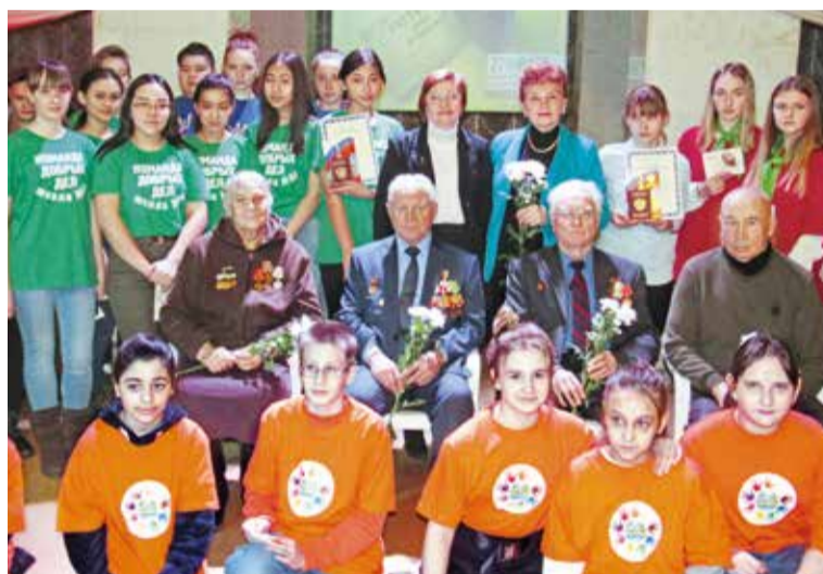
Традиционная «Встреча трех поколений», посвященная 76-й годовщине снятия блокады Ленинграда

памяти о россиянах, исполнивших служебный долг за пределами Отечества. Состоялись митинги и возложение цветов в память о воинах-интернационалистах. В мероприятии приняли участие ветераны военной службы, родители и вдовы погибших бойцов, представители общественной ветеранской организации «Боевое братство», окружного волонтерского сервисного движения «Агентство добрых дел», а также военнослужащие срочной службы.