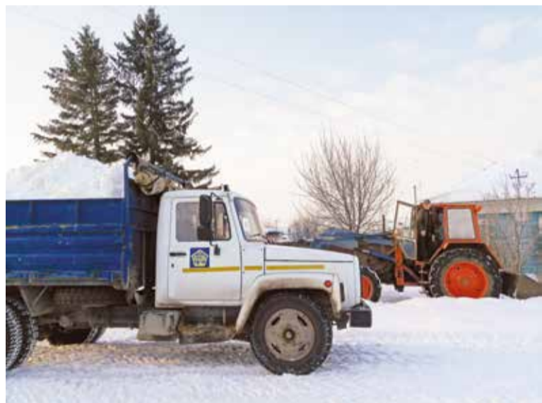
Вывоз снега с улицы Фестивальной

В администрации Ленинского округа подготовлено 470 талонов на вывоз снега объемом от 3 до 10 кубических метров. Талоны действуют при предъявлении на снежном полигоне, расположенном по Черлакскому тракту.