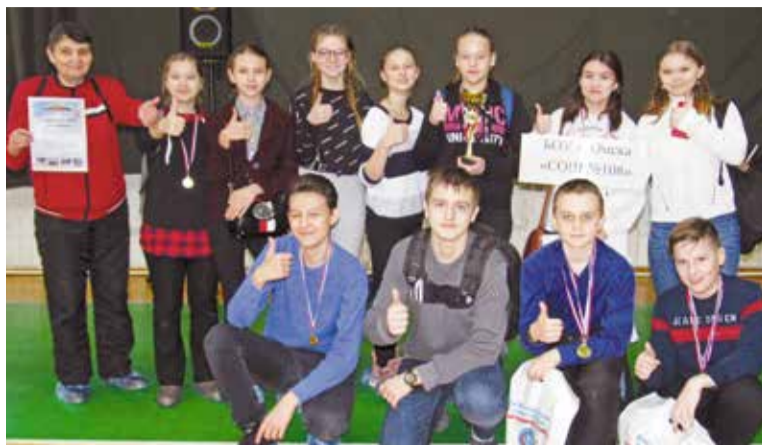
Команда школы № 108 – победитель соревнований по лыжным гонкам

Соревнования проходили в период с 1 по 15 февраля. За это время жители округа продемонстрировали свои спортивные достижения в лыжных гонках, беге на коньках, перетягивании каната, настольном теннисе, шахматах, хоккее и мини-футболе. Как всегда, родители с детьми приняли участие в