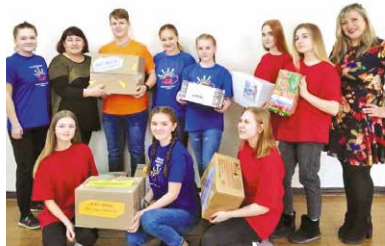
В этом году школьники намерены собрать не меньше 50 посылок и писем

Заключительный этап акции пройдет с 21 по 25 февраля. Подростки побывают в Омском автобронетанковом инженерном институте и в железнодорожных войсках.