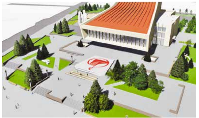
Эскизное решение благоустройства Театральной площади

На градсовете в процессе обсуждения эскизов ведущие омские архитекторы внесли ряд предложений по корректировке первоначальных дизайн-проектов.