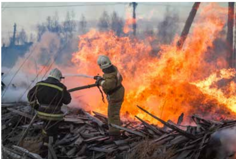
В нашем регионе резко возросло число природных и техногенных пожаров.

В случае пожара необходимо немедленно звонить в пожарную охрану и службу спасения МЧС по телефону 101. Единый номер вызова экстренных оперативных служб – 112.