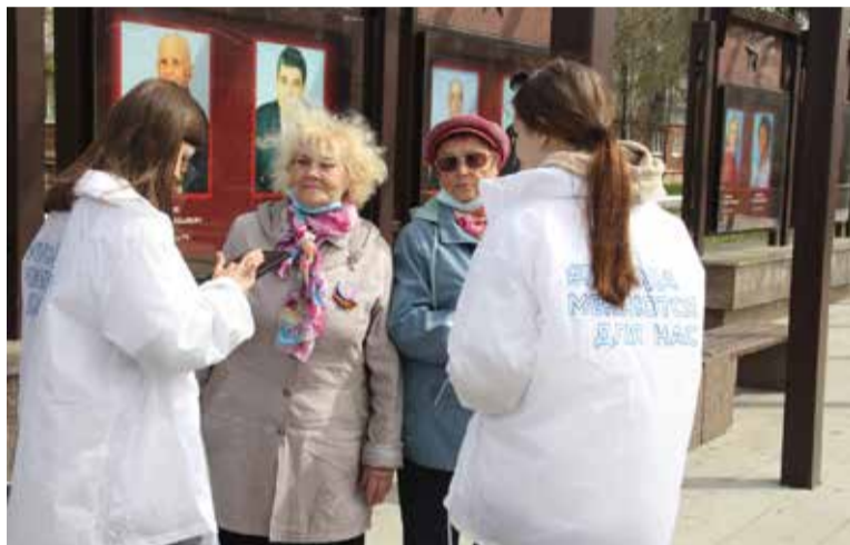
Волонтеры, работающие на информационных точках, помогают омичам проголосовать за понравившийся дизайн-проект

9. После регистрации по номеру телефона или через Госу-