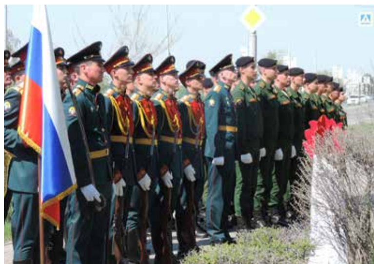
Акция «Парад у дома ветерана» стала ежегодной, участие в ней принимают как творческие коллективы так и курсанты