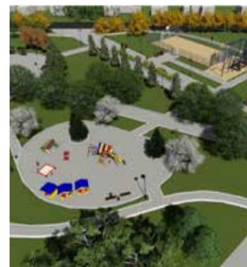
Проект благоустройства сквера Красной Звезды

Весь комплекс мероприятий по благоустройству сквера планируется провести в два этапа. Проектом благоустройства предусмотрено в первоочередном порядке восстановление освещения, устройство детской площадки, установка малых архитектурных форм, урн, скамеек и асфальтирование пешеходных дорожек. Также здесь будет высажено более 60 новых деревьев.