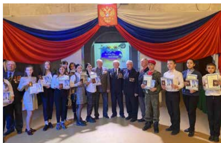
В торжественной обстановке свои первые паспорта получили 12 подростков

Из Омской области в работах по ликвидации последствий аварии на Чернобыльской АЭС приняло участие более 1500 человек, более 800 из них получили инвалидность.