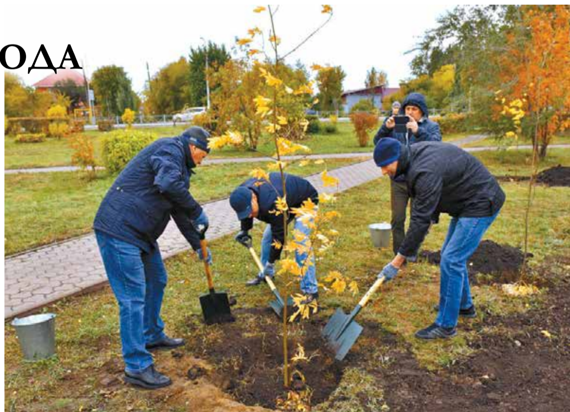
В ходе общегородского субботника осенью прошлого года сквер Красной Звезды украсили 25 саженцами двухметровых лиственниц и рябин

Предпочтение традиционно отдается растениям, которые эффективно очищают воздух от вредных примесей. Так, например, желтая акация задерживает азот и аммиакосодержащие выбросы, вяз отлично улавливает пыль, черемуха – хлористые соединения, а хвойные деревья фильтруют вредные выхлопы и взвеси. Декоративно-лиственные