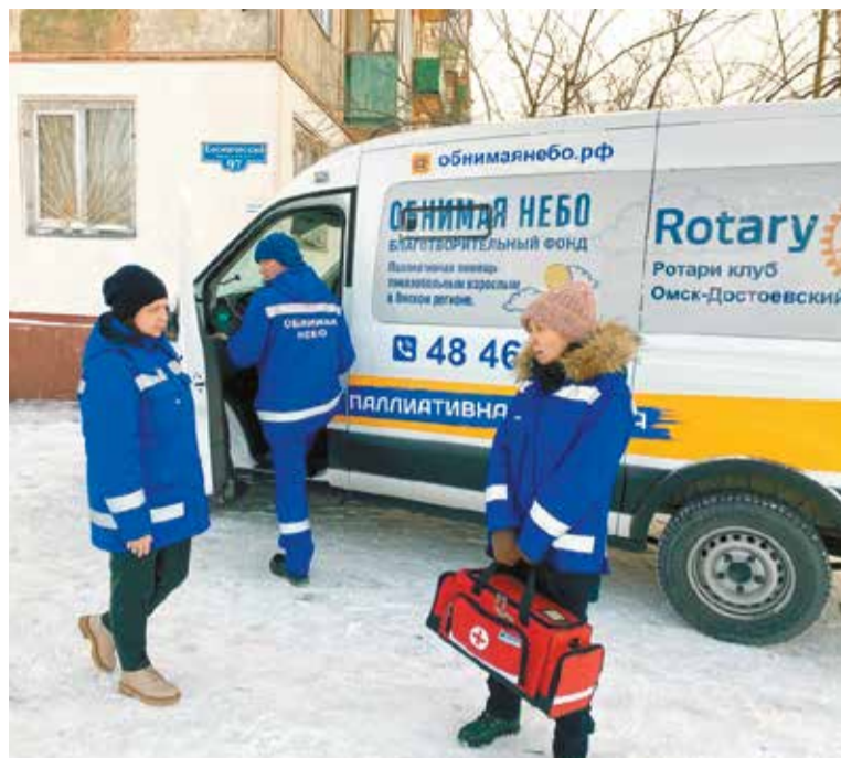
Помощь выездной бригады фонда «Обнимающая небо» бесплатна

Узнать больше о работе фонда и обратиться за помощью можно по телефону (3812) 48-46-25.