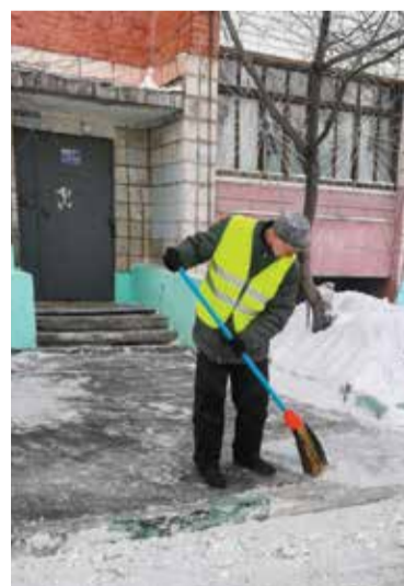
Уборка придомовой территории – ответственность управляющей компании