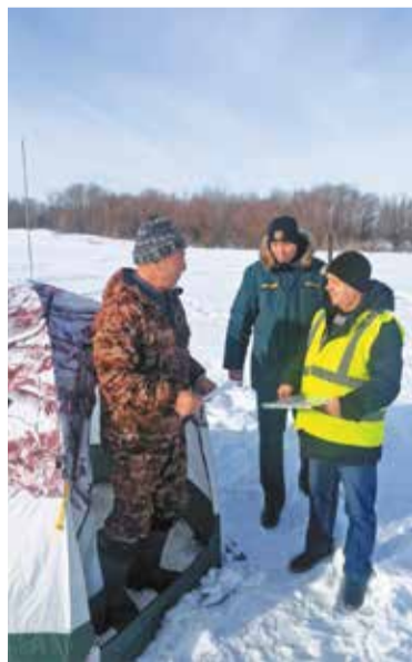
Рыбакам выдают памятки о мерах безопасности на льду

При выходе на лед важно всегда обращать внимание на присутствие вблизи водоемов информационных знаков, таких как «Выход на лед запрещен», и строго следовать их требованиям.