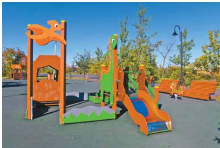
Благоустройство сквера Красной Звезды в этом году продолжится

Кроме того, этот год станет стартовым для благоустройства небольших зон рекреации, так называемых микротерриторий. В Ленинском округе в результате голосования были выбраны 16 объектов, благоустройство которых тоже начнется в апреле: