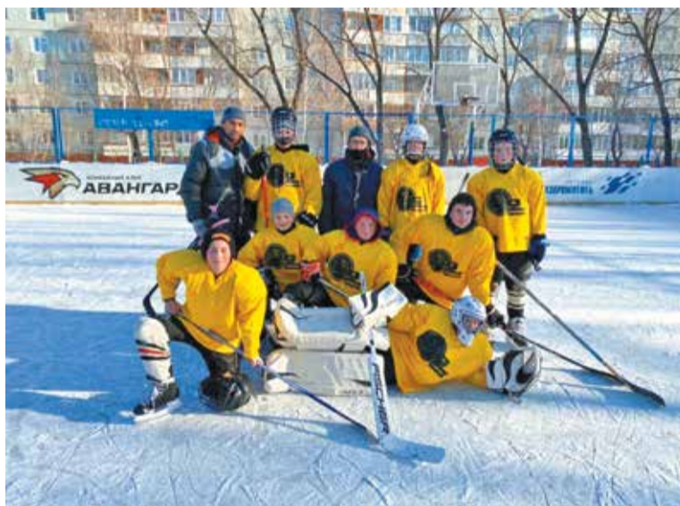
Юные хоккеисты вышли на лед

4 марта 2022 года в Городском дворце культуры и искусств имени Красной Гвардии состоялась торжественная церемония награждения победителей и призеров спартакиады.