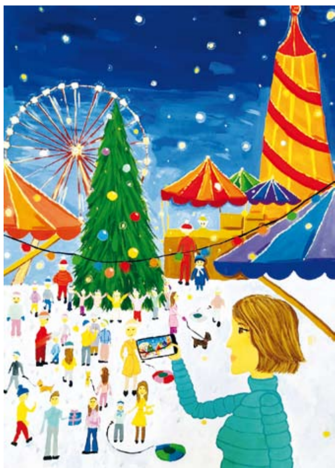
Рисунок Анны Кизнер, 14 лет (детская школа искусств № 3), участницы детского конкурса социальной рекламы «Омская линия».