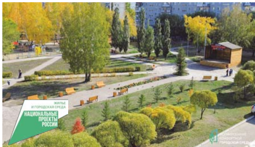
«Московский дворик по-омски»

В целях обеспечения освещения в темное время суток и создания безопасных условий для передвижения пешеходов и автомобильного транспорта в округе построено 5 линий наружного