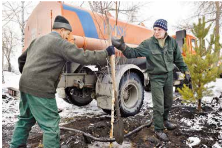
Посадка «крупномеров» на ул. Б. Хмельницкого

Продолжается реконструкция здания театра «Галерка». По проекту к двухэтажному объекту планируется пристроить третий этаж и дополнительные помещения. В 2016 году распахнет двери здание бывшего Дворца культуры «Рубин», которое получит вторую жизнь в качестве культурно-досугового центра. Здесь планируется разместить киноконцертный зал на 700 мест, четыре кинозала, спортивный и тренажерный залы, кафе, а также игровую и развлекательную зоны для детей.