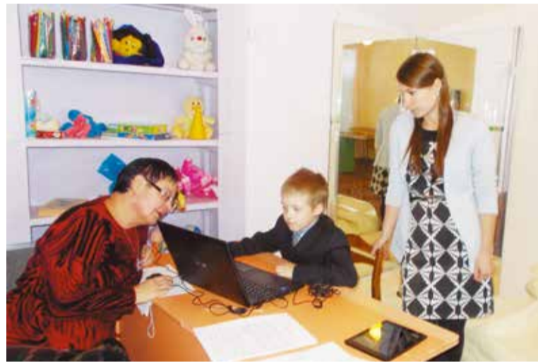
Обучаемся компьютерной графике

Адаптация детей с ограниченными возможностями здоровья в социуме – важная задача не только родителей, но и педагогов. Развитие эмоциональной сферы, обучение компьютерной графике – этим будут заниматься педагоги и психологи социального центра «Вдохновение» и спортивной школы, проводя уроки с использованием новой компьютерной техники.