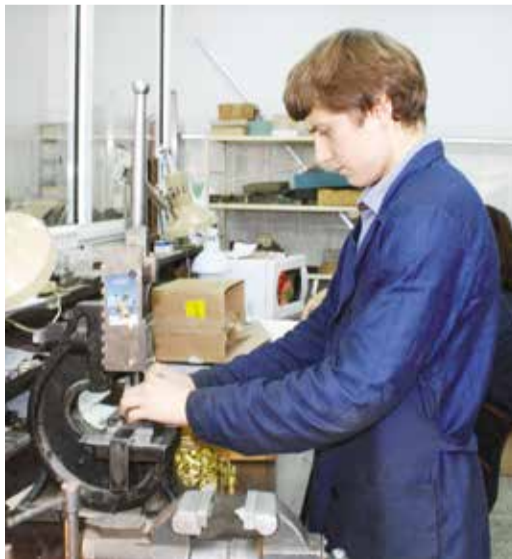
Трудовое лето в ОНИИПе