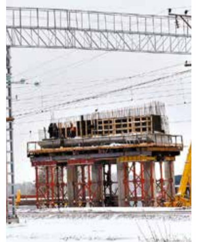
Строительство путепровода на ул. 15-я Рабочая

ством путепровода через железнодорожные пути. Здесь уже выполнен ряд подготовительных работ, территория освобождена от нежилых объектов. Возведены все 10 железобетонных опор. Сегодня идет укрупнительная сборка металлического пролетного строения, одновременно проводится монтаж балок.