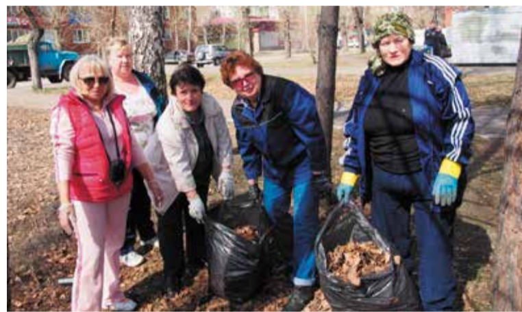
Жители Кордного поселка: убираем наш любимый сквер

гоустройству территории кипела работа и в сквере у ДК «Светоч» (пересечение улиц 1-я Шинная и 4-я Кордная). Напомним, в 2015 году здесь велись активные работы по благоустройству, на средства муниципального гранта был установлен детский городок. Зеленая зона стала излюбленным местом отдыха жителей Кордного поселка, которые приняли активное участие в наведении порядка в сквере.