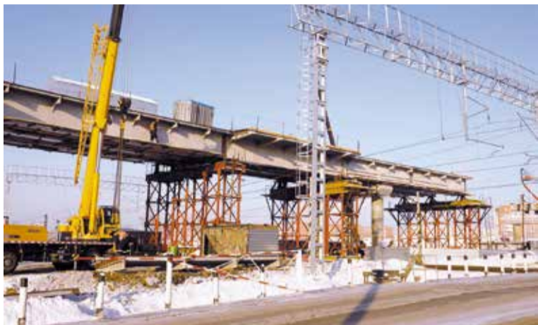
Путепровод на пересечении улиц 15-я Рабочая и Хабаровская будет введен в эксплуатацию в этом году

ние и монтаж линий наружного освещения. Практически завершено строительство подобного объекта по Красному переулку, скоро он будет введен в эксплуатацию. В ближайшее время начнутся работы на «Омской крепости». Не без гордости могу сказать, что мы выполнили все юбилейные планы в рамках предоставленного финансирования, и готовы к новым стройкам.