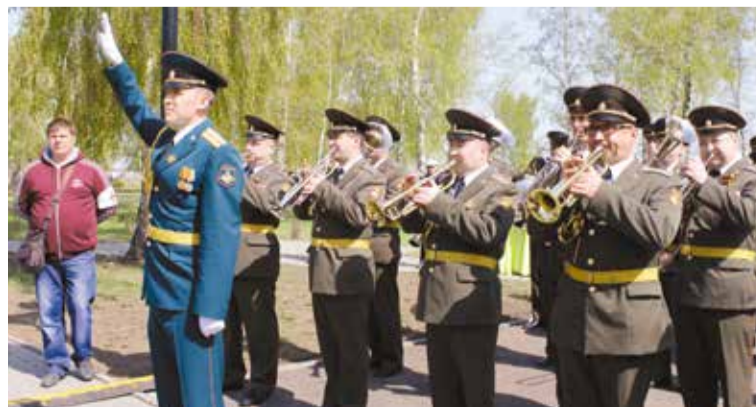
На ежегодном мероприятии «В лесу прифронтовом». Спасибо вам, фронтовики и труженики тыла