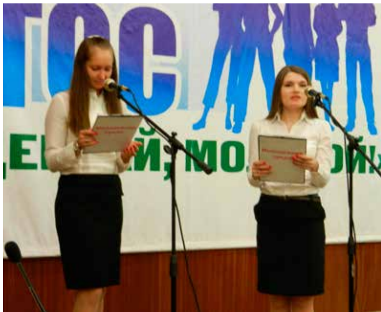
Выступление молодежного совета КТОСа «Чкаловский-3»

К ребятам из КТОСа «Чкаловский-3» присоединились представители молодежного совета КТОСа «Шинник». Команда «Альянс» также приняла участие в городском конкурсе «Дерзай, молодой!». Ребята защищали проект «Время выбрало нас». При его презентации были выделены три основных направления: гражданско-патриотическое, спортивно-трудовое и историко-краеведческое.