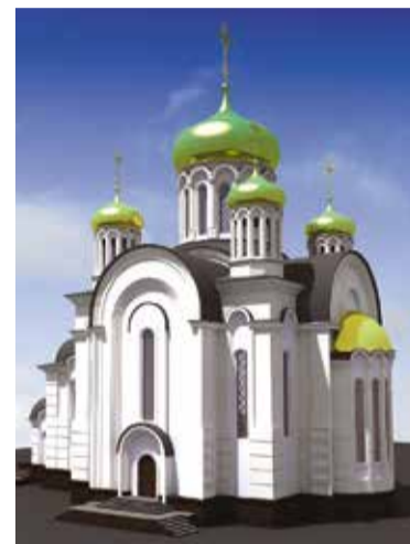
Эскиз будущего храма