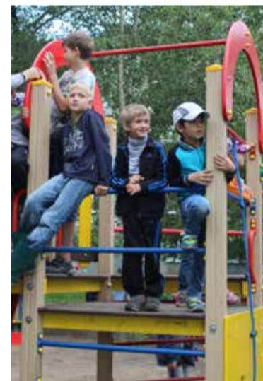
Наш двор — лучший!

мочь своим социальным партнерам — школам №№ 142 и 40 в установке на их территориях новых спортивных тренажеров. Причем, учебные учреждения намерены взять эти объекты на свой баланс.