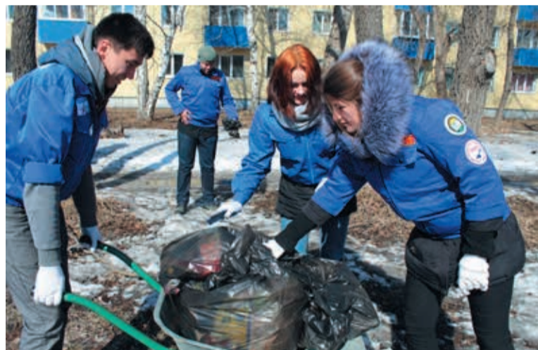
Студенты-волонтеры в КТОСе «Чкаловский-1»

По словам специалистов, преимущественно высаживались: сосна, ель, лиственница, ива шаровидная, ива плакучая, рябина обыкновенная, яблоня, спирея японская — всего 20 видов деревьев ценных пород и декоративных кустарников.