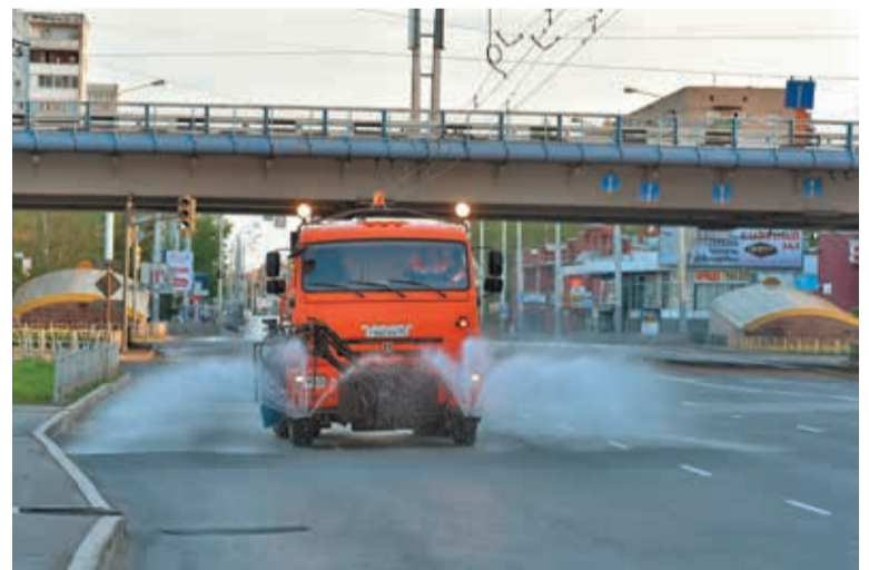
Дороги начинают мыть в 4 часа утра

В департаменте городского хозяйства мэрии сообщили, что, кроме того, за счет