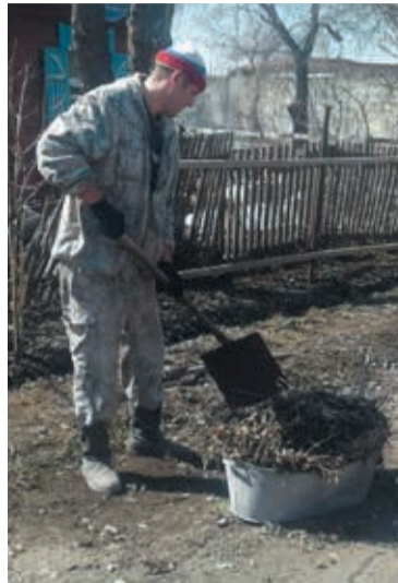
Работа кипела вовсю

Традиционно в период месячника выполнялись ра-