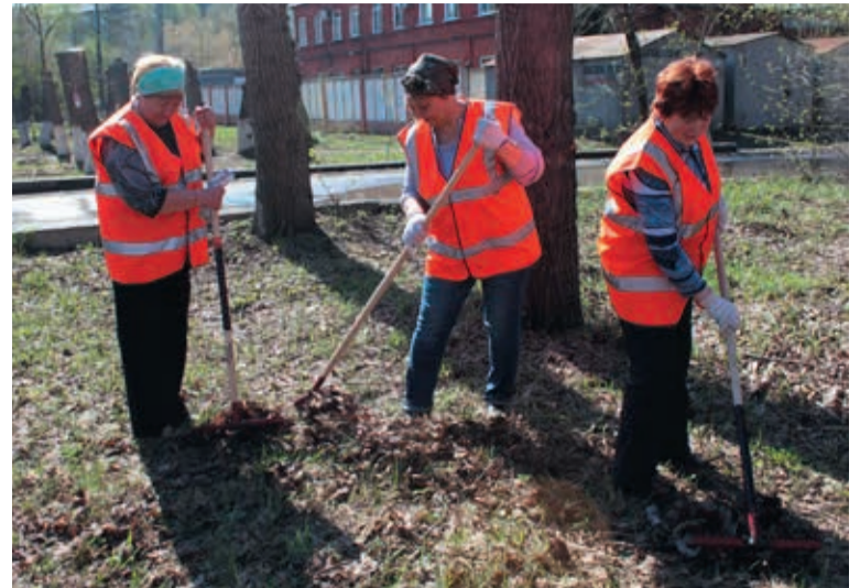
Управляющие компании дружно взялись за дело