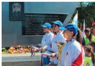
Легкоатлетический забег прошел по улицам Алексея Романенко, 75-й Гвардейской бригады, Петра Осьминова

Завершающим мероприятием, проводимым на территории Октябрьского округа в рамках празднования 72-й годовщины Победы, стала традиционная эстафета Памяти.