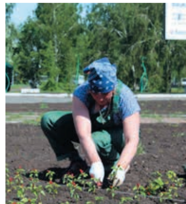
Украшаем цветами округ

Поучаствуют в оформлении будущей «Флоры-2017» АО «ЦКБА», ООО «Омсктехглерод», ЗАО «Завод розлива минеральной воды «Омский», тем самым сделав замечательный подарок Октябрьскому округу к юбилею.