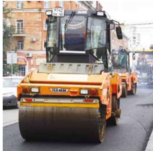
Комплексный ремонт дорог будет выполняться с использованием новых технологий