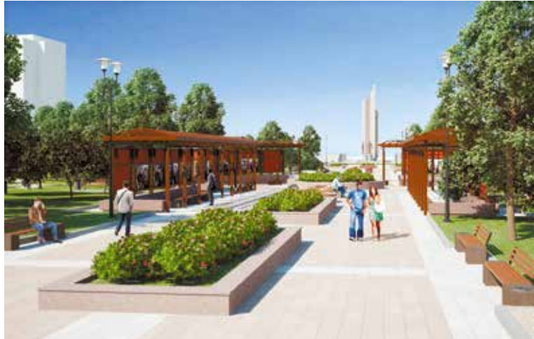
Проектное решение второго этапа работ по благоустройству бульвара Победы

В этом году в рамках национального проекта по формированию комфортной городской среды в Омске будут завершены работы по благоустройству знакового для многих жителей места – бульвара Победы.