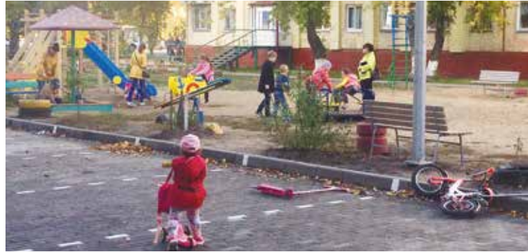
Двор по пр. Космическому, 12

В Октябрьском округе с учетом начисленных баллов составлен ранжированный список домов, собственники которых через своих представителей подали заявки на ремонт дворовых территорий в рамках национального проекта «Жилье и городская среда».