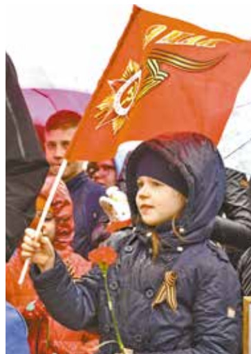
Встречаем светлый майский праздник

● Продемонстрировать умения в строевой подготовке предстоит 24 апреля в 15:00 старшеклассникам школ, ставших победителями в отборочном этапе, который прошел на базе школы № 41. Мероприятие пройдет на площади у памятника омичам – труженикам тыла.