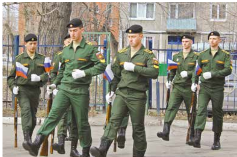
Четко держим каждый шаг

Весенняя кампания по призыву в ряды Вооруженных сил Российской Федерации продлится до конца июля.