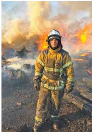
В нашем регионе резко возросло число природных и техногенных пожаров.

Для предотвращения пожаров в частных и многоквартирных жилых домах постоянно ведется профилактическая работа с семьями, состоящими на различных