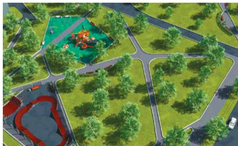
Дизайн-проект территории сквера «Рубиновая мечта»