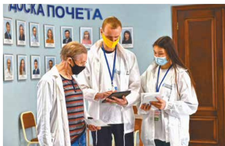
Волонтеры помогают омичам проголосовать за понравившийся дизайн-проект

9. После регистрации по номеру телефона или через Госу-