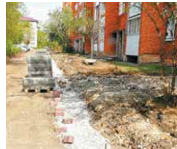
Подрядная организация ООО «ЗавГор» уже начала работы по нацпроекту

На данной территории в соответствии с дизайн-проектом и локально-сметной документацией планируется выполнить довольно внушительный объем работ по асфальтированию проездов, обустройству тротуаров. Кроме того, запланирована установка скамеек и урн.