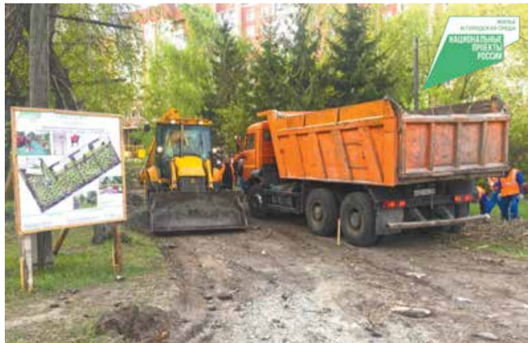
Специалисты окружной администрации контролируют ход работ по благоустройству сквера

В сквере будет проведено зонирование территории. Здесь выделят зоны для рекреации, отдыха, прогулок и активных игр, для автомобилей обустроят парковки, потоки пешеходов пересекаться не будут. Для спокойного отдыха сделают специальную территорию, на которой появятся скамейки, вазоны и