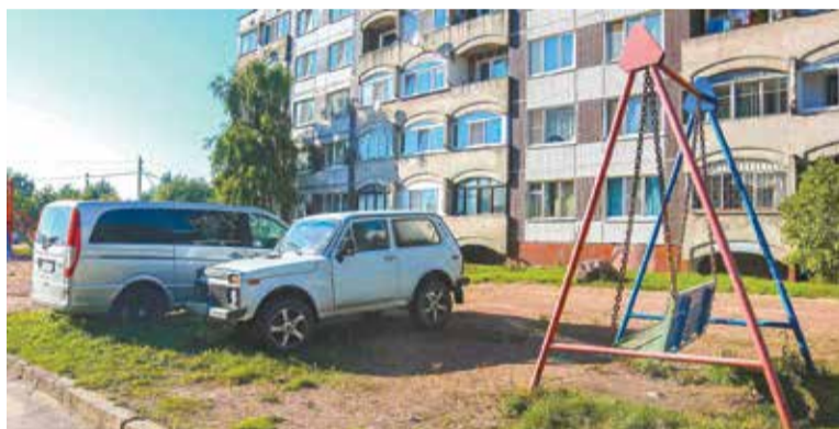
Специалисты окружной администрации фиксируют нарушения прибором «ПаркНет»

В соответствии с Кодексом Омской области об административных правонарушениях, за первое нарушение предусмотрено предупреждение, за второе – штраф в тысячу рублей. В случае повторного нарушения в течение года – до двух тысяч рублей. Значительно вырастает сумма штрафов для юридических и должностных лиц. Если оплатить штраф в течение 20 дней, то сумма сокращается в два раза.