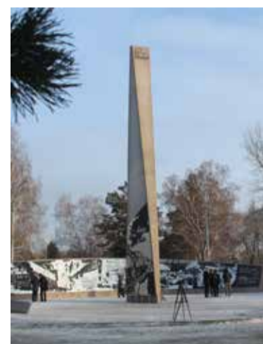
Монумент достигает в высоту 16 метров

Напомним, что памятная стела установлена по инициативе и поддержке Российского военно-исторического общества, Правительства Омской области и администрации города Омска. Автором проекта установки стелы в Омске стал скульптор-монументалист, архитектор Денис Стритович.