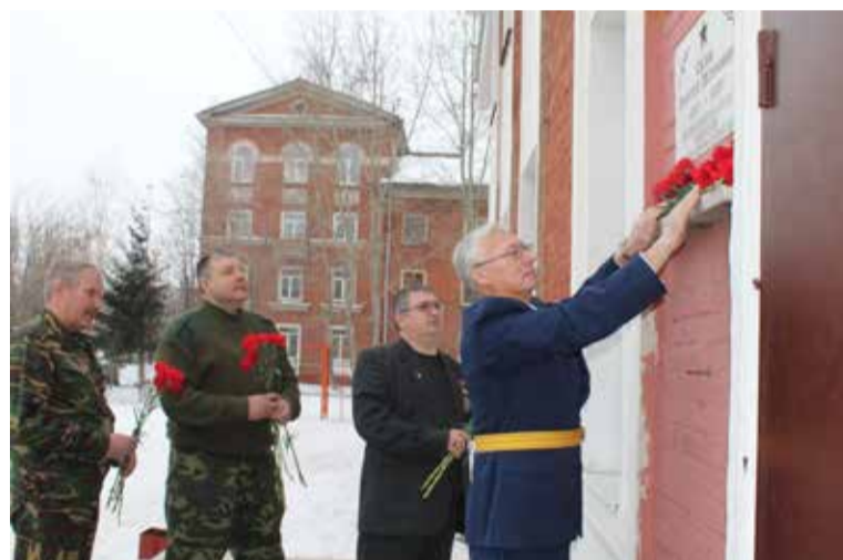
Ежегодно в рамках акции «Память» возлагают цветы к стелам, мемориальным доскам, расположенным на территории Октябрьского округа

26 февраля во Дворце культуры им. В. Е. Часницкого в Крутой Горке состоится XI патриотический фестиваль «Я люблю тебя, Россия!».