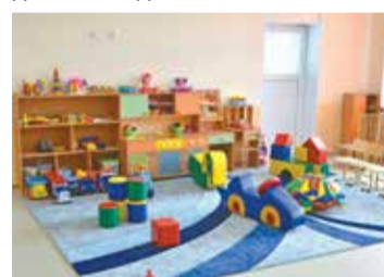
Детские сады обеспечены оборудованием и игрушками

Кроме того, в 2020 году были выполнены ремонтные работы для открытия 13 дополнительных групп на 250 мест для детей до 3 лет в 13 в действующих детских садах.