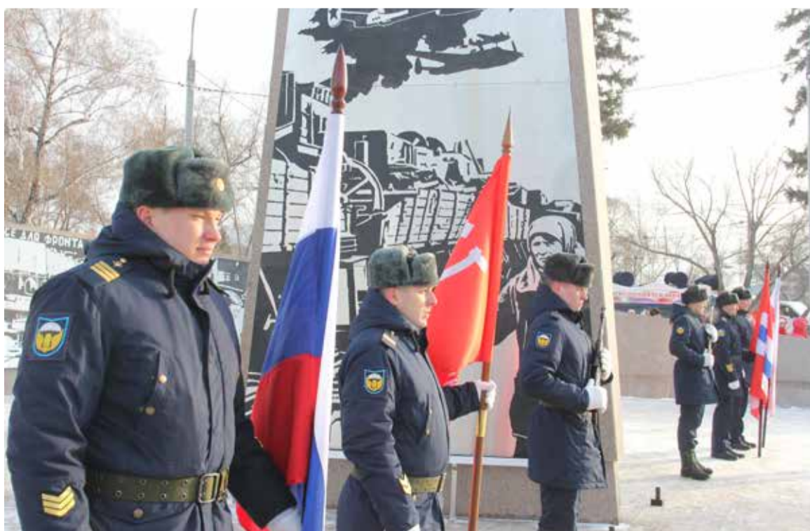
На торжественном открытии стелы «Город трудовой доблести»

В годы войны на Омской земле было развернуто около 200 эвакуированных предприятий. Поначалу, пока не были построены заводские корпуса, станки размещались под открытым небом. Помимо промышленных предприятий, в Омске было размещено более 60 госпиталей, а также десятки учебных заведений и учреждений культуры. Несмотря на все тяготы военного времени, продолжалась культурная жизнь – на омской сцене играли актеры театров им. Вахтангова и «Ромэн», летом благоустраивались городские парки и пляжи, зимой устраивались городские елки.