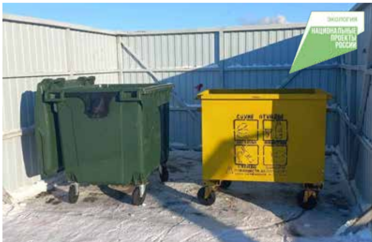
На желтые контейнеры в виде инфографики нанесена инструкция о том, какие отходы нужно в них складывать

Для решения вопроса об обустройстве площадки с контейнерами для разделного накопления твердых коммунальных отходов собственникам помещений в многоквартирном доме необходимо инициировать общее собрание собственников. На собрании рассмотреть вопрос о месте размещения площадки для накопления твердых коммунальных отходов и определить источник финансирования, протокол общего собрания направить в управляющую организацию. После обустройства данной площадки необходимо подать заявку для внесения в территориальную схему обращения с отходами и реестр мест (площадок) накопления твердых коммунальных отходов в администрацию Октябрьского округа.