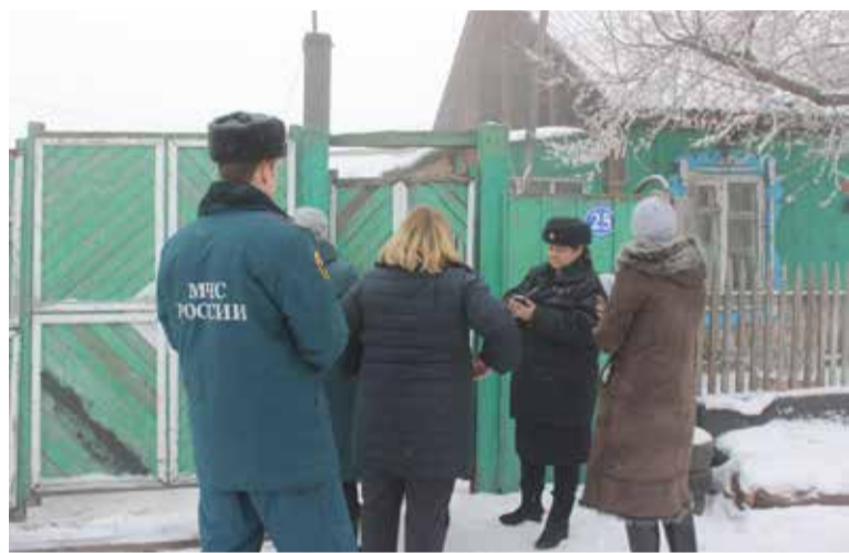
Жителям частного сектора регулярно вручают памятки пожарной безопасности

Не стоит пользоваться самодельными электроприборами. За каждым предметом необходимо следить – вовремя ремонтировать, не перегружать, заменять детали, очищать от пыли. Сетевые провода не следует пропускать под коврами или мебелью. Важно не оставлять детей без присмотра при включенных электроприборах. А уходя из дома, желательно отключать все, что возможно.