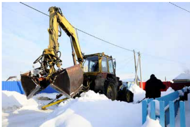
Домовладельцам частного сектора, согласно действующим Правилам благоустройства, необходимо убирать и вывозить снег самостоятельно

«В управляющих компаниях созданы противопожарные