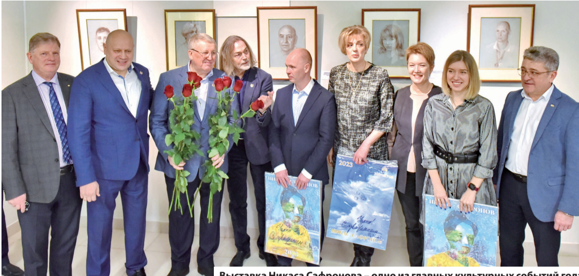
Выставка Никаса Сафронова – одно из главных культурных событий года