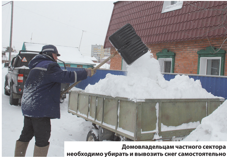
Домовладельцам частного сектора необходимо убирать и вывозить снег самостоятельно

Комиссия также осуществляет контроль за вывозом снега, очисткой от различного вида осадков крыш зданий, ливневых лотков, канав, водопропускных труб и дождеприемных колодцев. Кроме того, члены комиссии проверяют готовность откачивающих механизмов и специализированной техники для проведения аварийных работ.