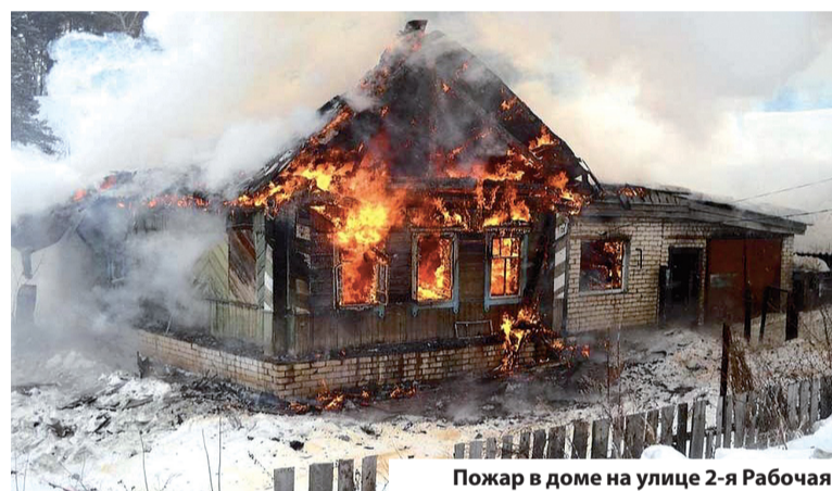
Пожар в доме на улице 2-я Рабочая из-за неисправности электропроводки

Помните, что, нарушая правила дорожного движения на железнодорожных переездах, вы ставите под угрозу не только свою жизнь, но и жизни сотен пассажиров поездов и работников локомотивных бригад!