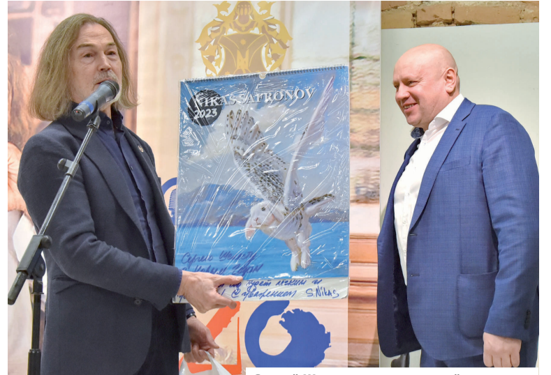
Сергей Шелест и легендарный художник