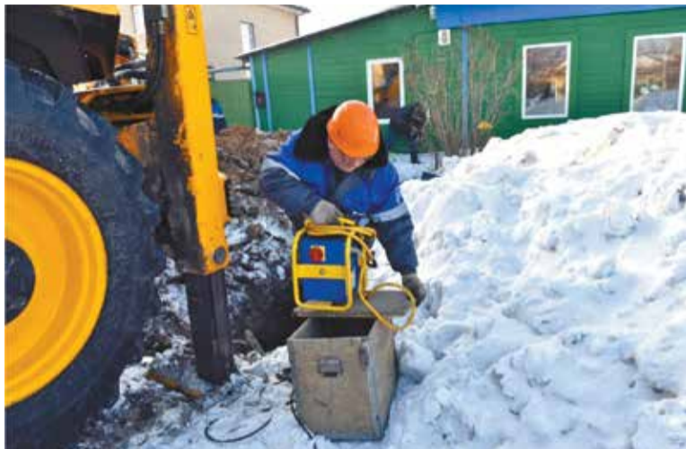
Программа догазификации позволяет бесплатно подводить газ к границам земельных участков

Единственный критерий: подведение газа до границы земельного участка осуществляется только в зарегистрированное домовладение. Подвести газ к