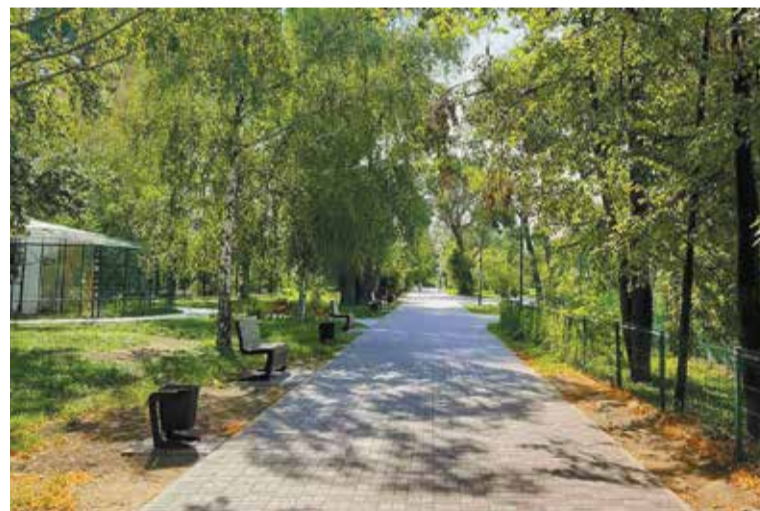
Благоустройство Сада юннатов в этом году продолжится

Кроме того, этот год станет стартовым для благоустройства