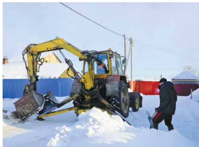
Жители частного сектора очищают территорию возле своих домов

Общественники обращают внимание омичей на то, что от снега и мусора необходимо очистить не только придомовую территорию, но и имеющиеся водоотводы. На случай возможного подтопления жители должны заблаговременно поднять продукты из погребов и подвалов, а также иметь в распоряжении бытовые электронасосы, ведра, лопаты или другой инвентарь. Если вода все же подойдет к дому, необходимо переместить ценные вещи на верхний этаж или чердак, поднять электроприборы на