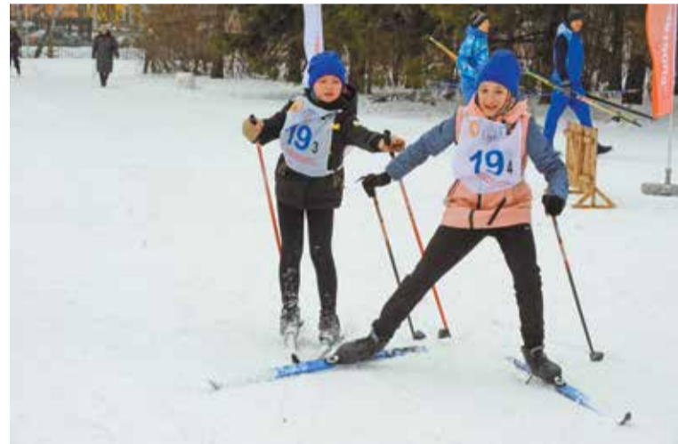
Команда Центрального округа завоевала на соревнованиях медали различного достоинства