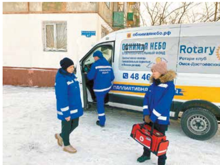
Помощь выездной бригады фонда «Обнимаю небо» бесплатна

Узнать больше о работе фонда и обратиться за помощью можно по телефону (3812) 48-46-25.