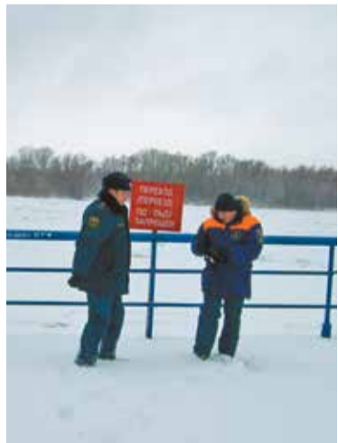
Специалисты предупреждают об опасности выхода на лед

Родителям следует не допускать выход на лед детей, помнить о том, что нельзя подходить к водоему и проверять прочность льда ударом ноги.