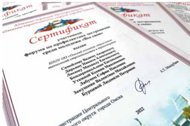
Участники форума награждены сертификатами окружной администрации

Все участники IX форума по профилактике экстремизма среди молодежи «Все свои» награждены сертификатами окружной администрации.