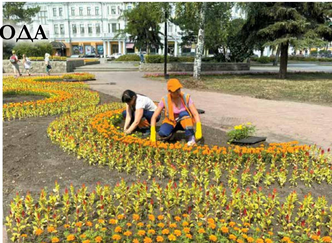
В этом году в Омске к 9 Мая высадят 45 тысяч цветов – бархатцы желтые и оранжевые, сальвию, красную, белую и синюю петунию

Предпочтение традиционно отдается растениям, которые эффективно очищают воздух от вредных примесей. Так, например, желтая акация задерживает азот и аммиакосодержащие выбросы, вяз отлично улавливает пыль, черемуха – хлористые соединения, а хвойные деревья фильтруют вредные выхлопы и взвеси. Декоративно-лиственные