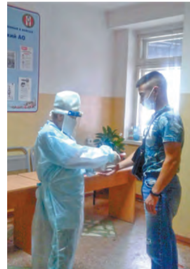
Призывники проходят санитарный контроль