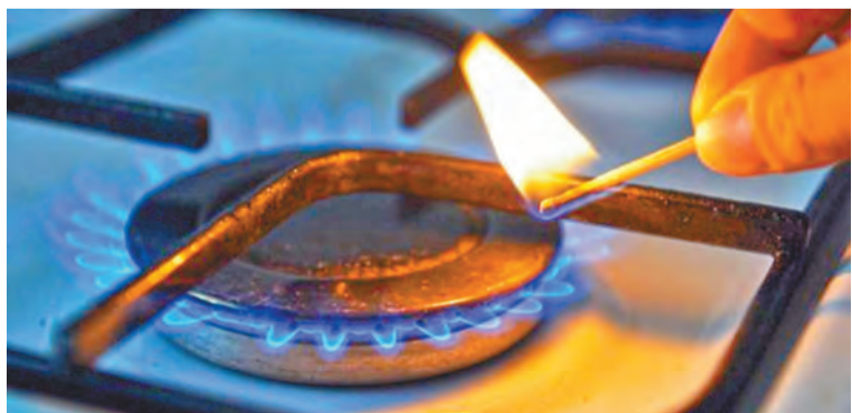
Использование газового оборудования требует осторожности

Почувствовав запах газа, перекройте краны на газобаллонной установке – вентиль на баллоне. Не зажигайте огонь. Не курите. Не включайте и не выключайте электроосвещение и другие электроприборы. Откройте форточки, окна, двери для проветривания помещения и звоните: 04 или 71-38-38.