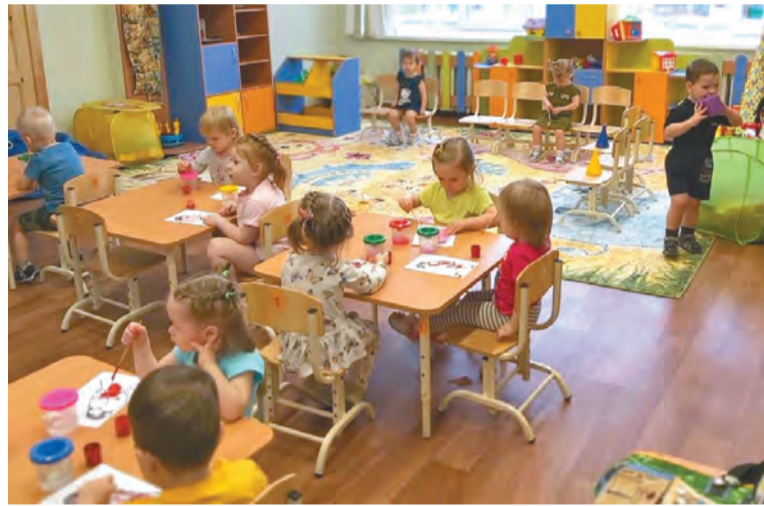
В действующих детских садах открываются ясельные группы

Кроме того, увеличение мест для дошкольников достигается за счет создания дополнительных мест для детей от 2 месяцев до 3 лет. Так, в рамках федерального проекта «Содействие занятости» национального проекта «Демография» с 2018-го по 2020 год созданы 923 дополнительных места. В 2021 году планируется создание 306 мест, открытие 15 групп в 14 действующих детских садах.