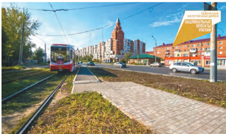
Комплексный дорожный ремонт на ул. М. Жукова

Всего в текущем году по нацпроекту «Безопасные качественные