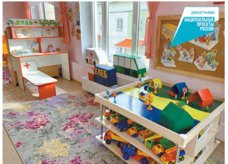
В детском саду созданы комфортные условия для малышей – уютные спальные и групповые помещения

Для дополнительных индивидуальных и групповых занятий с детьми, проведения консультаций с родителями, мероприятий с педагогами в детском саду имеются кабинеты логопеда, педагога-психолога, старшего воспитателя, изостудия, кабинеты