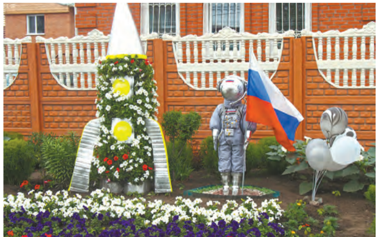
Арт-объект во дворе дома № 25 по улице Судоремонтной – 1-е место