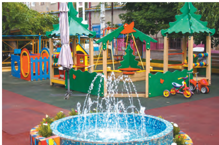
Детская площадка во дворе дома № 10 по пр. К. Маркса – 1-е место

Стали известны имена победителей городского конкурса по благоустройству территории «Омские улицы». В этом году он проходил в 19-й раз в рамках празднования 305-летнего дня рождения города.