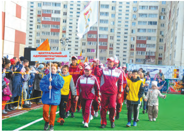
Команда Центрального округа на параде участников спартакиады

В последние выходные сентября в Омске прошли финальные соревнования XX городской спартакиады «Спортивный город» по летней программе.