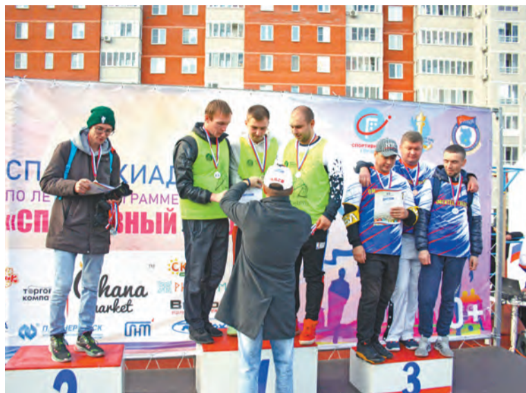
Лидер стритбольного турнира – коллектив «Омскэнерго»

Напомним, что в текущем году в рамках спартакиады впервые состоялся турнир по русской лапте среди команд клубов для детей и молодежи. В оргкомитете отметили, что эти соревнования проводились вне зачета. Однако не исключено, что уже в следующем году состязания войдут в основную программу. Победителем здесь стала команда «Молодость».