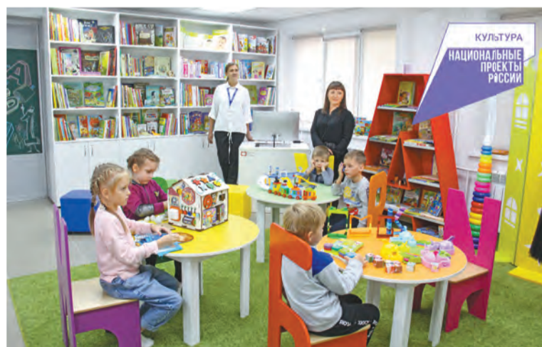
«Буквоград» наполнен стеллажами, стульями, игрушками в виде букв

В обновленной библиотеке появилась литературная гостиная –