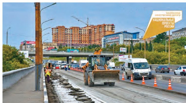
Масштаб работ на Фрунзенском мосту впечатляет: более километра в длину, тротуары и шесть полос для движения транспорта

При благоприятных погодных условиях Фрунзенский мост будет полностью отремонтирован до конца октября. Весь технологический процесс, производственный график и качество работ на этом объекте контролируются Управлением дорожного хозяйства и благоустройства и организацией строительного контроля – ООО «СибДорЦентр».