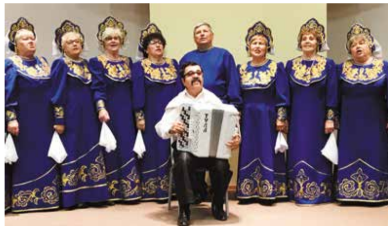
Артисты народного хора «Россияне» – постоянные участники песенного фестиваля

Завершился окружной этап фестиваля «Народные самоцветы».