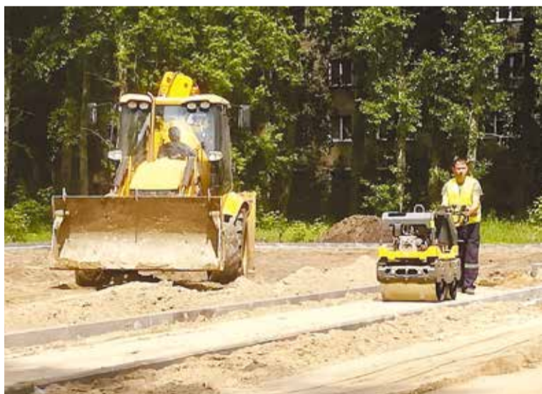
В сквере появились новые пешеходные аллеи

На благоустройство было выделено 3 000 000 рублей.