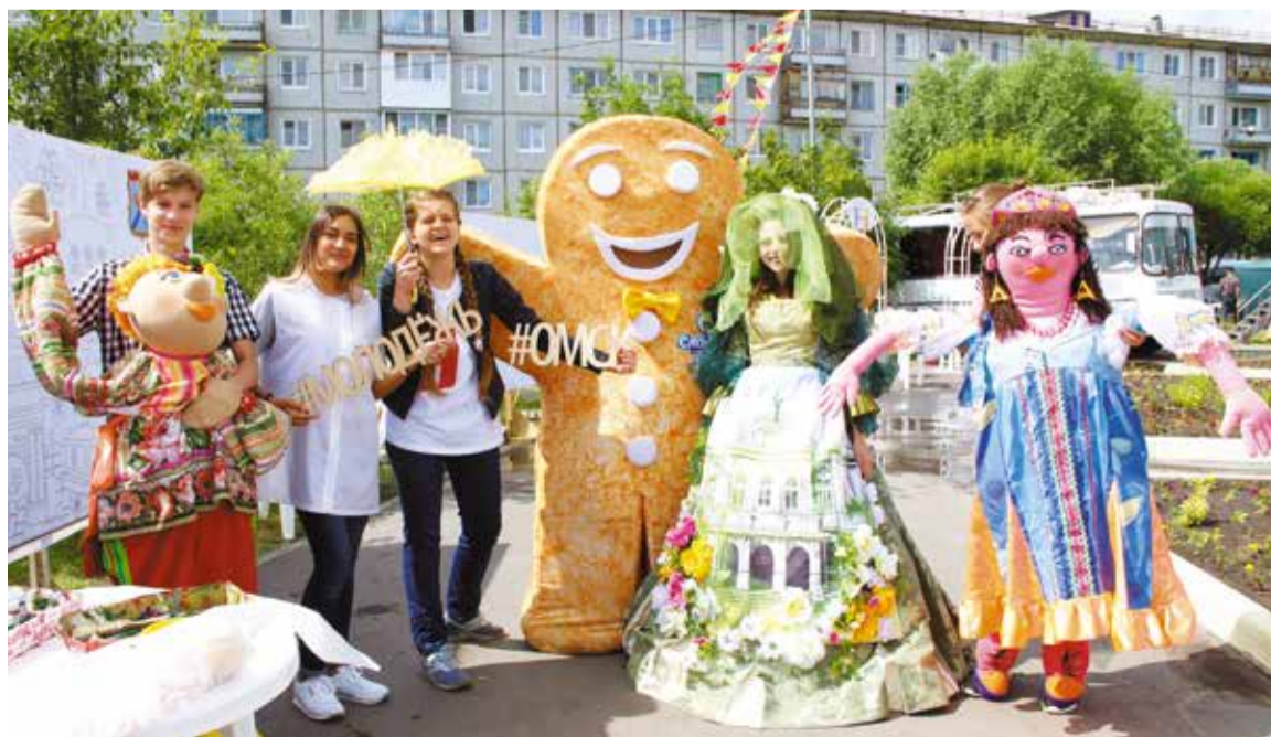
Театральная тема станет лейтмотивом всех окружных мероприятий, посвященных Дню города

«Независимо от статуса, все праздничные программы будут разнообразными и ориентированными на различные возрастные и социальные категории горожан. Кроме того, мы организовали мероприятия таким образом, чтобы в любой точке округа праздники были равноценными по своей насыщенности», – подчеркнула Олеся Гаврилова.