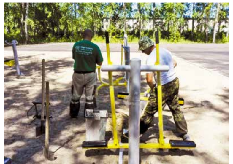
Уличные тренажеры установлены на средства муниципального гранта

Не остались в стороне и сами жители микрорайона.