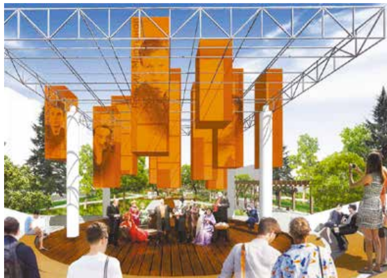
Предполагается, что форум станет центром притяжения бульвара Мартынова

Особое внимание также уделено вопросам безопасности.