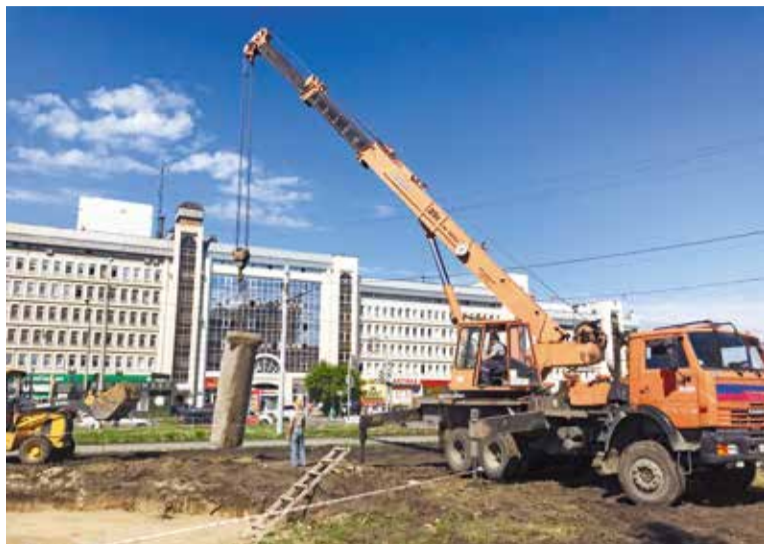
В первую очередь строители приступили к возведению Литературного форума

В первую очередь строители приступили к возведению Литературного форума. Он будет представлять собой открытую площадку с трибуной в виде амфитеатра на 250 мест, сценой и металлически-