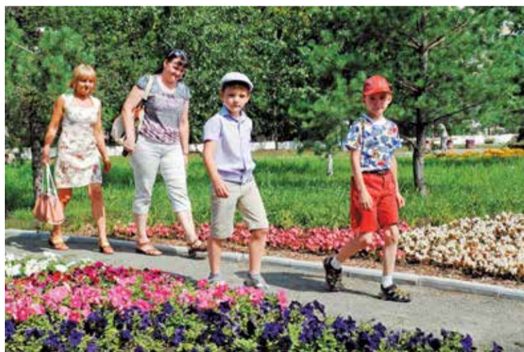
На озеленение города будет выделено около 129 миллионов рублей

В частности, в этом году работы по благоустройству и озеленению будут выполняться в 10-м микрорайоне (2-я очередь) и сквере Авиаторов в Кировском округе; сквере микрорайона «Загородный» в Центральном округе; на территории по улице Эн-