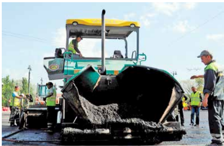
Нынешним летом у дорожников будет много работы

– Подрядчики будут определены по результатам проведения конкурсных процедур. К ремонту городских магистралей приступим уже в мае. По опыту прошлого года будет организована многоступенчатая система контроля за качеством работ с привлечением ученых, общественников, средств массовой информации. За короткий срок предстоит выполнить большой объем ремонтных работ, завершить их планируем уже к концу сентября.