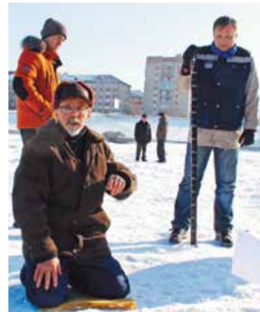
Во время рейда по Иртышу

В период весеннего таяния лед становится пористым и слабым, покрывается талой водой, размягчается, приобретает беловатый цвет. Выходить на такой лед чрезвычайно опасно.