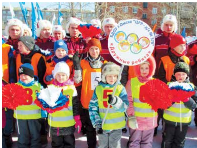
Сборная команда Центрального округа на открытии спартакиады

Одним из самых зрелищных видов спорта стали «Ве-