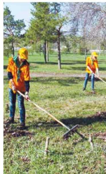
Общегородской субботник состоится 22 апреля

Специалистами «Управления дорожного хозяйства и благоустройства» города планируется вывезти не менее 10 000 кубометров мусора, в том числе с мест несанкционированных свалок.