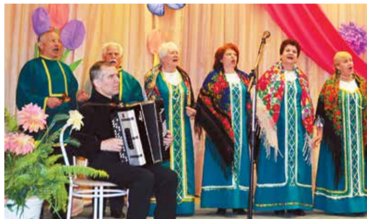
Народный хор ветеранов труда «Околица»

20 хороших коллективов сошлись в творческом объединении за звание лучшего в своем жанре. В этом году фестиваль посвящен Году экологии в России.