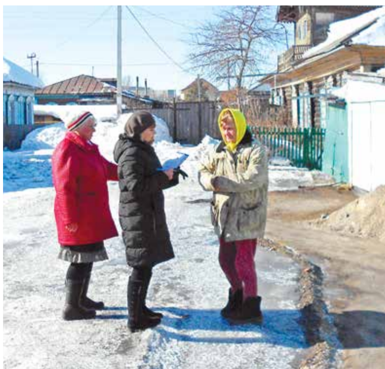
Во время рейдов жители частных домов получают памятки, где указаны телефоны специализированных служб

В настоящее время в частном секторе ежедневно проводятся рейды. Активисты КТОСов выдали уже более 2000 уведомлений о необходимости соблюдать Правила благоустройства, обеспечения чистоты и порядка. Еще более 900 уведомлений жители частного сектора получили от специалистов администрации округа.