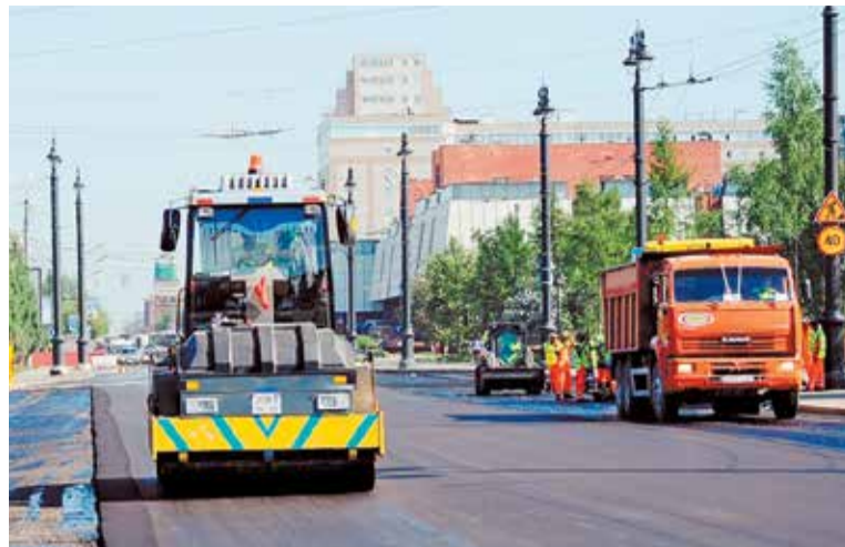
За два года отремонтируют 65 дорог