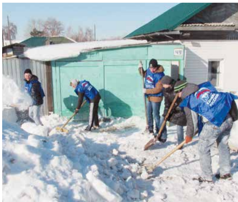
Всего за пару часов волонтеры убрали прилегающую территорию от снега