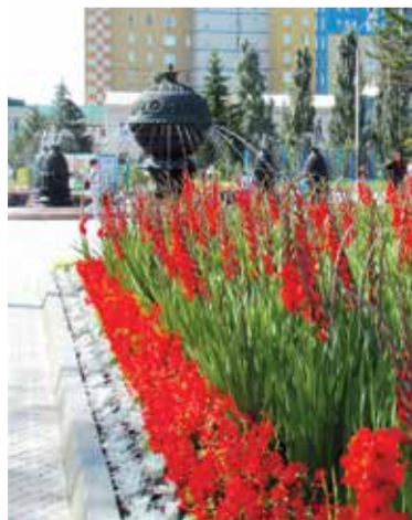
Гладиолусы в сквере им. 30-летия ВЛКСМ. 2016 год

В 2017 году городскими службами будет высажено не менее 5000 деревьев ценных пород, 8000 декоративных кустарников, 2,5 миллиона цветов.