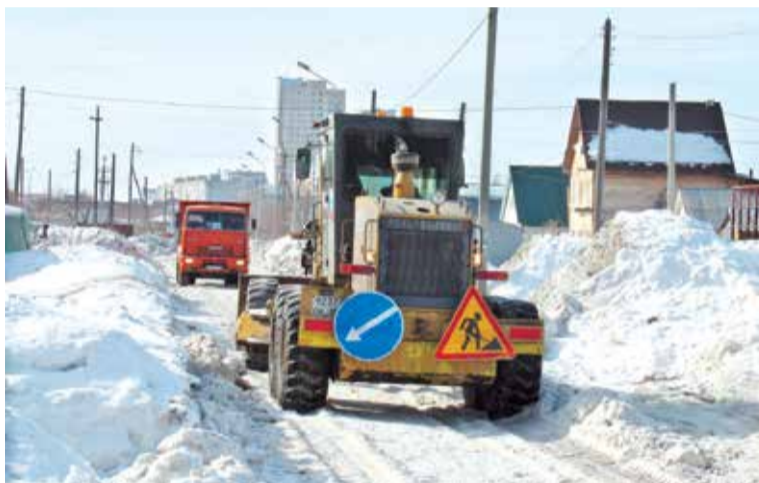
К работам по вывозу снега привлечена дополнительная техника

Что касается мест возможного подтопления домов частного сектора, то больше всего