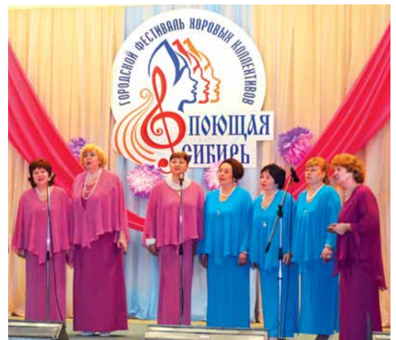
В исполнении ансамбля «Элегия» зрители услышали композицию «Черемуха»

В этом году за звание лучшего хорового коллектива Омска будут бороться артисты вокального ансамбля «Ретро» Культурного центра УМВД России по Омской области, творческого объединения «Камертон», ансамбля «Россиянка» Куйбышевского дома-интерната для престарелых и инвалидов, вокального ансамбля «Арсенал» Омской академии МВД России, вокального ансамбля «Сонет» Омского библиотечного техникума, народного хора ветеранов труда «Околица» КДЦ «Импульс», народного вокального ансамбля «Русская душа» и народного ансамбля академического пения «Элегия» Областного дома ветеранов.