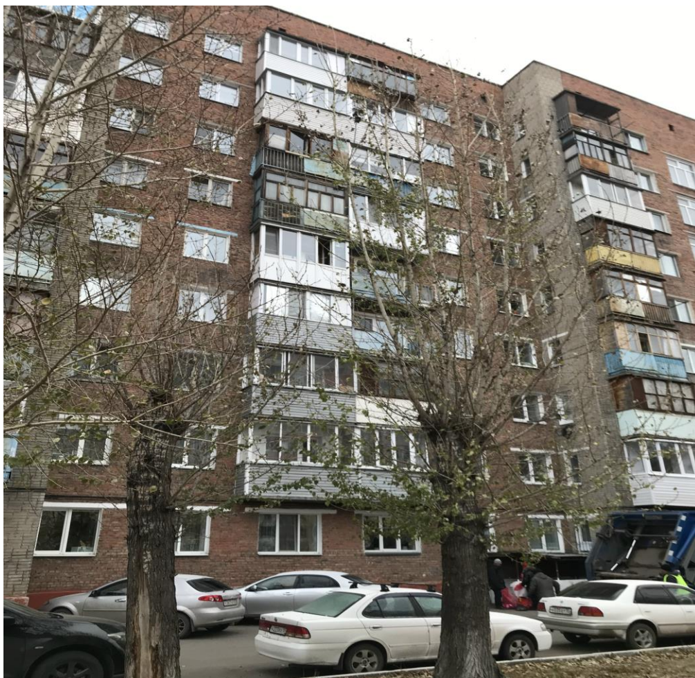
Фото 4. Объект недвижимости. Дата и время съемки: 31.10.2022, 09:53.