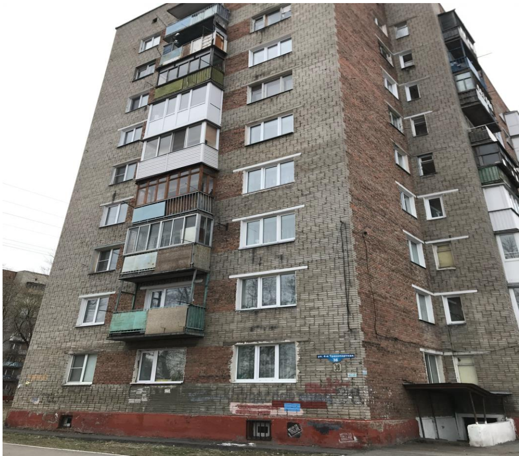
Фото 2. Объект недвижимости. Дата и время съемки: 31.10.2022, 09:53.