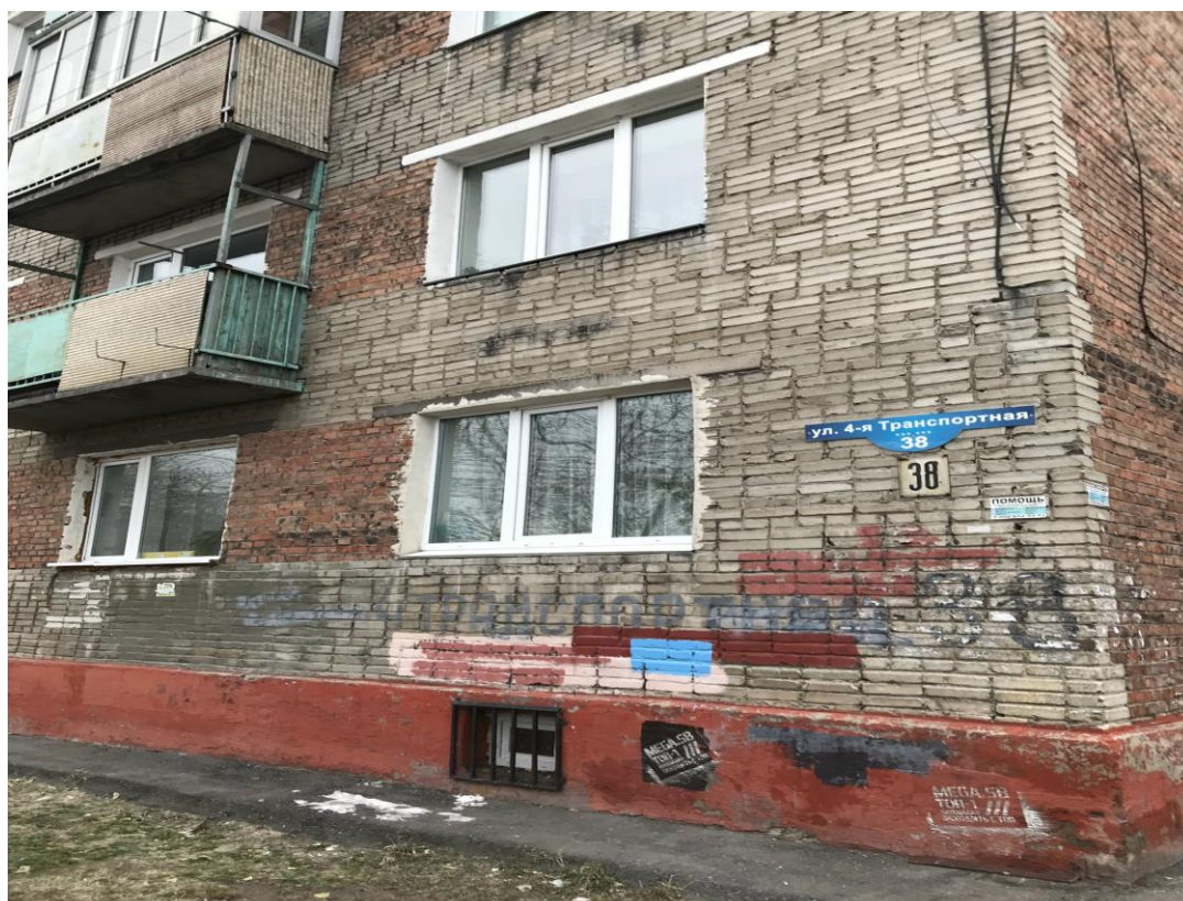
Фото 1. Объект недвижимости. Дата и время съемки: 31.10.2022, 09:53.