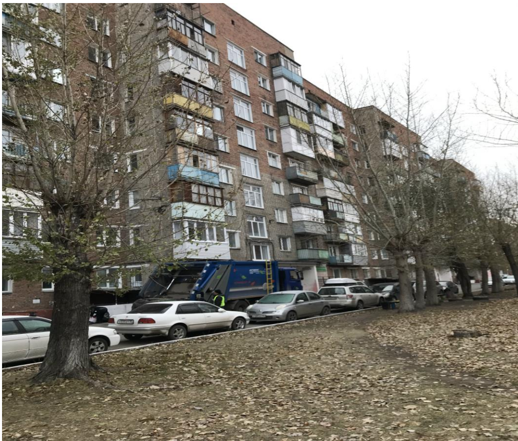
Фото 3. Объект недвижимости. Дата и время съемки: 31.10.2022, 09:53.