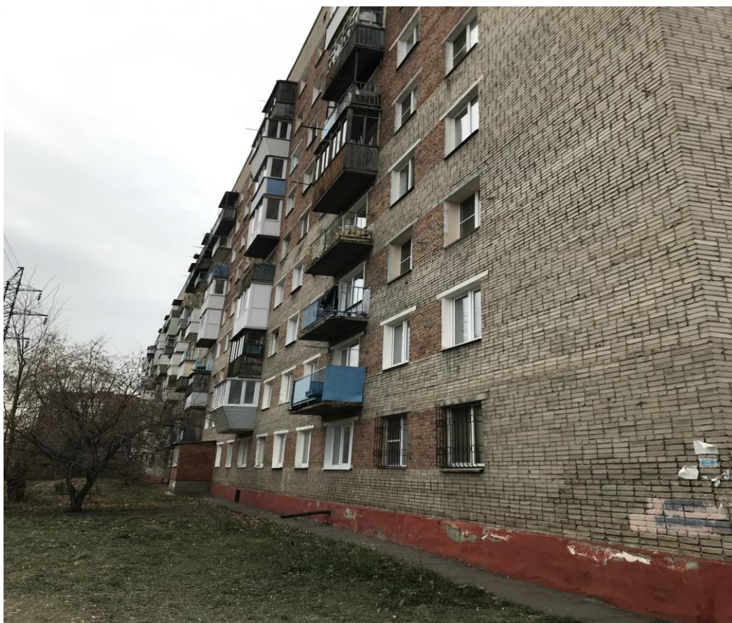
Фото 5. Объект недвижимости. Дата и время съемки: 31.10.2022, 09:53.