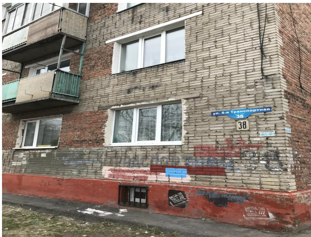
Фото 1. Объект недвижимости. Дата и время съемки: 31.10.2022, 09:53.