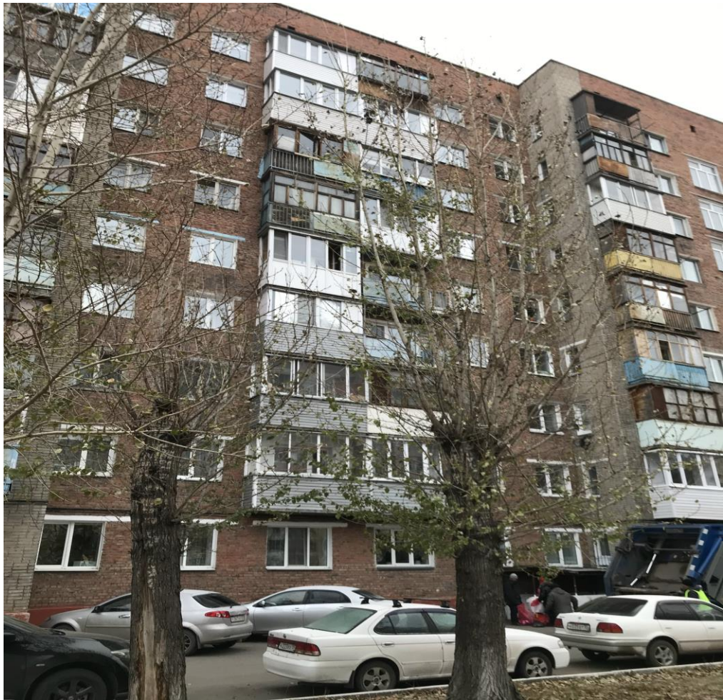
Фото 4. Объект недвижимости. Дата и время съемки: 31.10.2022, 09:53.