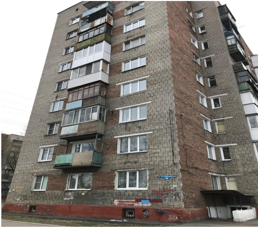
Фото 2. Объект недвижимости. Дата и время съемки: 31.10.2022, 09:53.