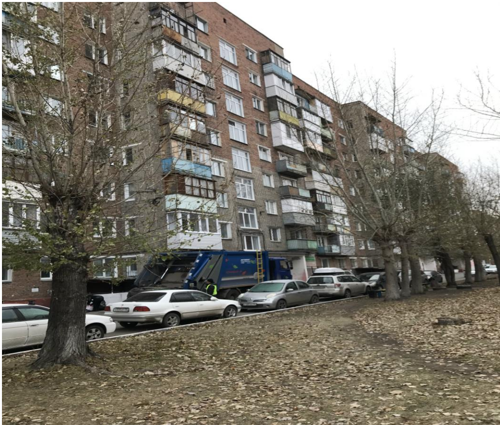
Фото 3. Объект недвижимости. Дата и время съемки: 31.10.2022, 09:53.