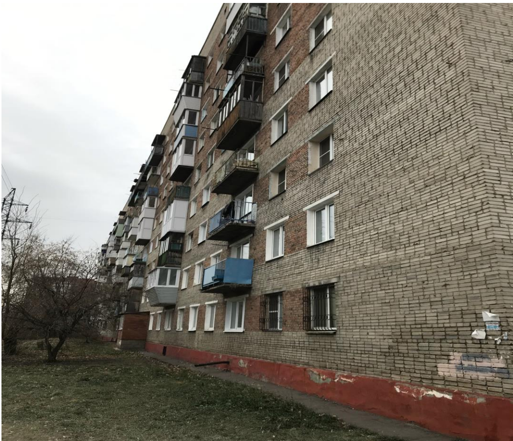
Фото 5. Объект недвижимости. Дата и время съемки: 31.10.2022, 09:53.