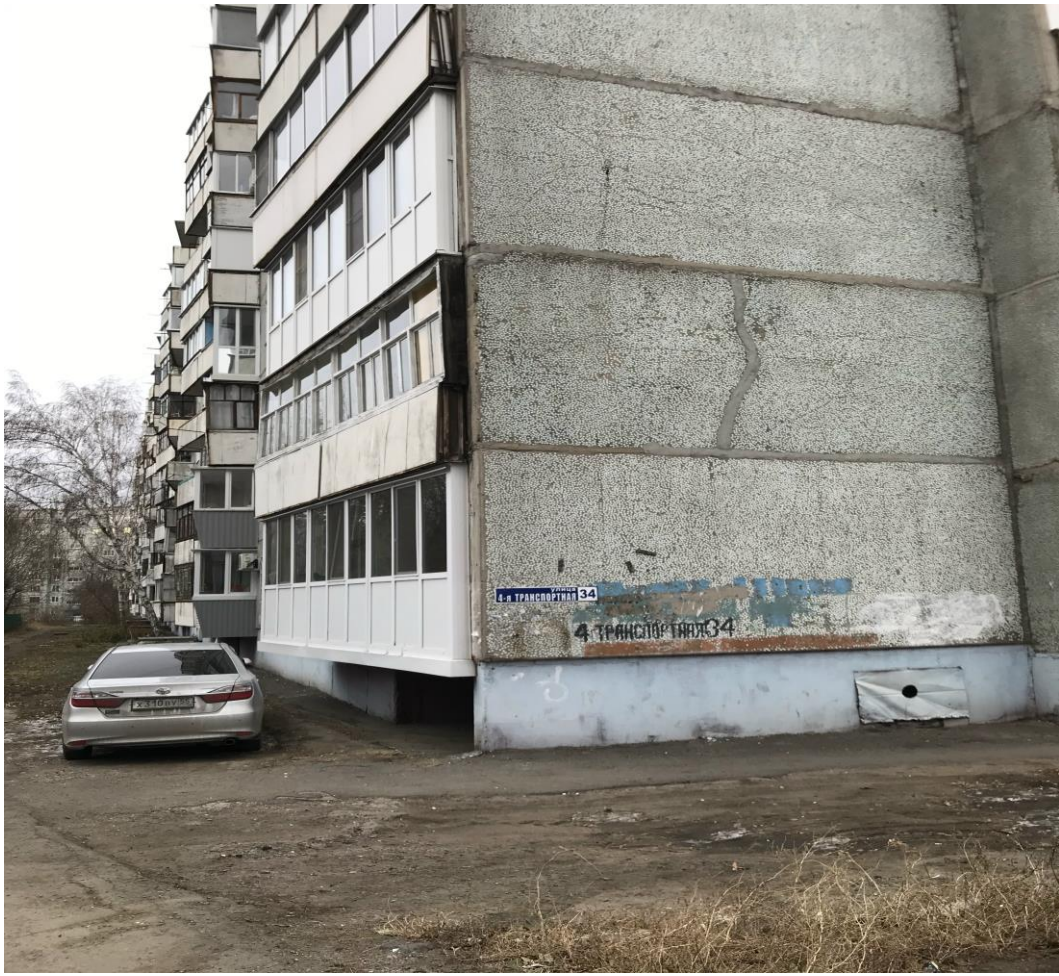
Фото 4. Объект недвижимости. Дата и время съемки: 31.10.2022, 09:37.