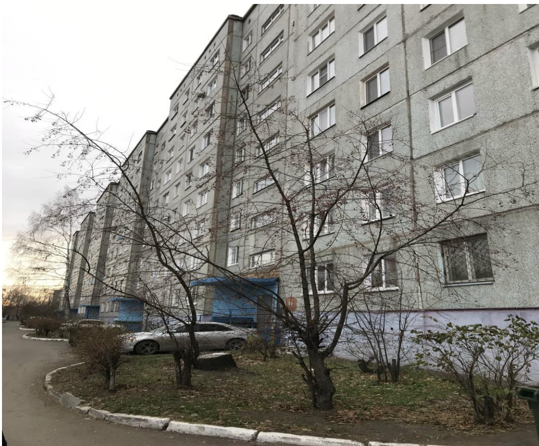
Фото 2. Объект недвижимости. Дата и время съемки: 31.10.2022, 09:37.