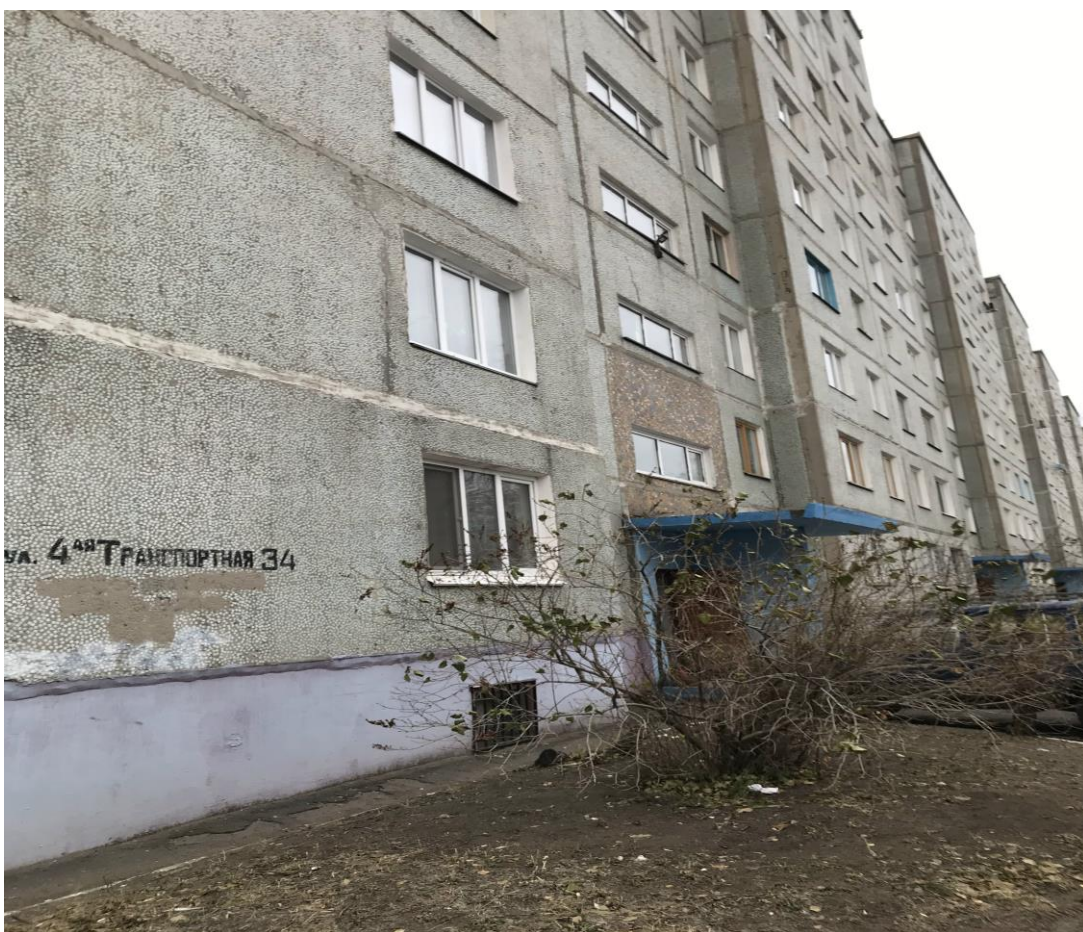
Фото 3. Объект недвижимости. Дата и время съемки: 31.10.2022, 09:37.