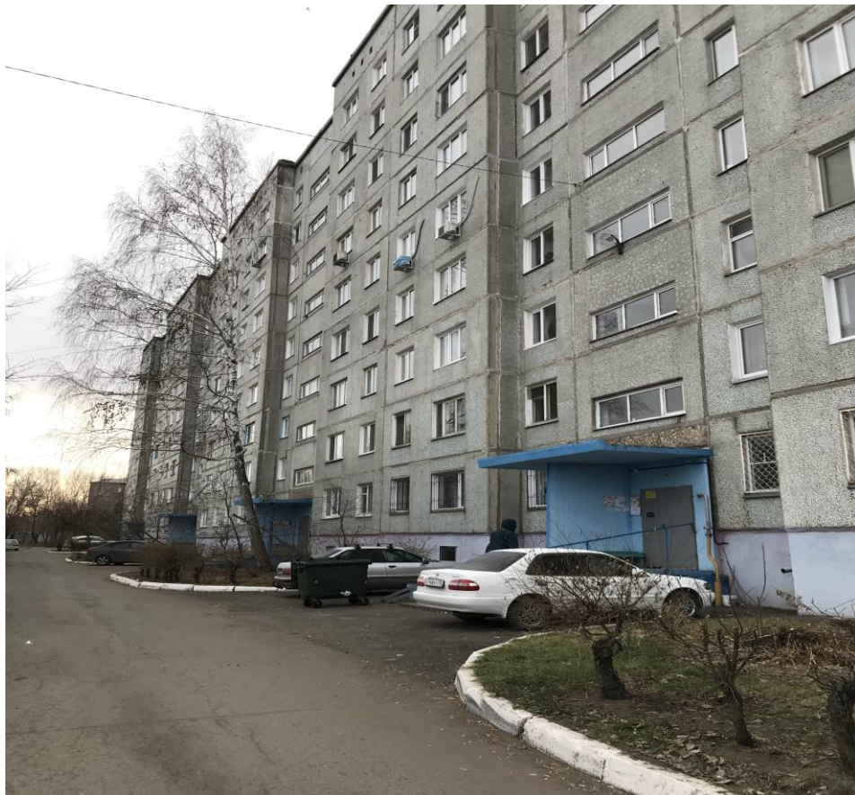
Фото 5. Объект недвижимости. Дата и время съемки: 31.10.2022, 09:37.