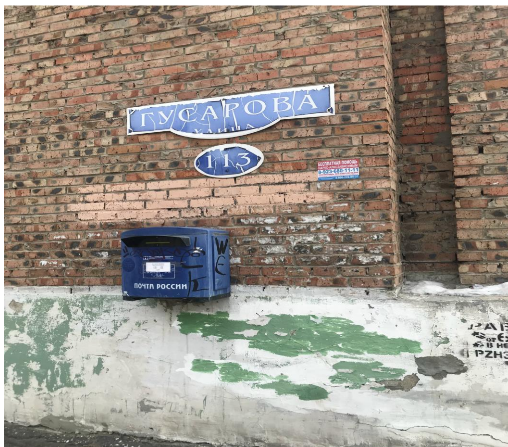
Фото 1. Объект недвижимости. Дата и время съемки: 02.03.2022, 09:32.