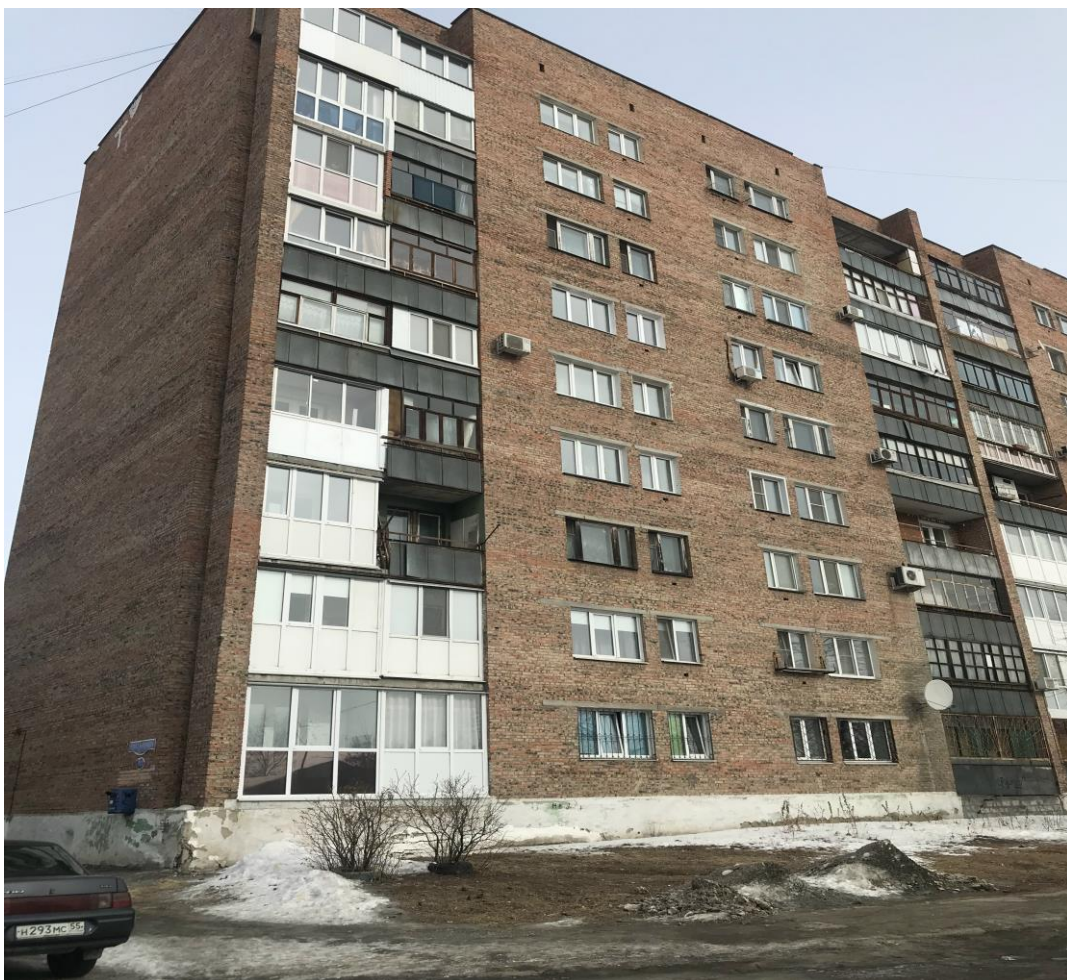
Фото 2. Объект недвижимости. Дата и время съемки: 02.03.2022, 09:32.