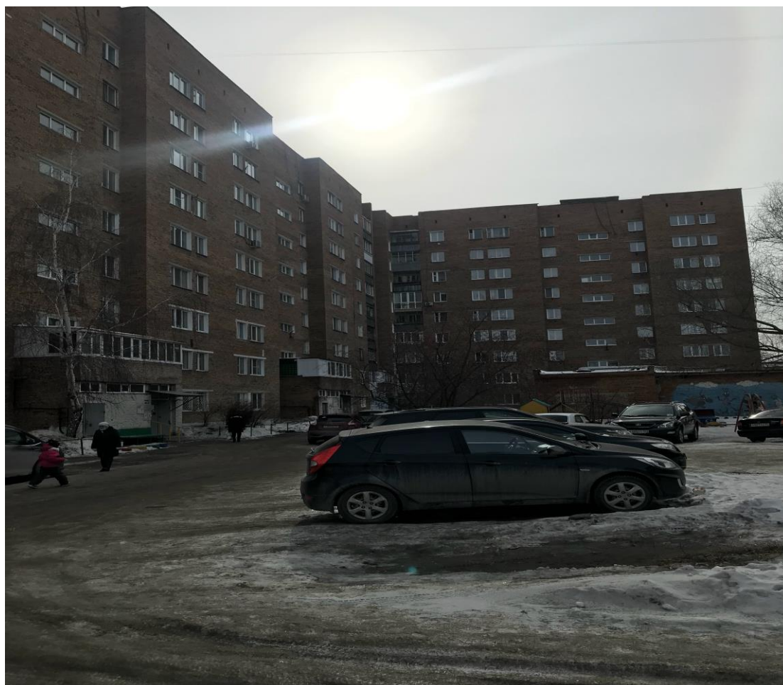
Фото 5. Дата и время съемки: 02.03.2022, 09:32.