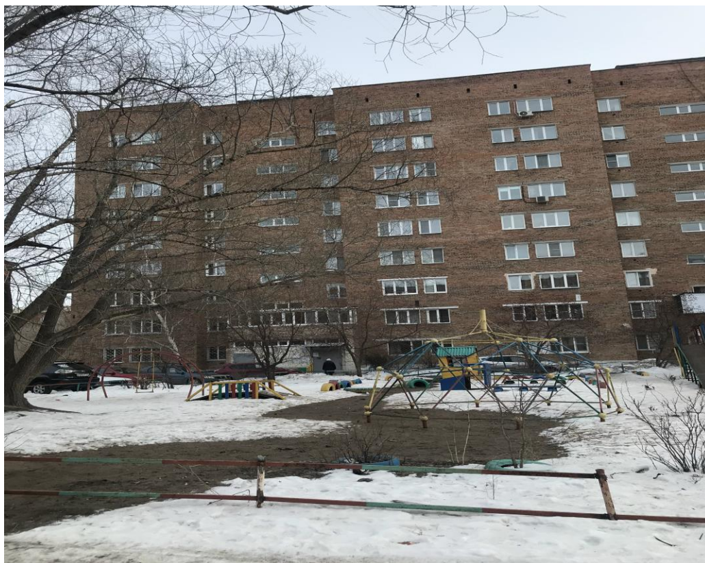
Фото 4. Дата и время съемки: 02.03.2022, 09:32.