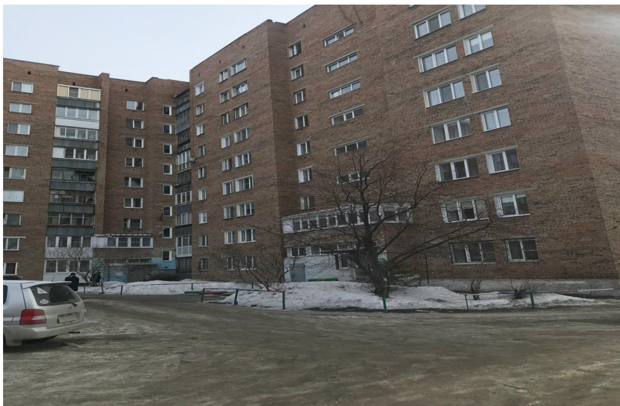
Фото 3. Дата и время съемки: 02.03.2022, 09:32.