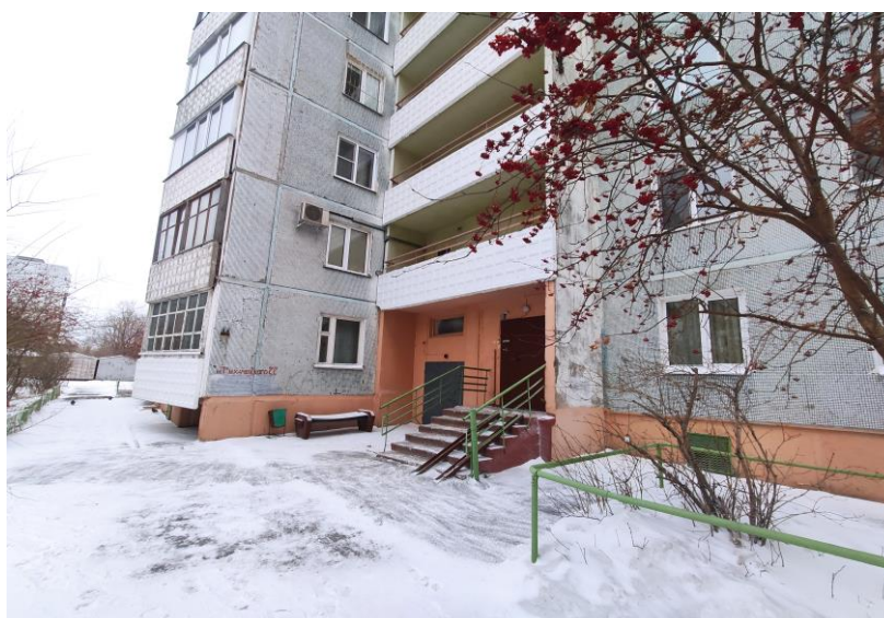
Фото 2. Объект недвижимости. Дата и время съемки: 22.11.2021, 14:20.