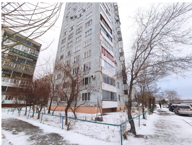
Фото 1. Объект недвижимости. Дата и время съемки: 22.11.2021, 14:20.