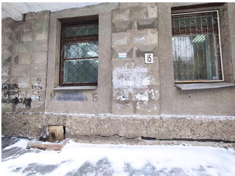
Фото 5. Объект недвижимости. Дата и время съемки: 22.02.2023, 09:00.