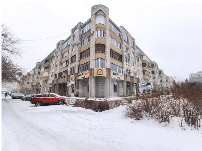
Фото 2. Объект недвижимости. Дата и время съемки: 22.02.2023, 09:00.