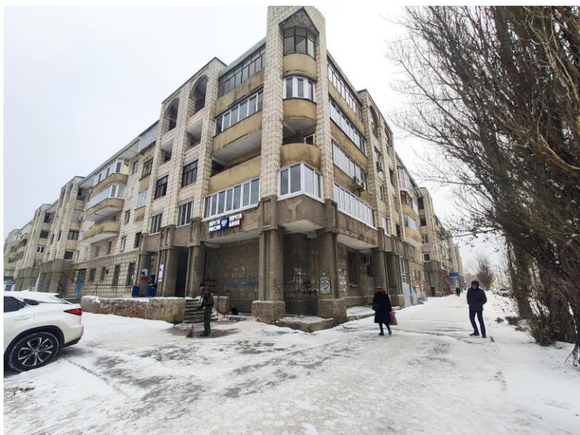
Фото 4. Объект недвижимости. Дата и время съемки: 22.02.2023, 09:00.