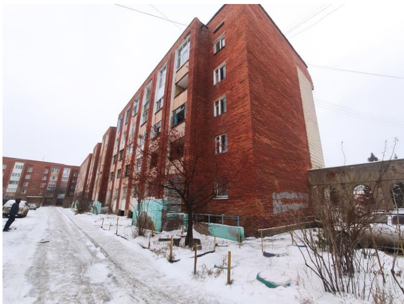
Фото 3. Объект недвижимости. Дата и время съемки: 22.02.2023, 09:00.