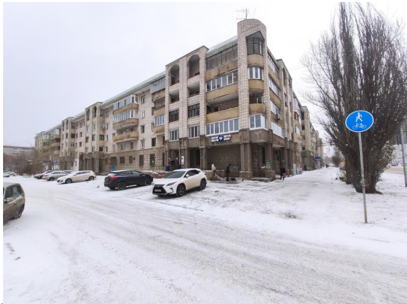
Фото 1. Объект недвижимости. Дата и время съемки: 22.02.2023, 09:00.