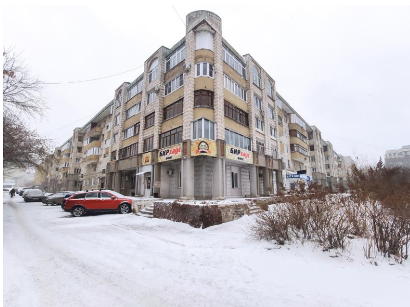
Фото 2. Объект недвижимости. Дата и время съемки: 22.11.2021, 11:30.