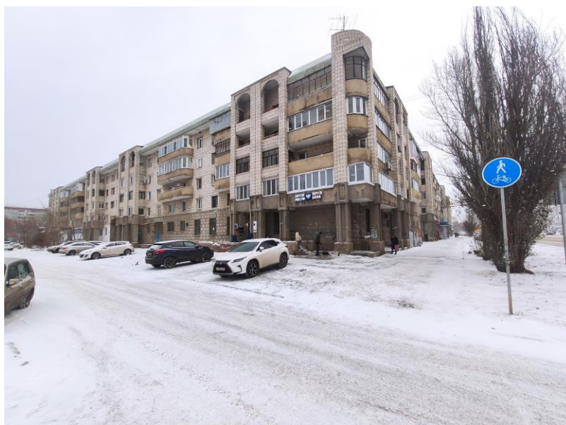
Фото 1. Объект недвижимости. Дата и время съемки: 22.11.2021, 11:30.