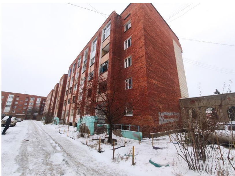
Фото 3. Объект недвижимости. Дата и время съемки: 22.11.2021, 11:30.