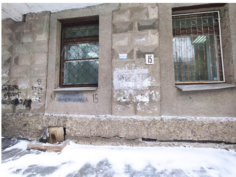
Фото 5. Объект недвижимости. Дата и время съемки: 22.11.2021, 11:30.