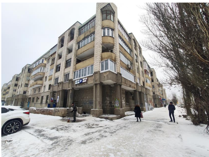
Фото 4. Объект недвижимости. Дата и время съемки: 22.11.2021, 11:30.