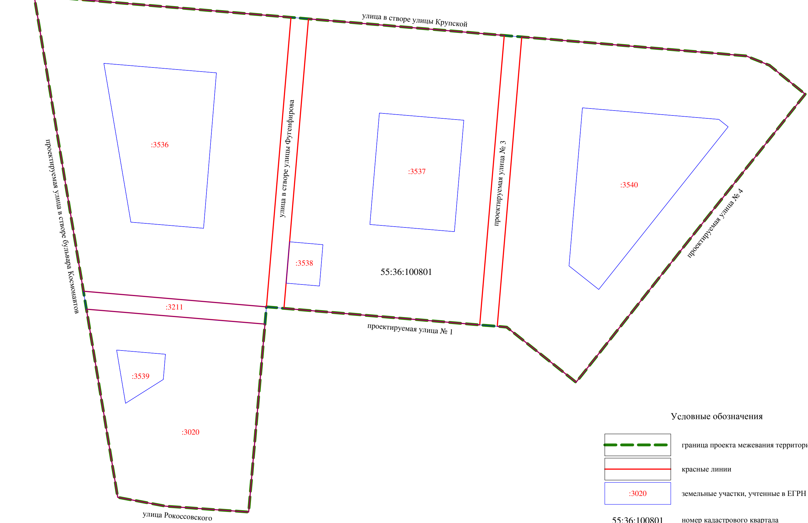
Схема кадастрового плана территории М 1:5000