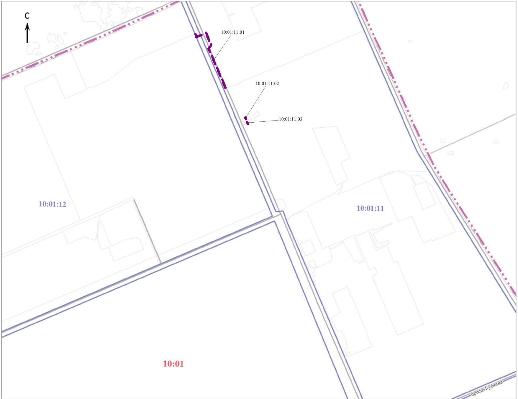
Схема расположения границ проектирования и элементов планировочной структуры