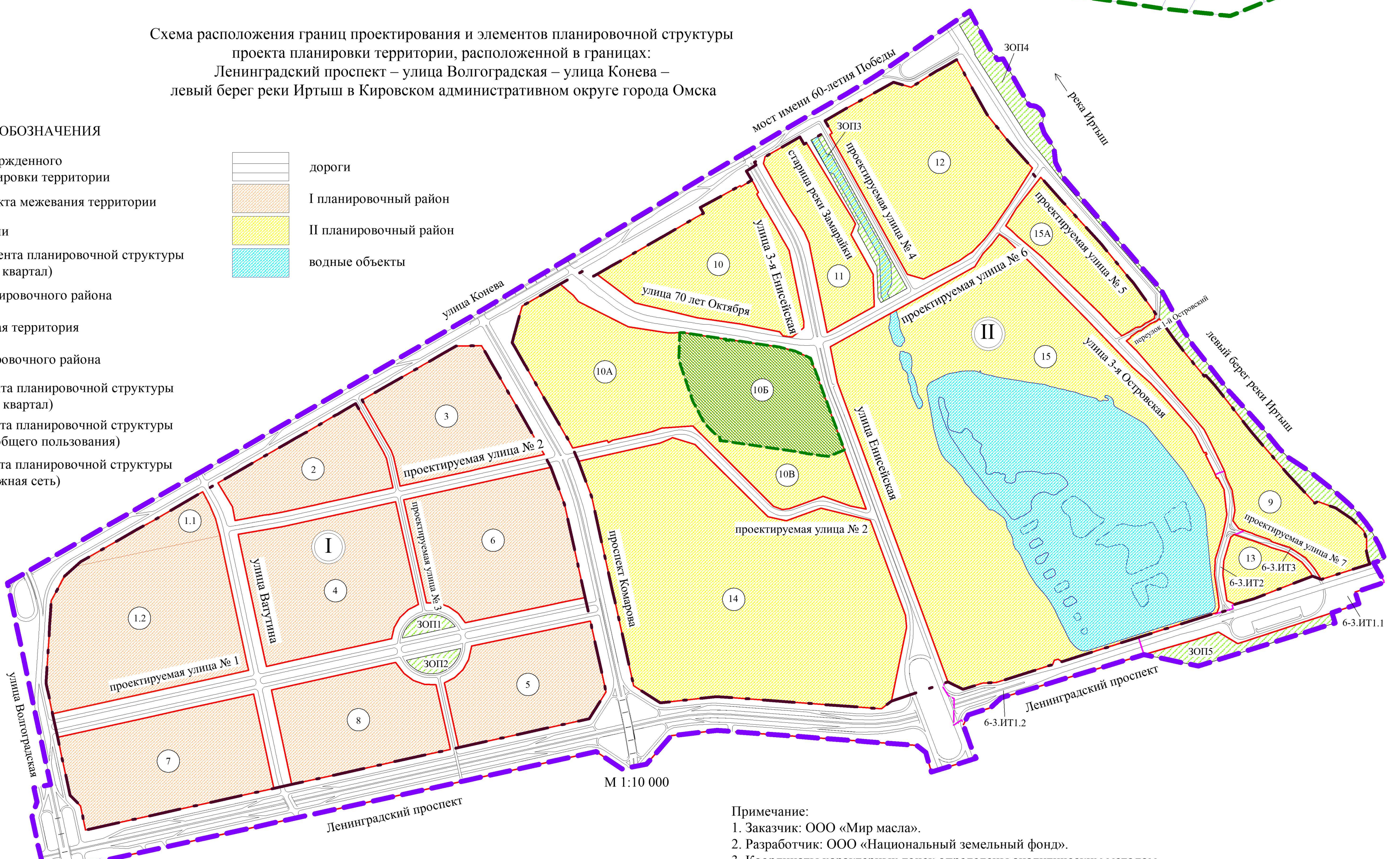
Схема расположения границ проектирования и элементов планировочной структуры проекта планировки территории, расположенной в границах: Ленинградский проспект – улица Волгоградская – улица Конева – левый берег реки Иртыш в Кировском административном округе города Омска

Примечание: 1. Заказчик: ООО «Мир масла». 2. Разработчик: ООО «Национальный земельный фонд». 3. Координаты характерных точек определены аналитическим методом, средняя квадратическая погрешность местоположения характерных точек не более 0,10 м.