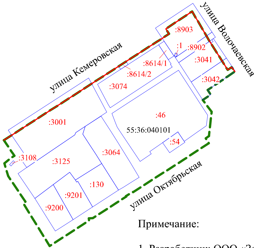
1 этап образования земельных участков Схема кадастрового плана территории М 1:2500