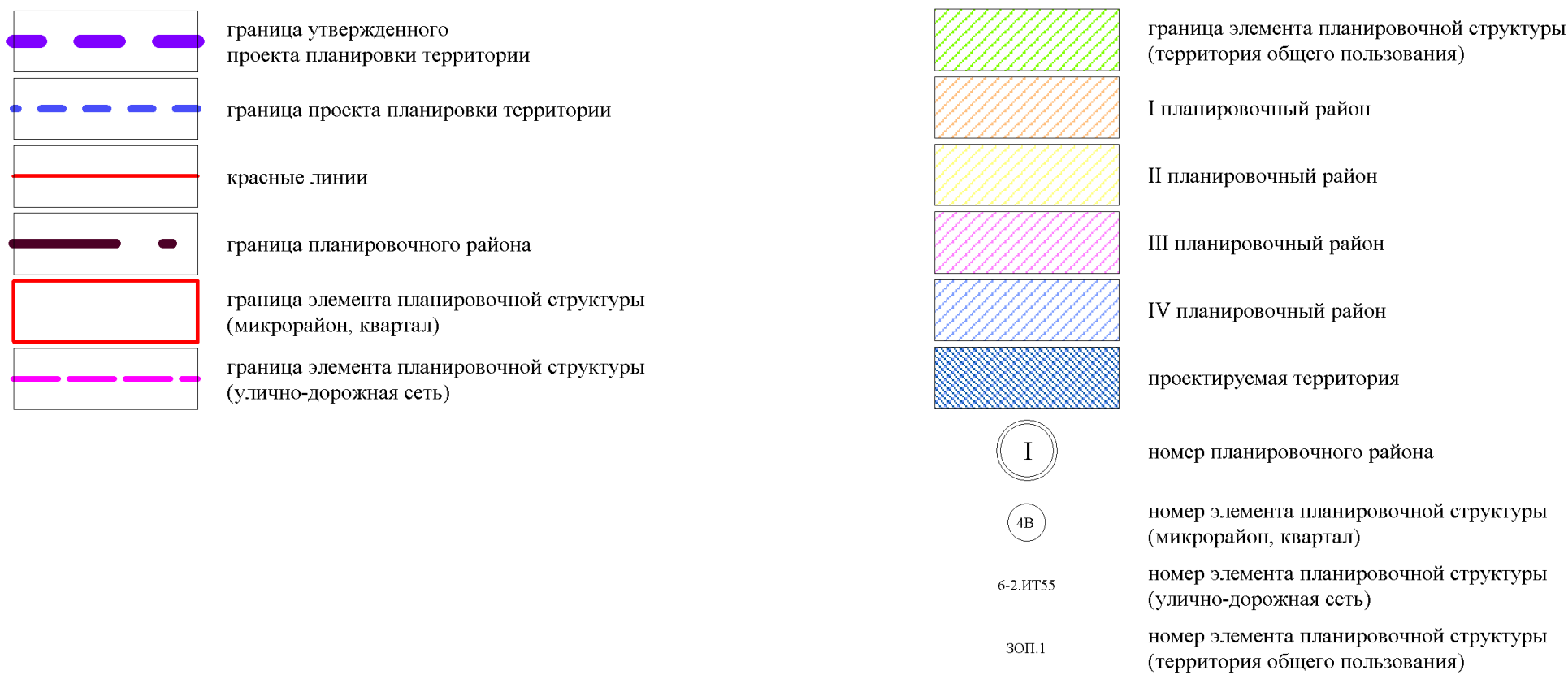
Схема расположения границ проектирования и элементов планировочной структуры проекта планировки территории, расположенной в границах: улица Лукашевича – улица Волгоградская – улица Конева – левый берег реки Иртыш в Кировском административном округе города Омска