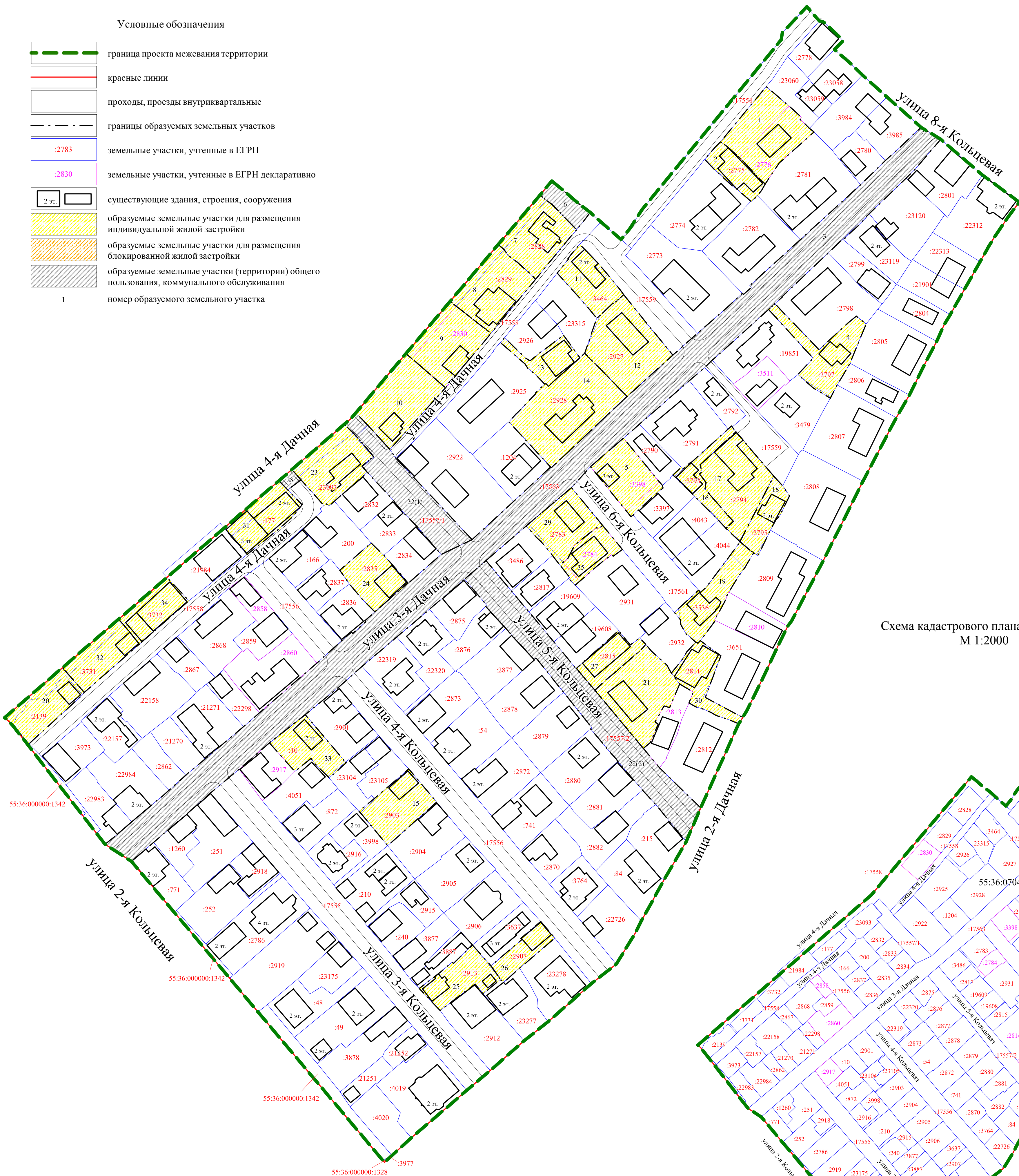
Схема кадастрового плана территории М 1:2000