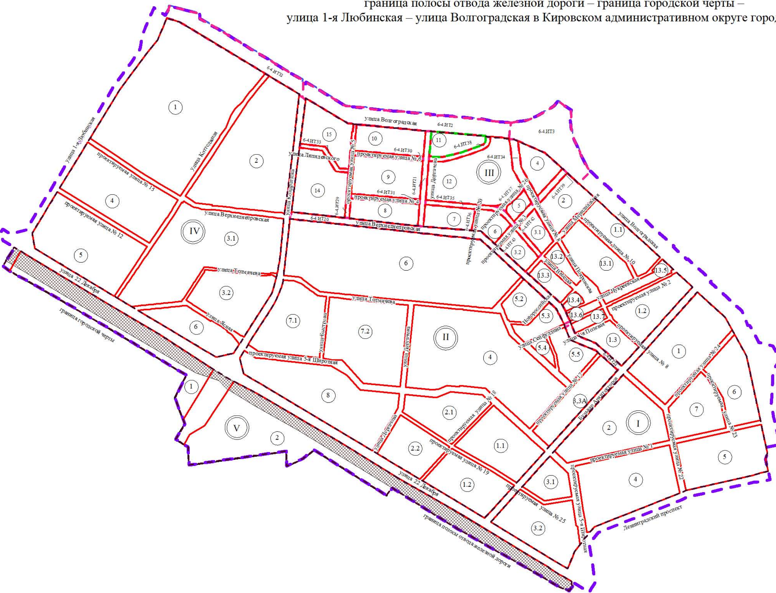
Схема расположения границ проектирования и элементов планировочной структуры проекта планировки территории, расположенной в границах: Ленинградский проспект – граница полосы отвода железной дороги – граница городской черты – улица 1-я Любинская – улица Волгоградская в Кировском административном округе города Омска